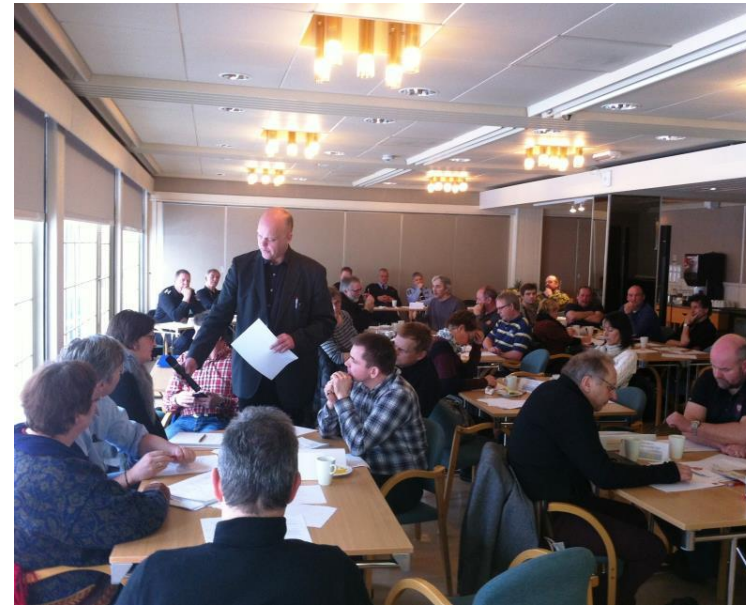
Kommuneøvelse – langvarig strømbrudd, Brønnøysund

Kontroll av arealplaner, jf. plan- og bygningsloven