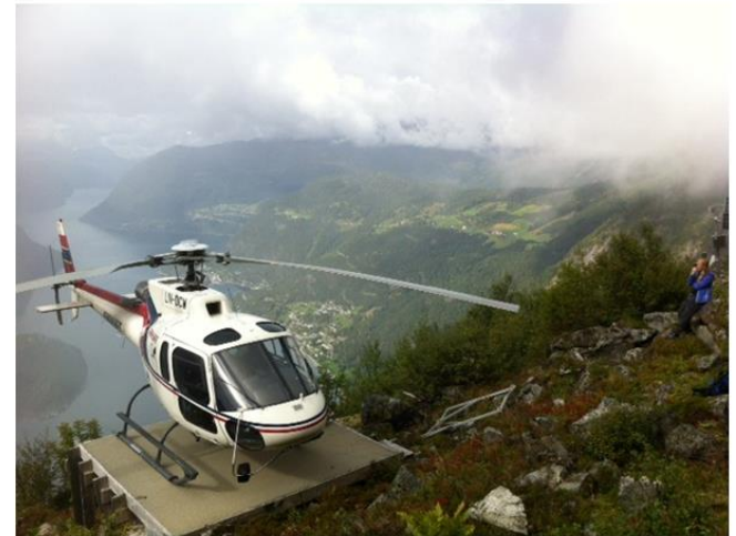
Aktørplan - generell del