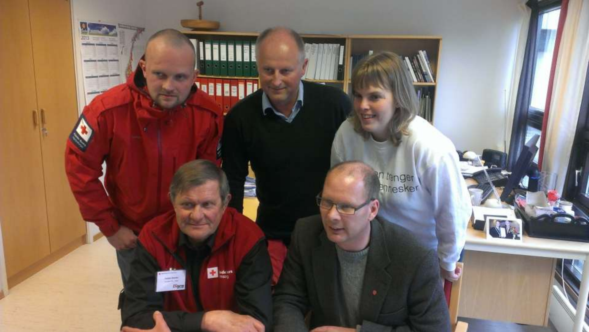
Samarbeidsavtale med Røde Kors 02.05.13