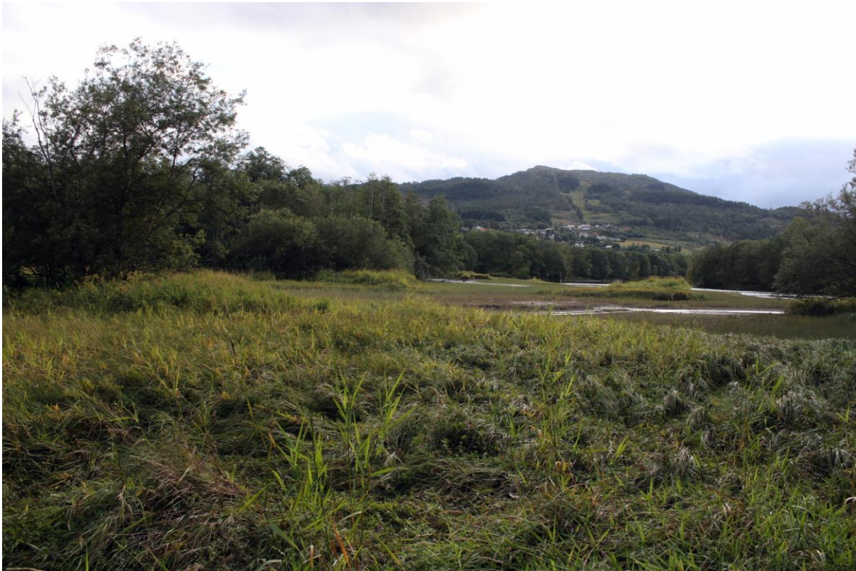
Deler av Grimsmoen delområde sett frå aust

Det vart totalt registrert 31 forskjellige fugleartar under dei tre takseringane. Resultata er vist i tabellen nedanfor.