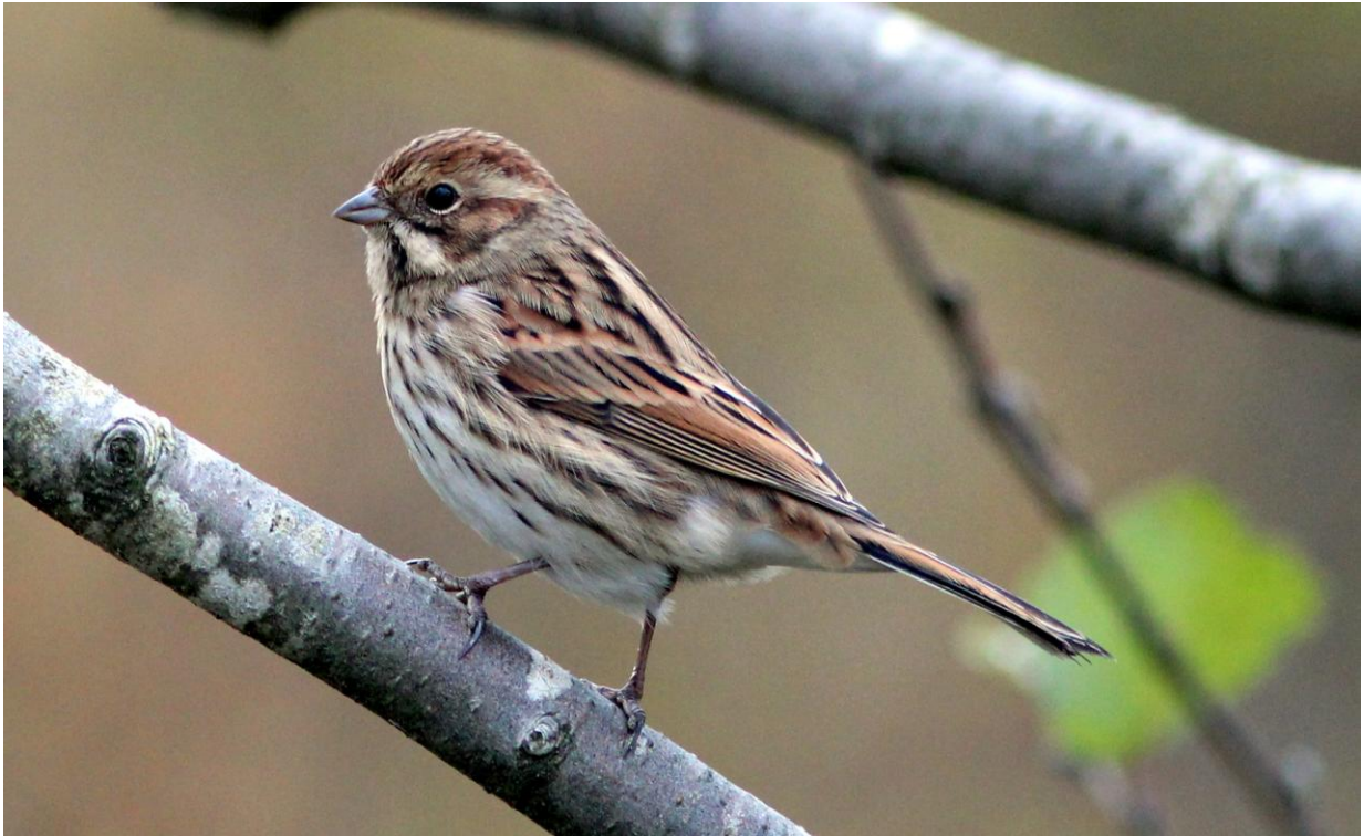
Sivpurv er ein karakterfugl i Sæterøya naturreservat.