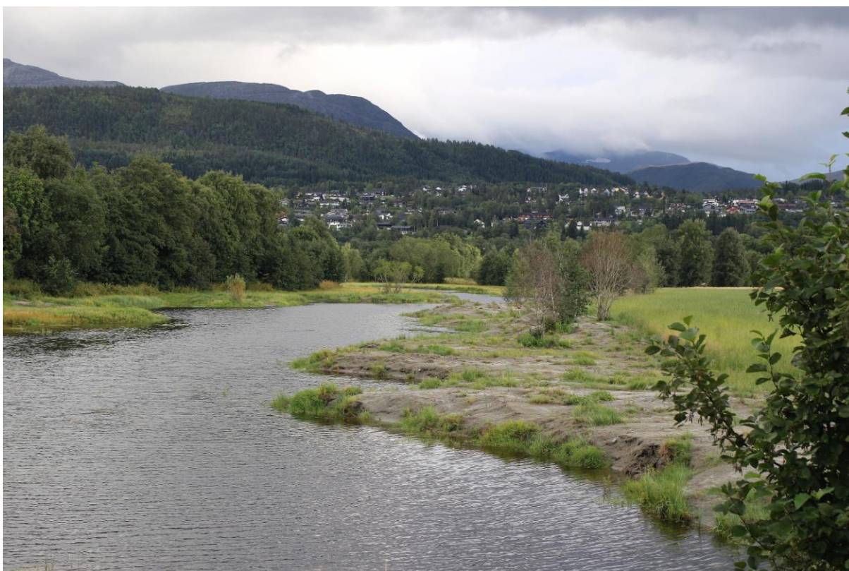
Øyamoan, den delen av Sæterøya delområde, som har gjennomgått størst endring i 2018.

Hausten 2017 starta arbeidet med opprenskinga av det gamle elveløpet frå Øyamoan til Sæterøya. Hensikten var å restaurere kroksjøen og ivareta verneverdiane. Etter at arbeidet vart ferdig våren 2018, har det auka vasstanden betrakteleg, spesielt ved Øyamoan.