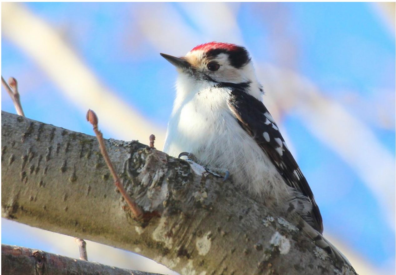
Eit dvergspettpar hekka i løvskogen nord i Grimsmoen delområde.