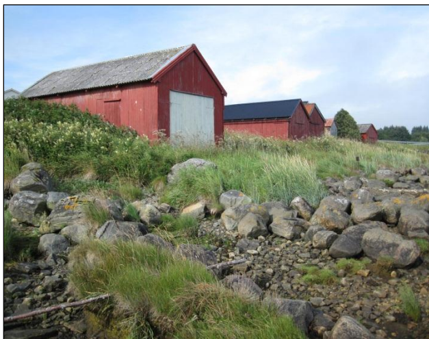
Fig. 10. Naustrekka i vest ligg utanfor, med støene som ligg i reservatet