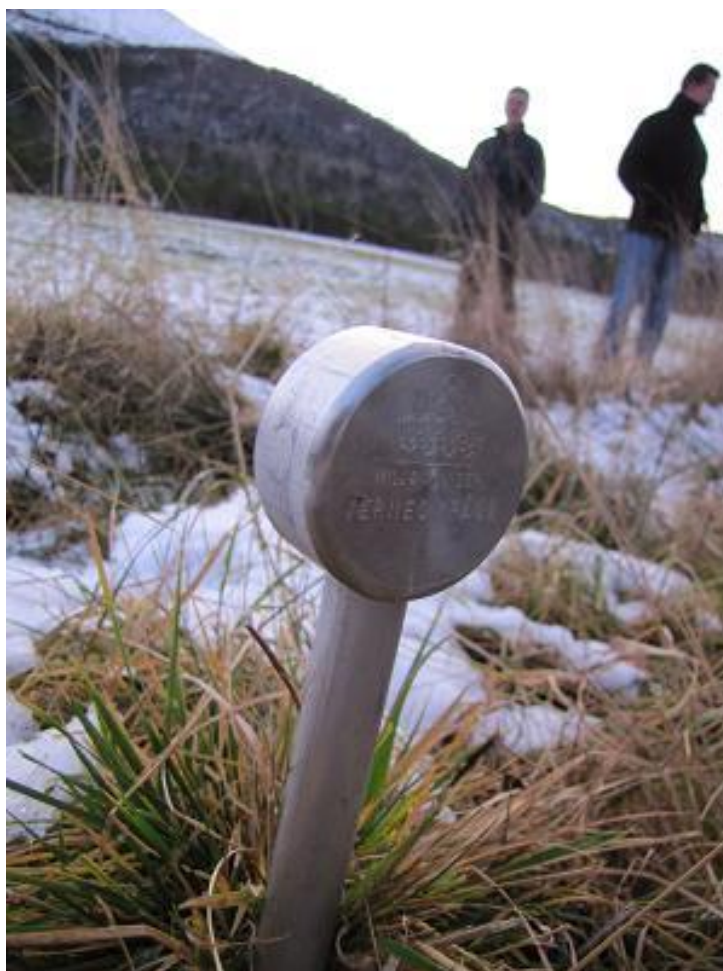
Fig. 13. Grensemerke for verneområde

Forvaltingsplanen for Hustadbukta naturreservat gjeld fram til ny forvaltingsplan er vedtatt. Fylkesmannen er ansvarleg for revideringa av planen. Ein tek sikte på å gjere dette ca. kvart 10. år, første gong ca. 2020. Fylkesmannen kan revidere planen på eit tidligare tidspunkt om det er nødvendig. Bevaringsmåla vil bli reviderte i samsvar med nasjonale standardar når desse føreligg, uavhengig av rulleringa av forvaltingsplanen.