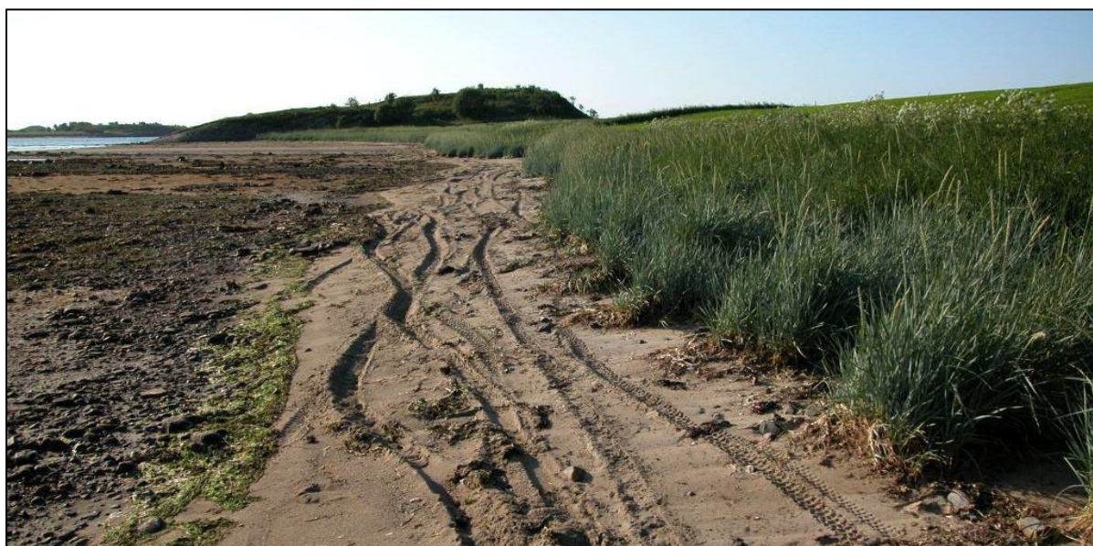
Fig.7. Terrengsykling i reservatet gjev slitasje

Elles er det nemnt i forskrifta at det er unntak frå vegetasjonsfredinga når det gjeld sanking av matsopp og bær (§ 4 punkt 3). Det er likevel viktig å hugse at vegetasjonen generelt er freda,