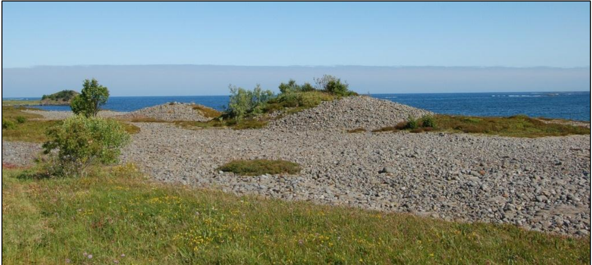
Fig. 8. Gravrøysene før skjøtsel