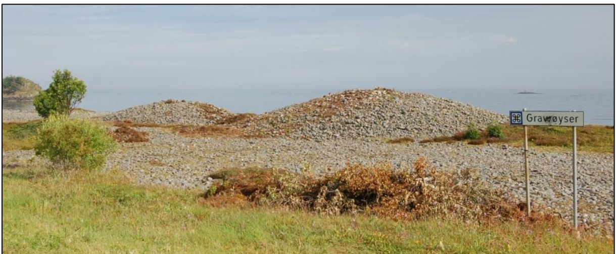
Fig. 9. Gravrøysene etter skjøtsel