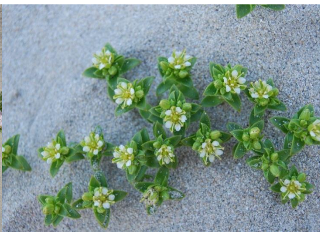
Fig. 4: Strandarve er derimot vanleg

Ved Nerland (austsida av bukta) og Malefeta (vestsida av bukta) finst sørlege sanddyner med sandstorr og strandreddik. Ved Malefeta er det sparsamt med sanddyner i dag. Lokaliteten har ifølgje Holten (1986b) mellom anna det sjeldne plantesamfunnet strandreddik-forstrand (V4a), elles fordyne med strandarve (V6c), tangmeldevoll (V1c), fordyne med strandrug (V6b), og etablerte sanddyner (W2). I indre deler finst ulike saltenger, somme stader også strandberg. I nordre del ved Malefeta mot gravhaugane finst dels skjelsandenger og kalkrike strandberg som no er i attgroing.