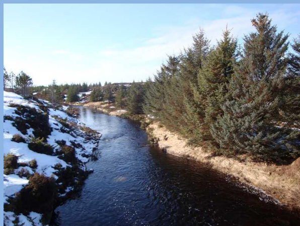
Fig 5. Faktaboks sitkagran.

Sitkagran har si opphavlege utbreiing i det nordvestlege Nord-Amerika. Den blei innført til Noreg grunna evna til å vokse fort samt evna til å motstå høgt saltinnhald i lufta. Difor er den i størst utstrekning planta langs vestkysten av Noreg, og plantefelt er svært vanlege heilt nord til Troms. Den har stor spreiiingsevne og fortrenger annan vegetasjon. Treet kjennest på den blågrønne fargen på nålene og på dei skarpe nålene. Sitka er kategorisert med Svært høg risiko i norsk svarteliste. Les meir på www.artsdatabanken.no .