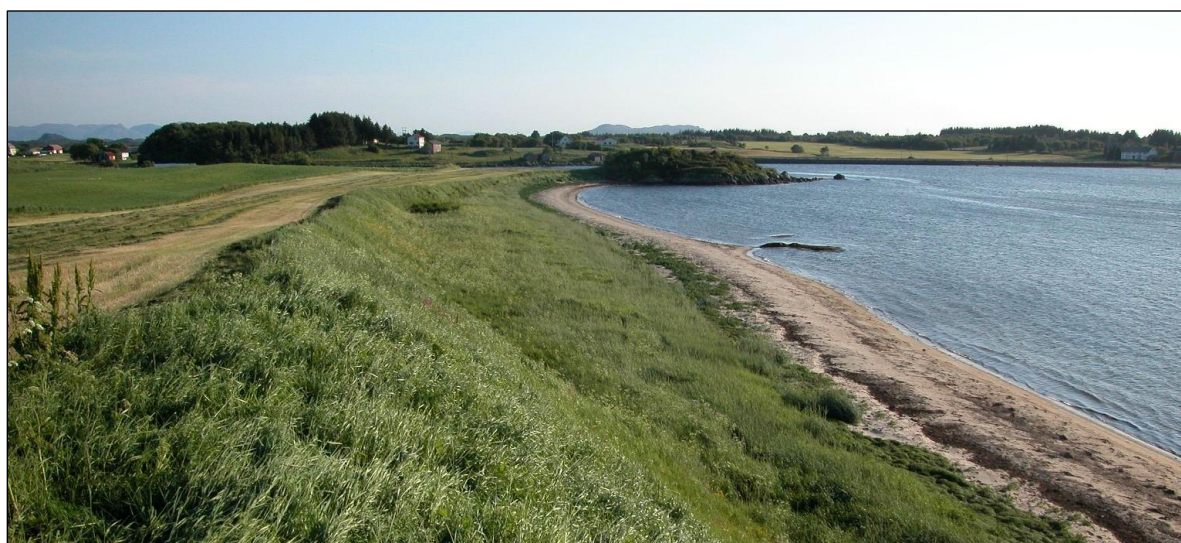
Fig 12. Det er kraftig gjengroing i bakkant av stranda.

Ved Auså er det også aukande gjengroing i bakkant av sanddynene. Her vert det litt tilførsel av gjødsel frå dyrkamarka bakom. Gras- og urtevekstane bør fjernast, anten ved beiting, eller ved at området vert slått seint i sesongen og biomassen vert fjerna.