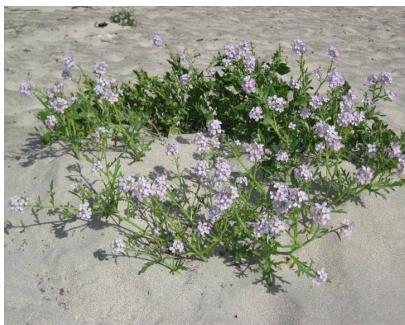
Fig. 3: Strandreddik er sjeldan å finne i reservatet

Fræna kommune kartla naturtypane i kommunen i 2004 (Jordal 2005). Avgrensa lokalitetar blei sorterte og verdsette etter naturtype på ein skala frå A – C (A=svært viktig, B=viktig, C=lokalt viktig), der Hustadbukta blei klassifisert som Havstrand/kyst med verdi A. Historisk er Hustadbukta ein klassisk lokalitet for botanikkinteresserte, og mykje av den systematiske informasjonen er samla tilbake i 1897 (Dahl). Analyser er gjort i 1974, 1984 og 2004.