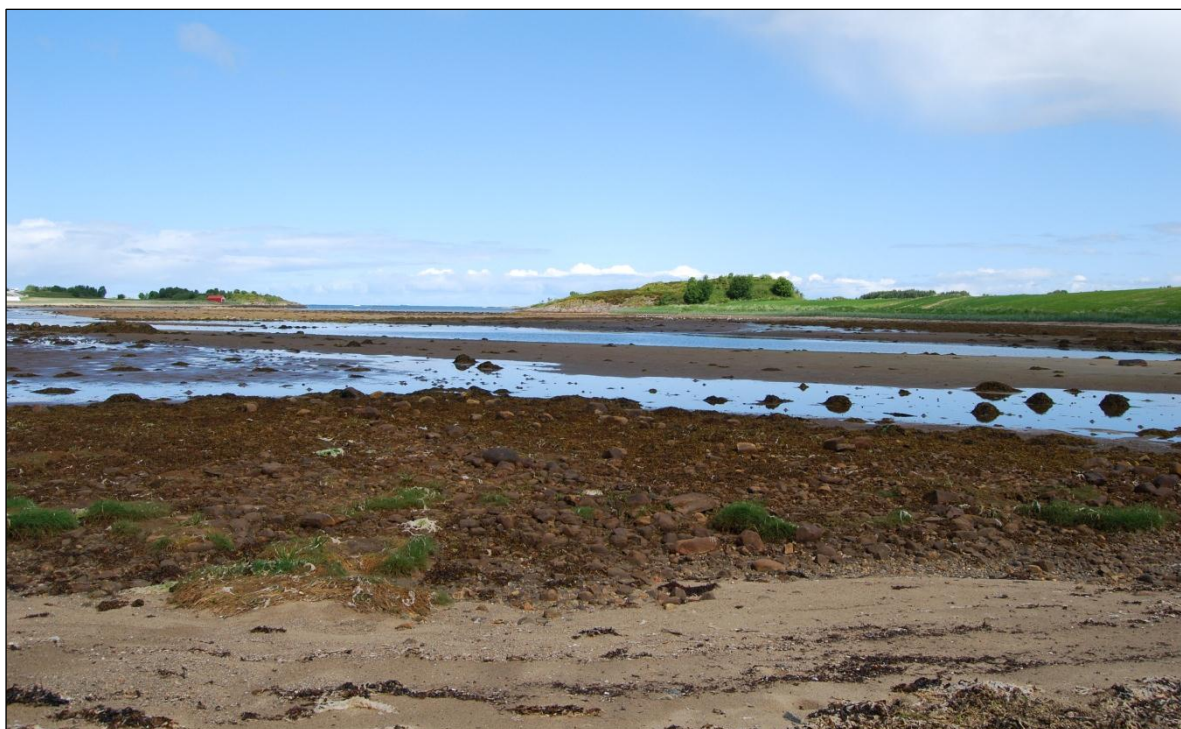
Fig. 2. Store delar av elveosen og bukta fell tørre ved fjære sjø.