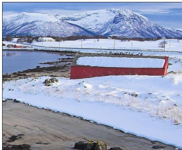
Fig. 11. Enkeltnaust i nord-vest, vegfylling i bakgrunnen