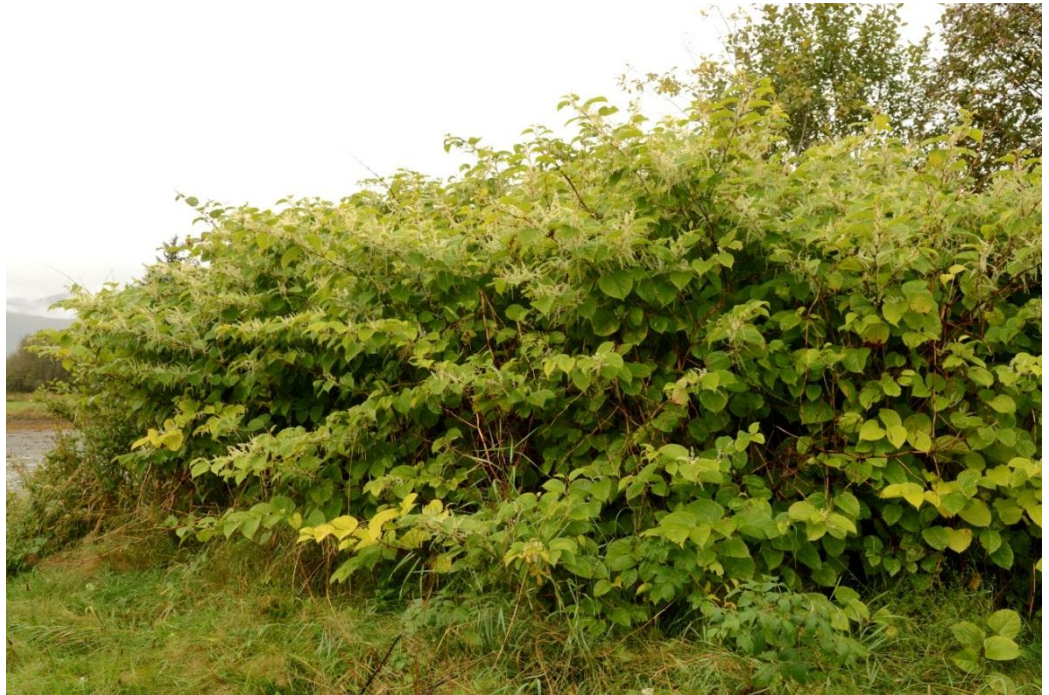
Parkslirekne veks og spreier seg raskt.

Slirekneartane er populære prydblantar i norske hagar. Samtidig er dei nokre av verdas mest problematiske framande artar. Dei har store og breie blad. Stenglane veks raskt, er opprette og kraftige. På ein sesong kan dei bli 2-3 meter høge. Du kan sjå fleire førekomstar av desse plantene langs vegane. Dei