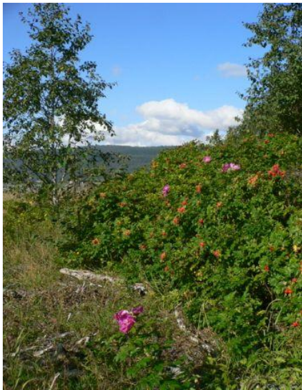
Rynkerose i Surna naturreservat.

Rynkerosa har spreidd seg til dei yttarste isolerte øyane, så vel som inne i fjordane. Her dannar ho store og tette kratt, og fortrenger ofte dei stadedne artane som veks i området frå før. Typisk slår ho seg ned på sand