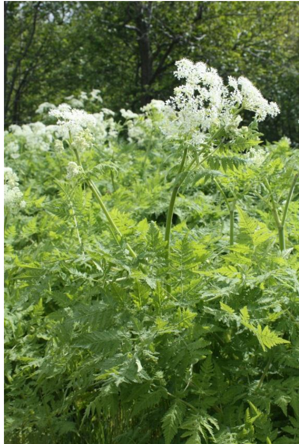
Spansk kjørvel i Molde kommune.

Husk å reingjere utstyr før du nyttar det på andre stader der spansk kjørvel ikkje veks!