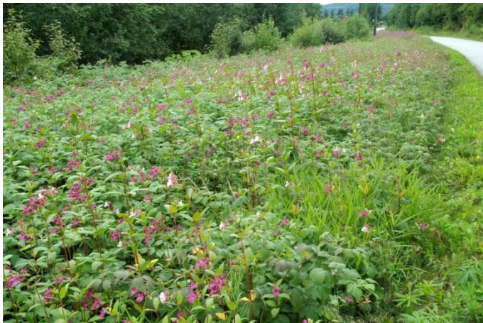
Kjempespringfrø fortrenger andre planter der ho etablerer seg.

I mange land har denne arten og andre innførte springfrøartar blitt eit av dei største problema for heimlege artar i skogsmiljø. Kjempespringfrø fortrenger alle andre planter der ho etablerer seg og dekkjer skogbotnen.