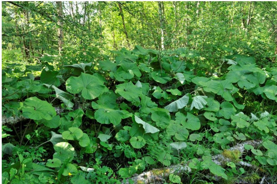
Japanpestrot i Langvatnet naturreservat, Tingvoll.

Japanpestrot og legepestrot spirar tidleg på våren. Japanpestrot har tjukke stengler med gulkvite og rørforma blomstrar, medan legepestrot har raudbrune og kolbeaktege blomsterstander. Etter blomstring kjem blada. Dei kan bli enorme, opptil heile 1 meter i diameter