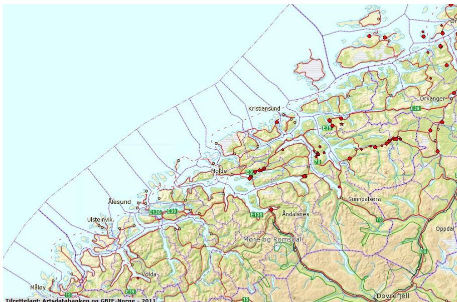
Kjempespringfrø (raude prikkar) spreier seg raskt og er ein stor trussel mot artsmangfaldet i Møre og Romsdal ( http://artskart.artsdatabanken.no ). Du kan zoome deg inn på kartet ved å bruke linken som ligg på heimesida til Fylkesmannen i Møre og Romsdal.

Luk plantene tidleg i juni da dei er små. Det er viktig å fjerne dei før dei får frø. Eventuelle frø som ligg i bakken er spiredyktig i to år, så eit tiltak mot denne arten bør følgjast opp gjennom tre vekstsesongar. Legg plantedelar med frø og frøkapslar i restavfallet til forbrenning. Om det er store mengder avfall bør du ta kontakt med eit renovasjonsselskap for råd. Gi beskjed om at det må brennast.