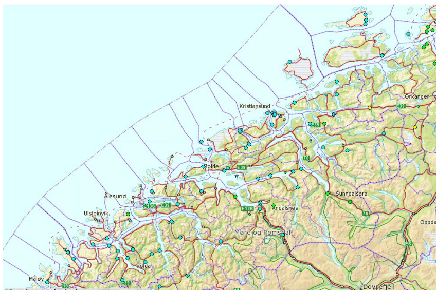
Parkslirekne (turkiske prikkar) og kjempeslirekne (grøne prikkar) spreier seg raskt i Møre og Romsdal ( http://artskart.artsdatabanken.no ). Du kan zoomme deg inn på kartet ved å bruke linken som ligg på heimesida til Fylkesmannen i Møre og Romsdal.

Unngå å flytte jord frå område der slirekne veks.