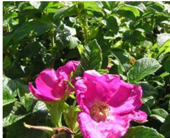
Rynkerose i blomst.

og mager jord, som til dømes strender. Da har gjerne frø eller andre plantedelar blitt frakta langs vegar eller med vatn til dei nye områda.