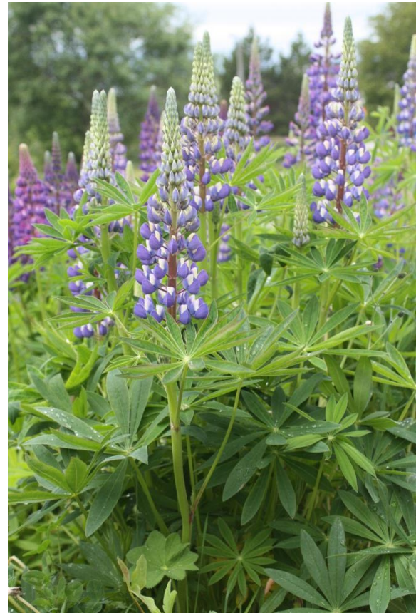
Hagelupinen er vakker å sjå på, men ein trussel mot det biologiske mangfaldet i fylket vårt.

Husk å gjere reint utstyret før du nyttar det i område der det ikkje veks lupin!