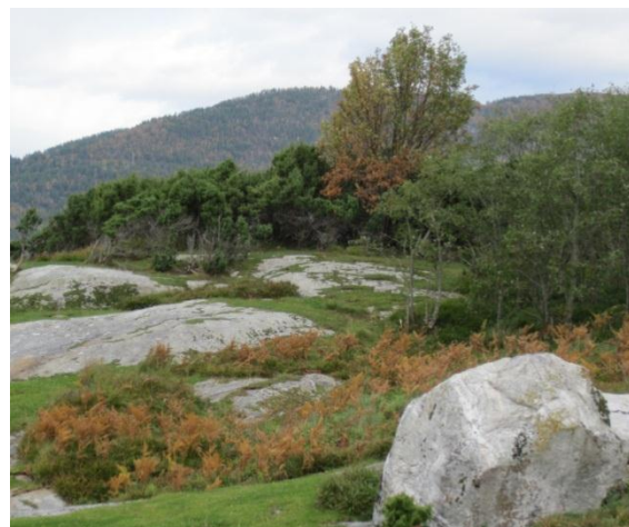
Figur 3: Vistdalsholmen er prega av gjøngroing.

Tre, buskar og kratt må fjernast før dei blir så høge og av eit slikt omfang at det reduserer kvaliteten på området som hekkeplass for sjøfugl. Vegetasjonen bør haldast så låg at han ikkje tek den frie utsikta for fuglar som ligg på reir, gir færre reirplassar eller kan fungere som sitjeplassar/skjul for eggrovarar som kråke og ramn. Det bør likevel stå att noko kratt av krypeiner nærast sjøen, sidan slikt kratt gir attraktive hekkeplassar for t.d. ærfugl.