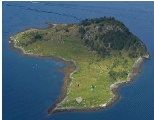
Figur 2: Flyfoto av Feøya naturreservat.

Sjøfuglkoloniane på Feøya er blant dei største i midtre fjordstrøk. Fiskemåse, gråmåse, svartbak og sildemåse hekkar her. Gråmåse har hatt den største hekkebestanden av sjøfuglane på øya sidan 1970-talet og fram til i dag. I 2011 var hekkebestanden på 225-230 par. Bestanden av sildemåse ser ut til å ha auka (om lag 190 par i 2011), medan hekkebestanden av svartbak og fiskemåse har blitt lågare (35 og 15-20 par i 2011). Både makrell- og raudnebbterne har nytta området som hekkelokalitet på slutten av 1970- og på 1990-talet, men blei ikkje registrert hekkande i 2011. Andre artar som tidlegare eller framleis hekkar på Feøya er blant anna ærfugl, teist, grågås, tjeld og siland.