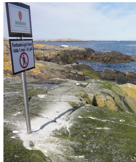
Figur 3: Merking av Grip naturreservat.

Med ein stadig veksande privat småbåtflåte på kysten og i fjordane, er det viktig å informere sjøfarande om vernet og om ferdselsforbodet i hekketida. Vi ser det også som eit mål å informere om fuglelivet og naturkvalitetane i sjøfuglreservata. Fylkesmannen vil utarbeide informasjonsplakatar om naturreservatet med m.a. kart, foto og vernereglar til å hengje opp på plassar der båtfolk ferdast, t.d. småbåthamna.