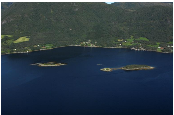
Figur 2: Flyfoto av Bøfjordholmane naturreservat.

Forvaltningsmål er eit samleomgrep for alle målsettingar knytte til eit verneområde, t.d. verdier knytte til areal, artar eller brukar- og næringsinteresser.