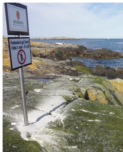
Figur 4: Merking av Grip naturreservat.

For å unngå ulovleg ferdsel og ilandstiging i naturreservata er det sett opp skilt på stader der det er naturleg å legge til med eller dra opp båt. Skilta består av eit naturreservatsskilt og skilt om ferdselsforbod i hekketida (figur 4). Begge er festa på same stolpe. Det vil òg bli sett opp skilt på strategiske plassar på land, t.d.