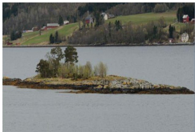
Figur 3: Behov for rydding av tre og kratt på Dragsetholmen, sett mot sør.

Tre, buskar og kratt må fjernast før dei blir så høge og av eit slikt omfang at det reduserer kvaliteten på området som