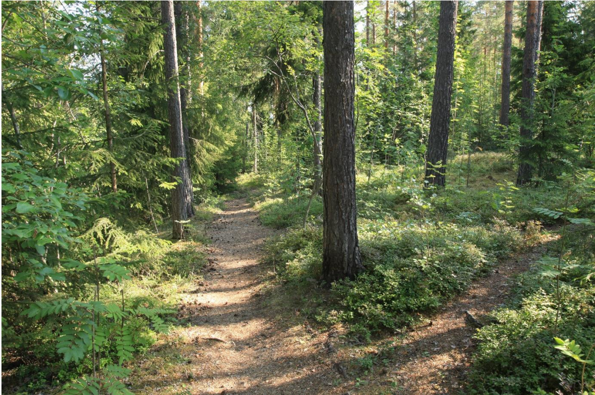
Figur 2. Parti fra lågurtfuruskogen i Kile naturreservat (skjøtselsone 1) – rik barblandingskog og mye brukte turstier.