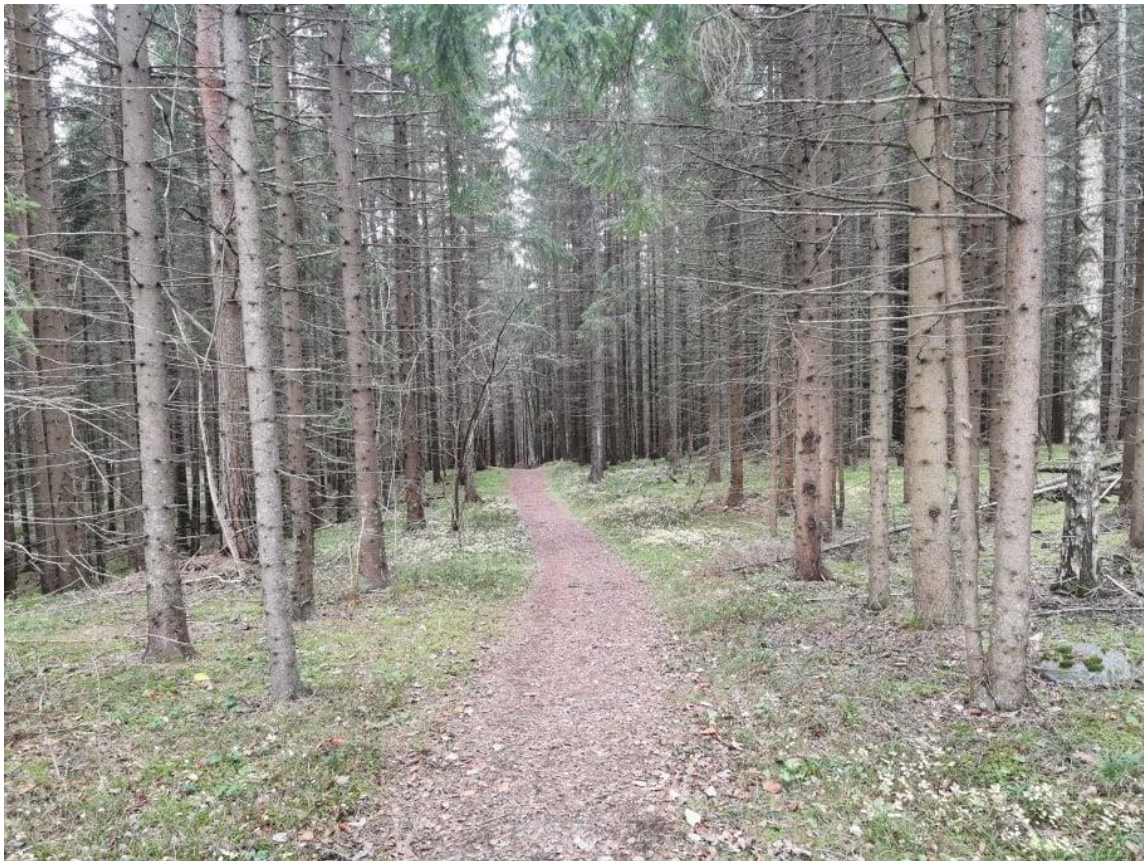
Figur 5. Plantet granbestand i sørøst, sone 6 og 8

Det er gitt er prioritering av tiltakene i skjøtelsesplanen. De fleste tiltakene er gitt en 1. prioritet i første 5-årsperiode.