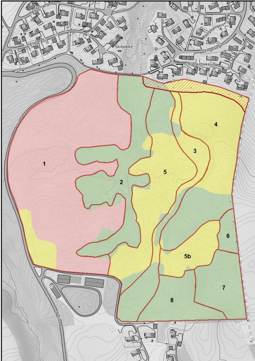
Figur 4. Kile naturreservat, Østre Toten, inndelt i 8 skjøtselsoner, samt inndelt i hogstklasser. Rødt: hogstklasse 5 (hogstmoden). Gult: hogstklasse 4. Grønt: hogstklasse 3 (yngre skog; flatehogd på 1970-80 tallet). Rød skravur i NØ representerer en stripe mellom gangveg og bebyggelse som vil bli foreslått tatt ut av reservatet ved grenseendring.

Det er vedtatt en skjøtselsplan/tiltaksplan, med konkrete skjøtselstiltak der reservatet er delt i 8 skjøtselsoner jf kartvedlegg, hvorav de fleste er gitt 1. prioritet med hensyn på tiltak i første 5-årsperiode (T. E. Brandrud 2022). For detaljert beskrivelse og begrunnelse vises det til skjøtselsplanen.