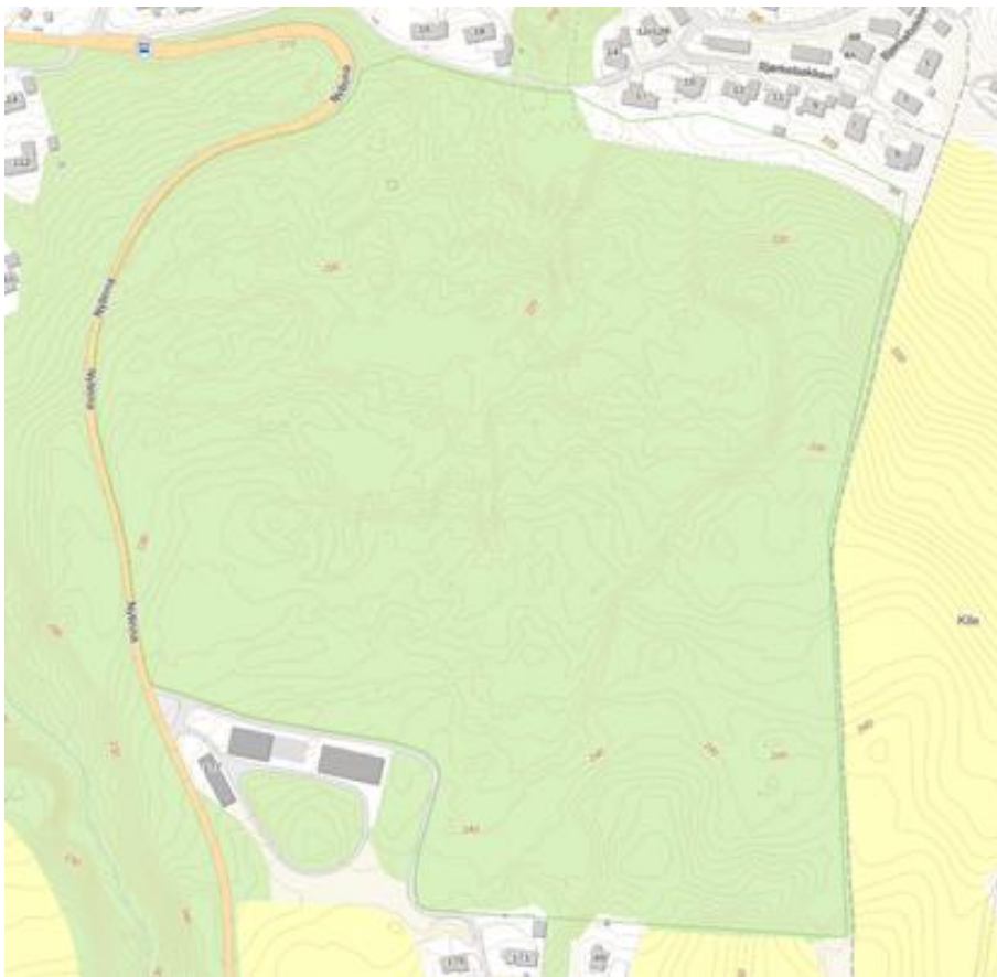
Figur 0. Kile naturreservat, vernegrense er grønn linje. Det hvite arealet i nordøst vil bli foreslått grenset ut av reservatet.