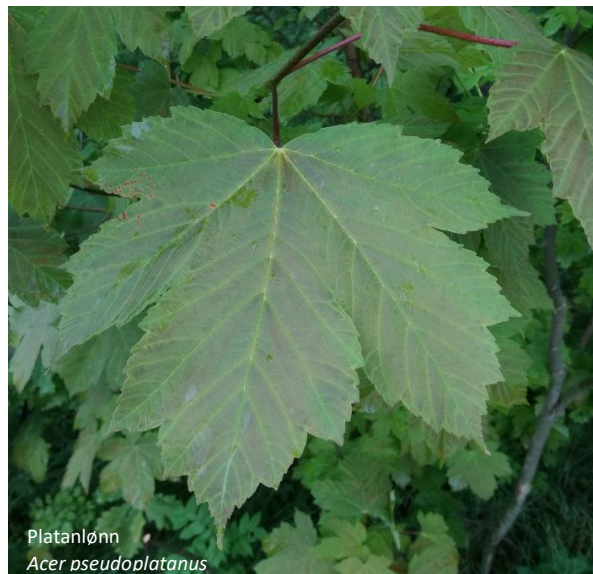
Platanlønn Acer pseudoplatanus

Verneområder: Dokka NR, Kile NR & Vinstradalen NR.