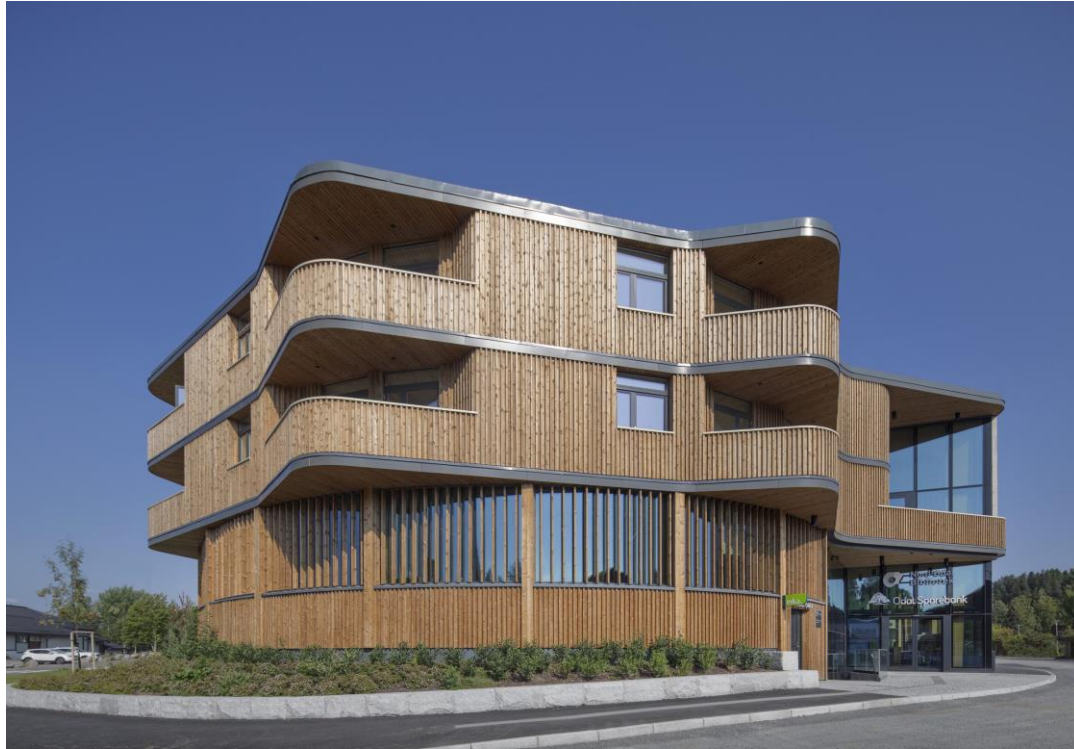
«Samling» - Nytt bibliotek, bank og boliger på Sand i Nord-Odal v/ Helen & Hard arkitekter