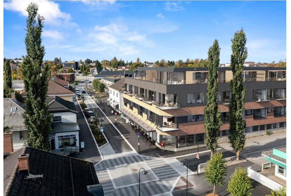
Sentrumsgården i Stange sentrum – transformasjon/påbygg med boliger v/ Andersen og Fremming arkitekter