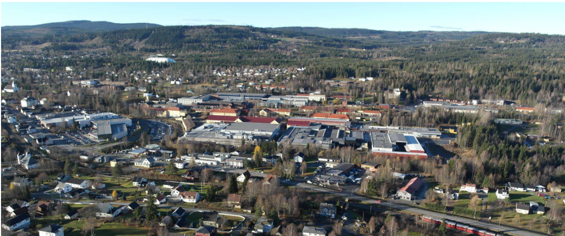
Raufoss industripark fra øst.

Arealet til næringsparken inneholder 40 km asfaltert veinett, og det anslås at det går ca. 25 000 vogntog til og fra parken hvert år. Samlet energiforbruk for industriparken er på ca. 170 GWh per år, som tilsvarer 9 000 husstander.