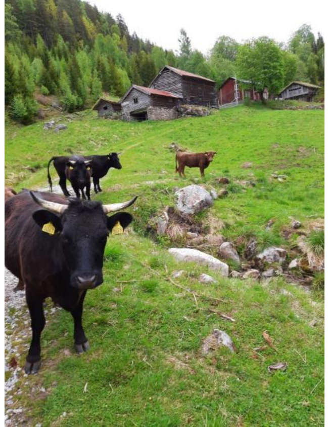
Dexterfe i bratt lende på Skåre i Bygland.