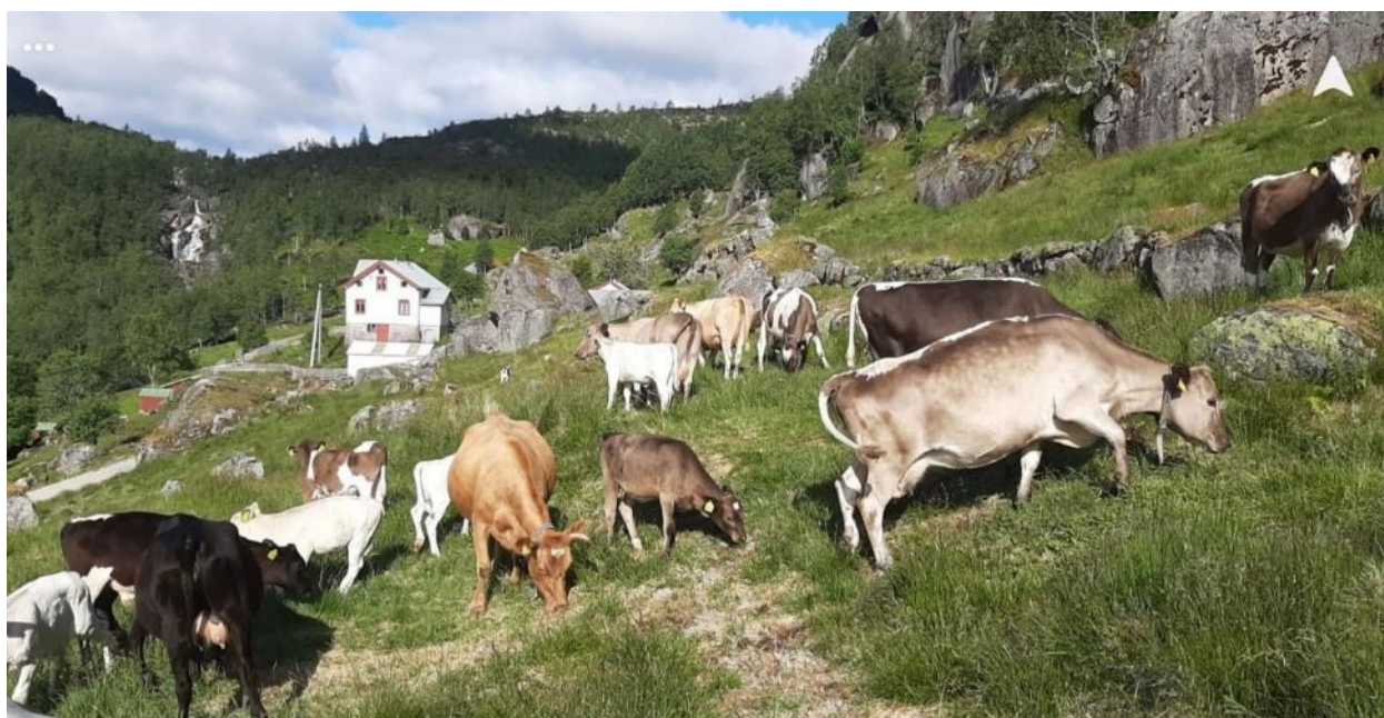
Vestnorsk fjordfe i bratt lende, Salmeli i Kvinesdal.