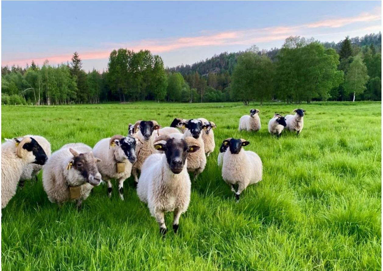
Svartfjes på beite, Birkedal i Grimstad.

Formålet med tiltakene under miljøtema Kulturlandskap er å ivareta jordbrukets kulturlandskap utover det en oppnår gjennom de nasjonale ordningene. Drift av bratt areal og Drift av beitelag skal bidra til å opprettholde tradisjonell drift, mens Beiting av verdifulle jordbrukslandskap skal bidra til å ivareta mer spesielle kulturlandskapsverdier i de prioriterte områdene.