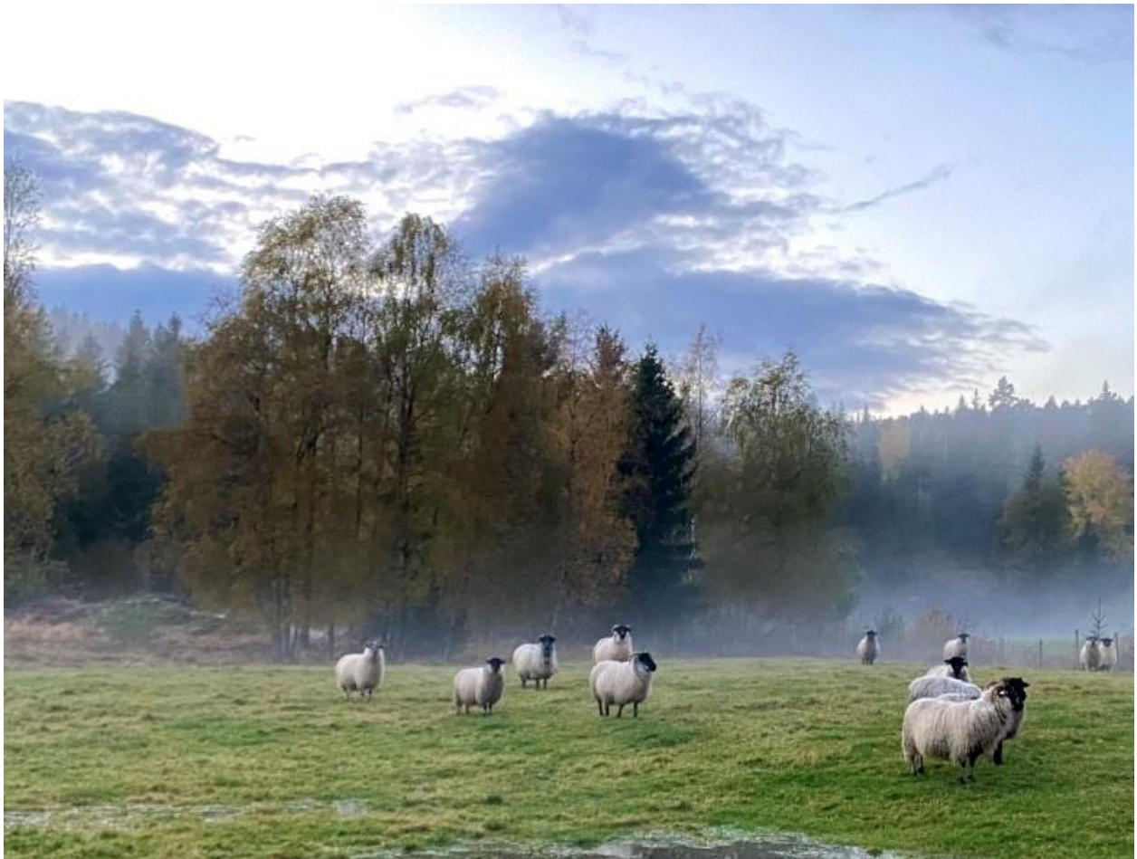
Sauer på beite, Grimstad.

Feil opplysninger i søknaden og brudd på vilkår kan føre til avkortning av tilskuddet.