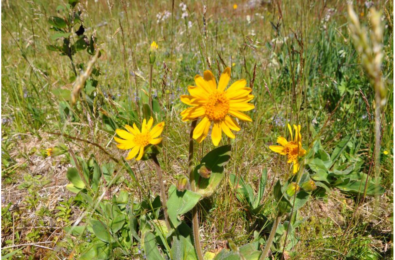
Solblom på slåttemark.

Skjøtselen skal i hovedsak utføres etter generelle skjøtselsråd.