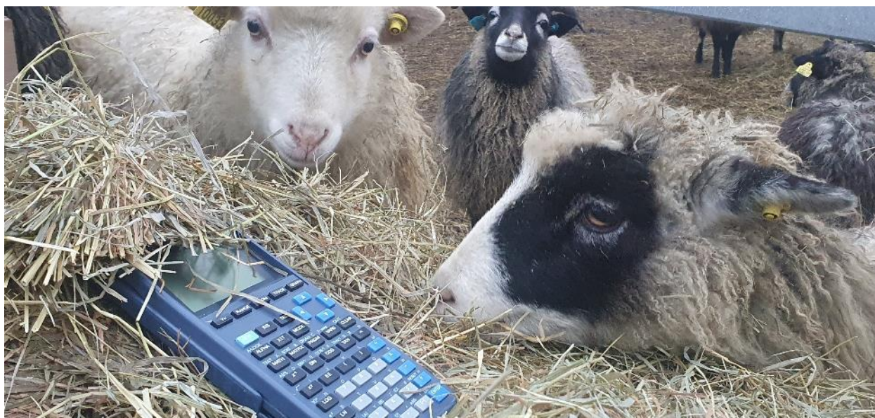
Klimakalkulatoren – et hjelpemiddel i klimarådgivingen.

Liste over klimarådgivere i Agder finner du på nettsiden til Klimasmart landbruk .