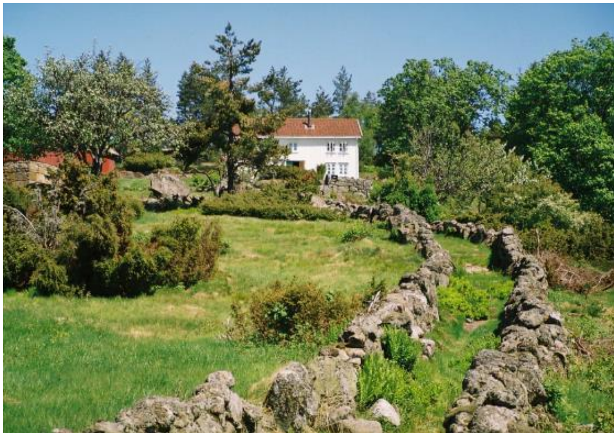
Buvei i Marnardal, Lindesnes.

Skjøtselen av kulturminnene skal i hovedsak utføres etter generelle skjøtselsråd.