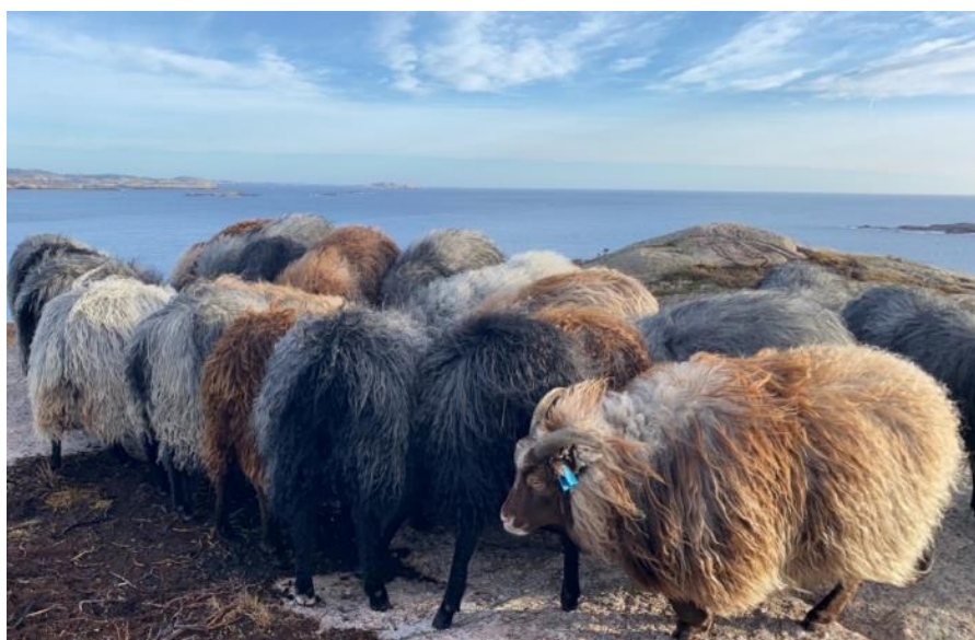
Gammel norsk spælsau på beite, Hilletunga i Lindesnes.

Det kan bare utbetales ett tilskudd til samme beitedyr for en beitesesong der samme område både er prioritert etter § 6 og § 7 for eksempel øya Hille utenfor Mandal. Søker må da velge å enten søke for jordbruksareal i § 6 eller søke for beitedyr på alt areal som beites i § 7.