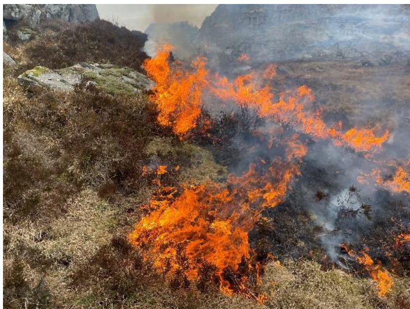
Brenning av kystlynghei, Jølleheia i Farsund.