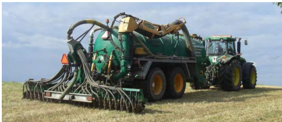
Nedfelling av husdyrgjødsel.

Tilskuddet kan kombineres med § 22 Spredning av all husdyrgjødsel om våren og eller i vekstsesongen på foretaksnivå, men arealet det søkes tilskudd for kan ikke overlappe.