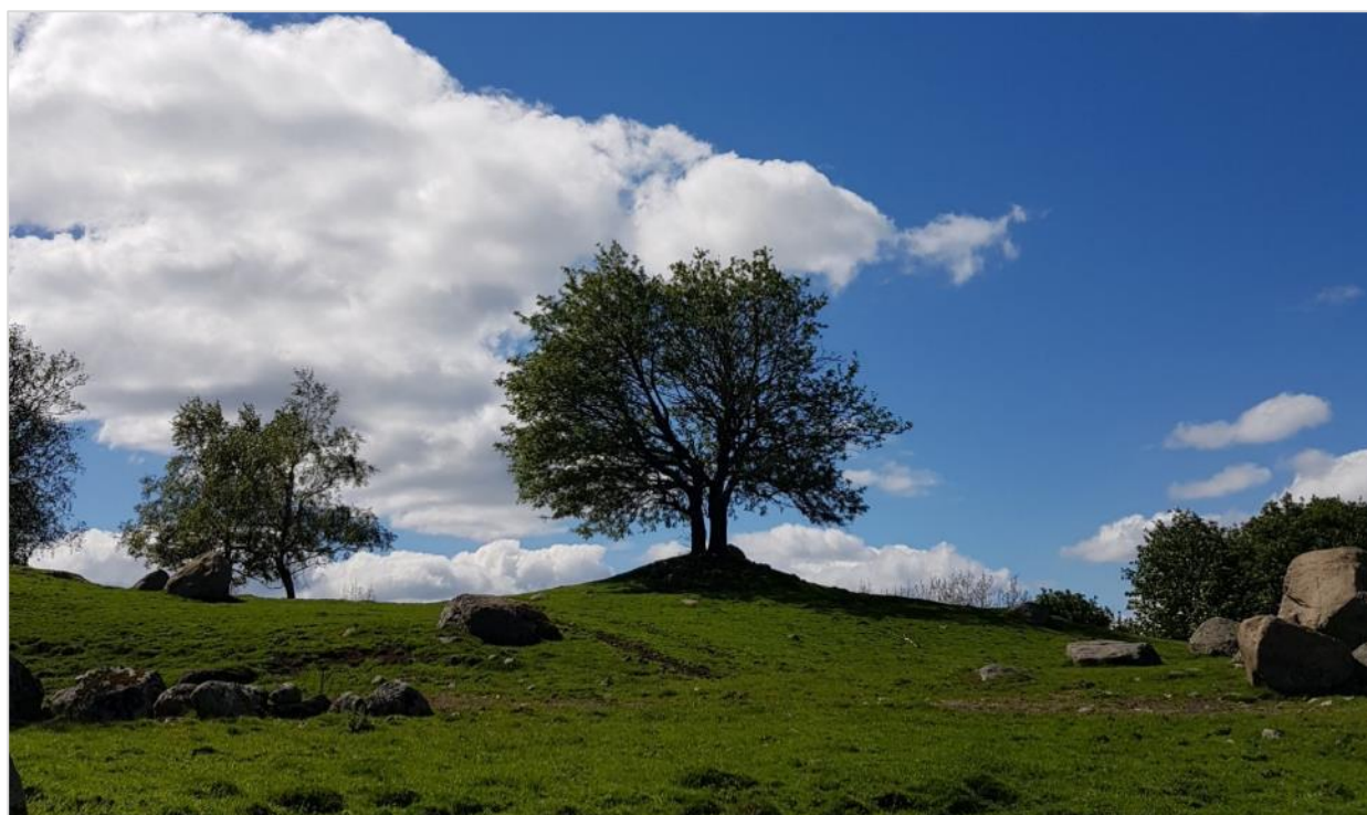
Gravhaug, Tjomsås i Vennesla.

På www.kulturminnesok.no kan man se hva som er registrert av kulturminner på ulike eiendommer.