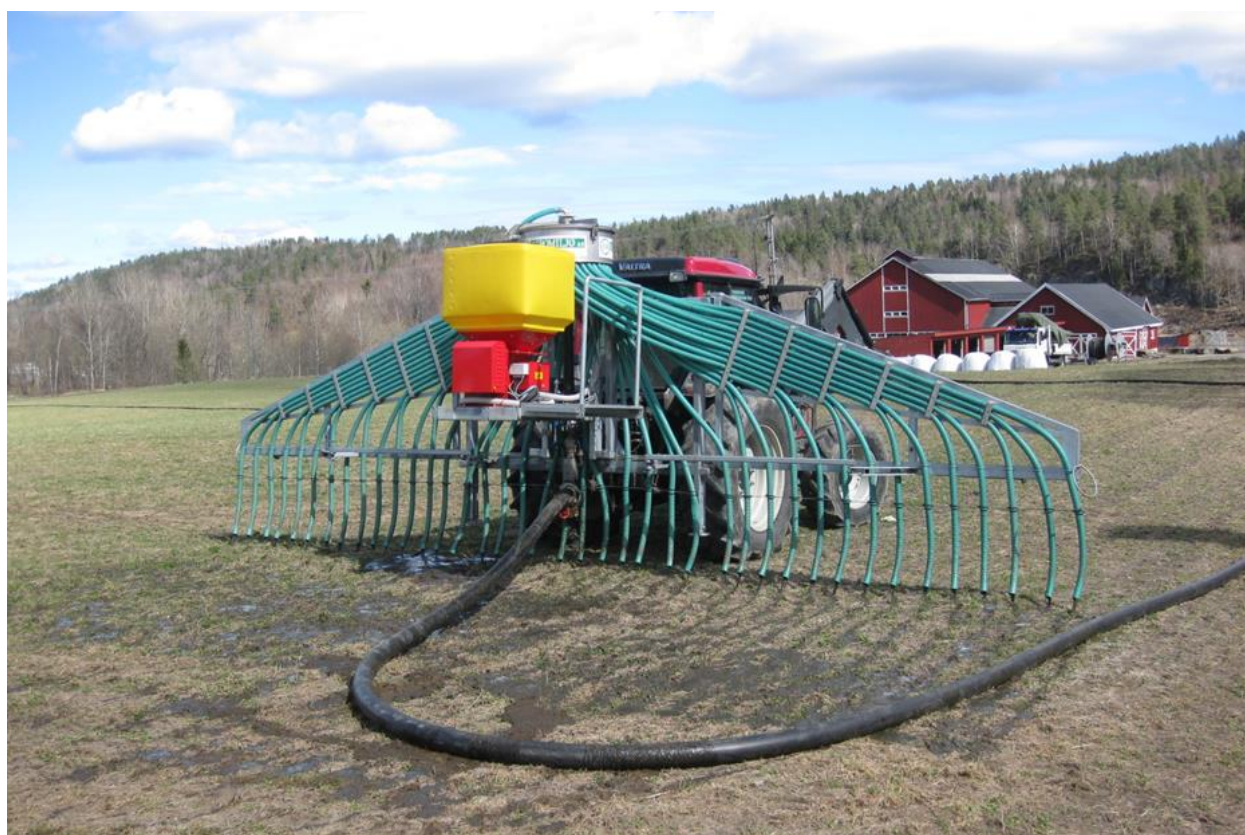
Bruk av tilførselsslange som tillegg til nedlegging av husdyrgjødsel med slangespreder, Mandal.