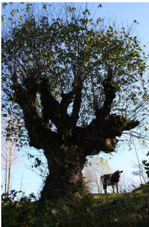
Hagemark med styvingstre.