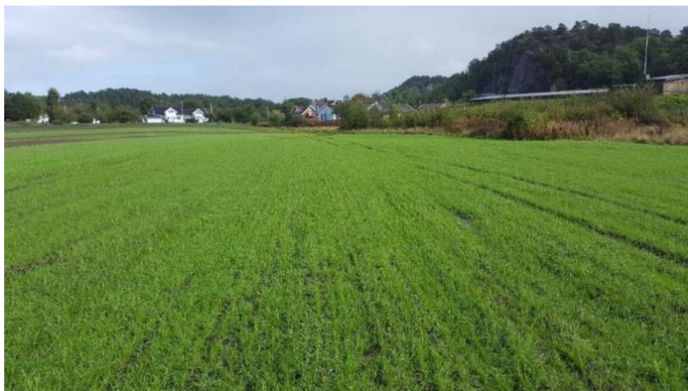
Fangvekster: Raigras og rug sådd etter høsting av tidligpotet, Søgne.