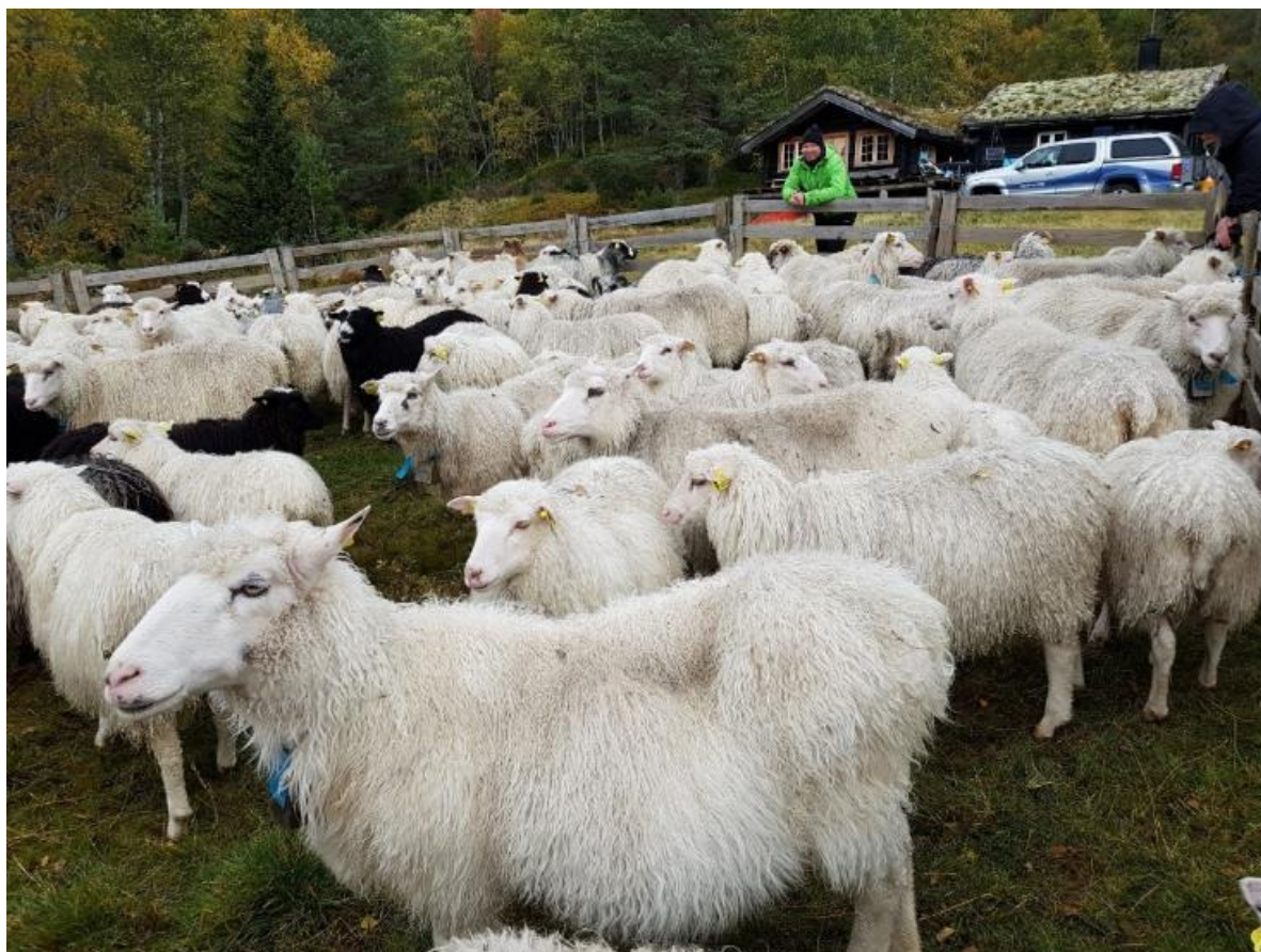
Samling av sauer på heia i Valle.

Tilskuddet utmåles per dyr som er sluppet på beite.