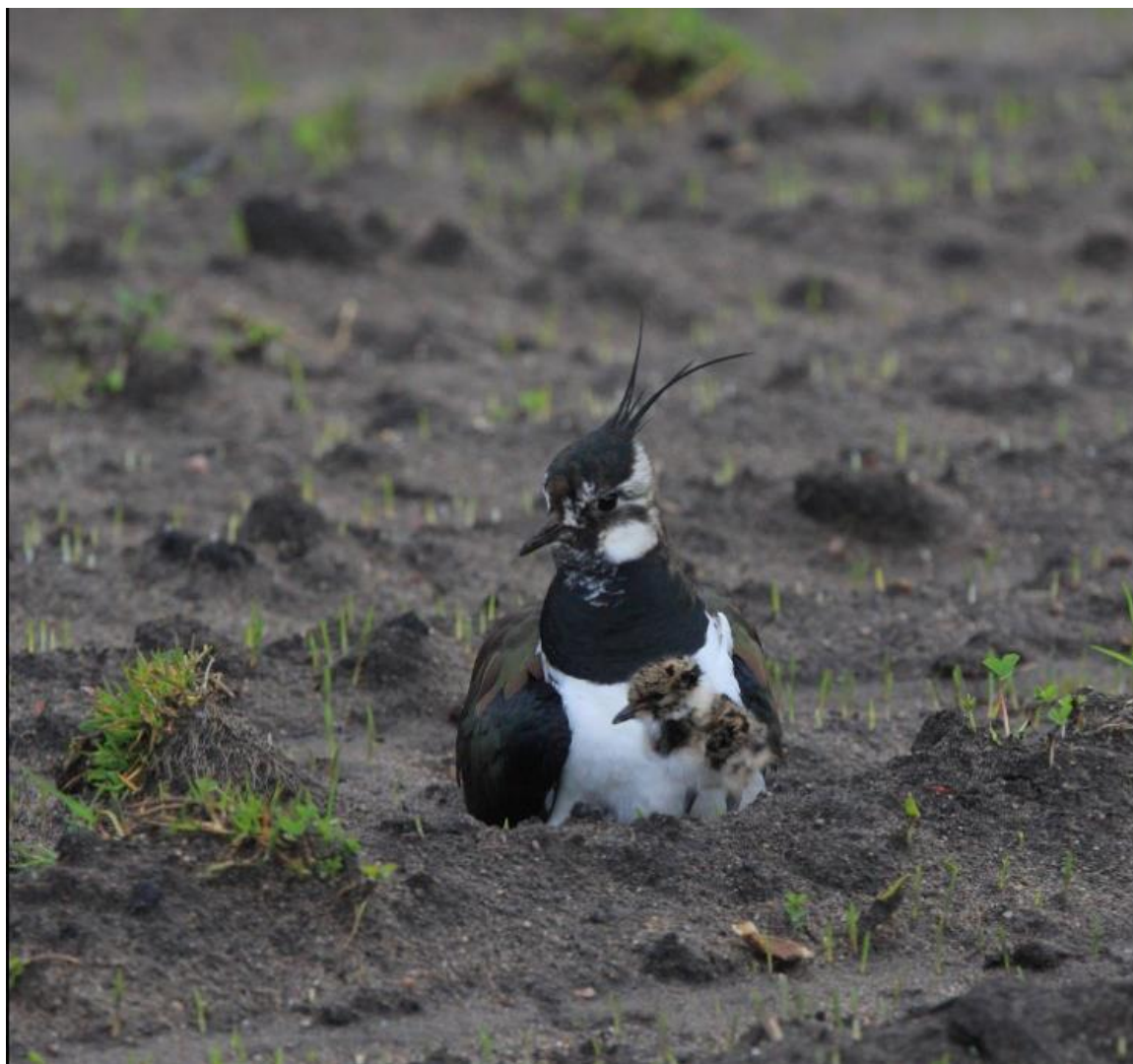
Vipe med nyklekket kylling på Årosjordet i Søgne, Kristiansand.