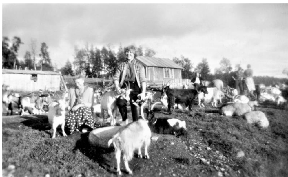
Seterdrift på Bjåen.

Det kan på samme seter ikke innvilges tilskudd til både § 15 Drift av seter og § 16 Besøksseter .