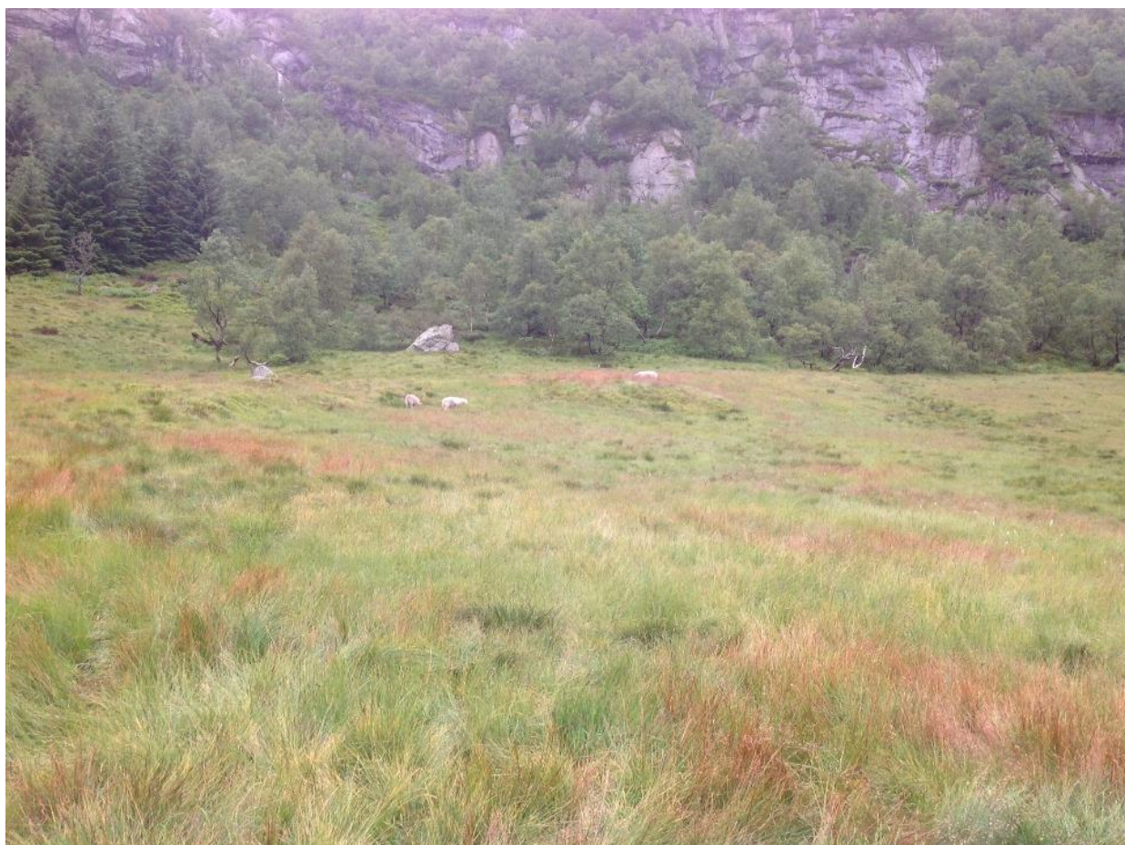
Slåttemark på Bryggesåhommen i Hægebostad.