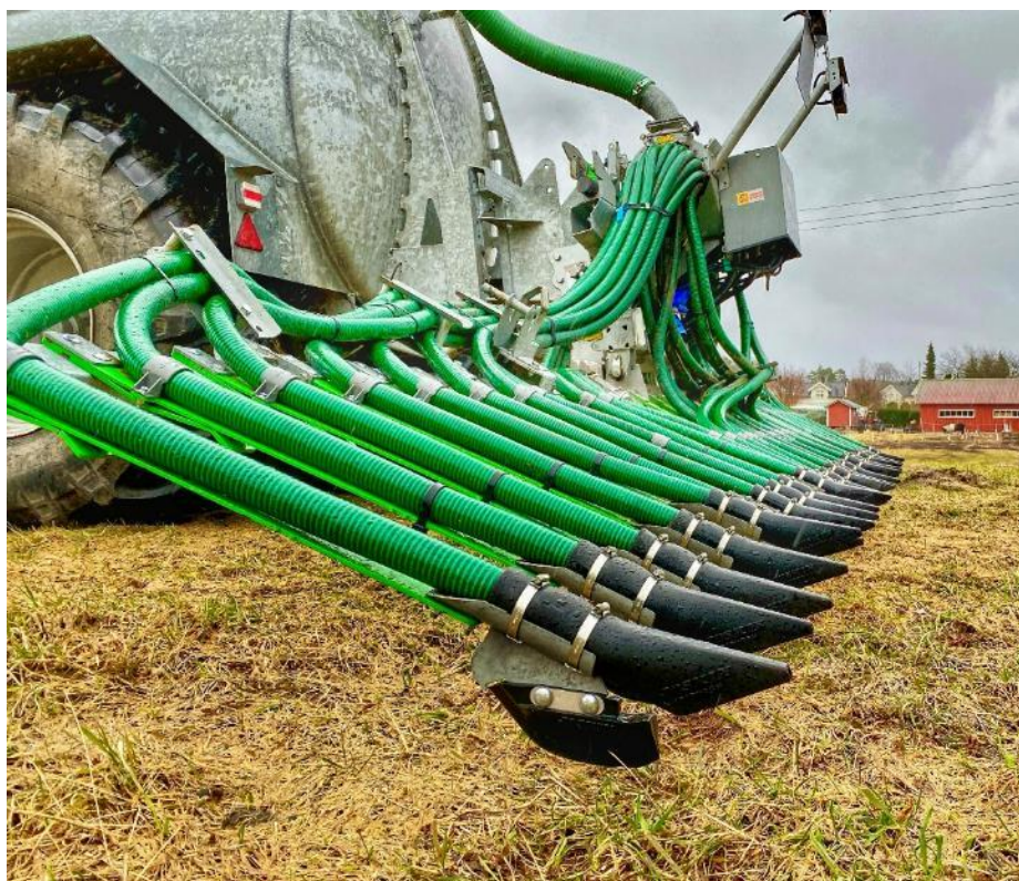
Gjødselvogn med spredebom for nedlegging av husdyrgjødsel, Arendal kommune.