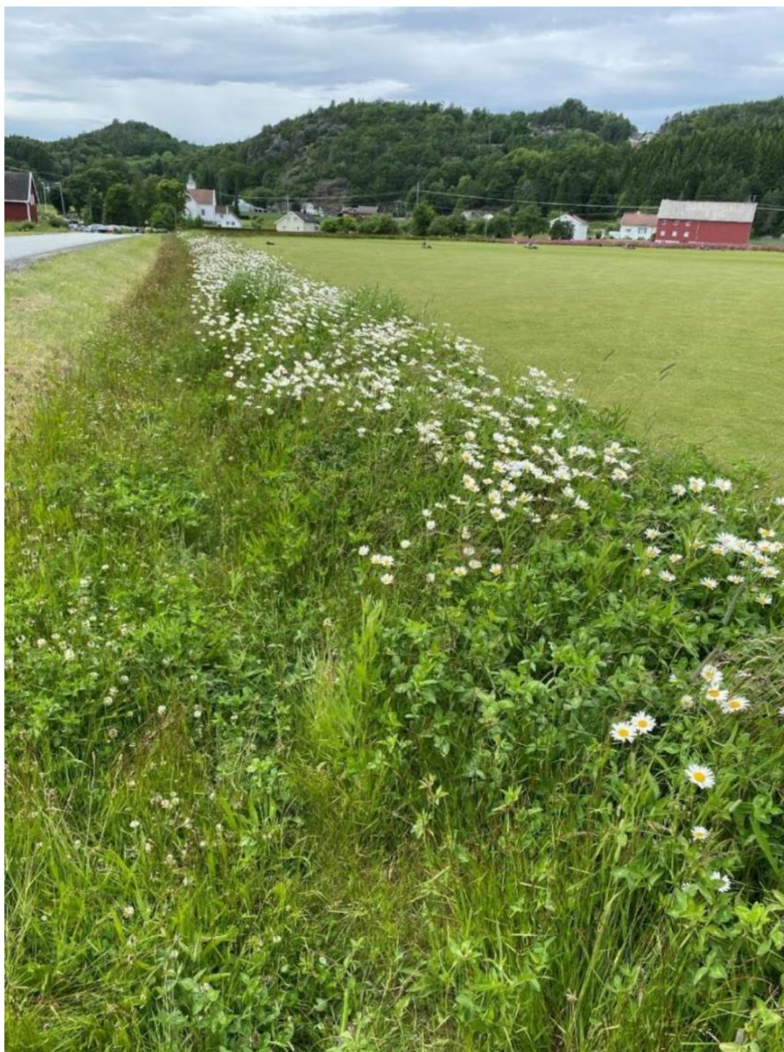
Blomsterstripe på jordbruksareal (Egen stripe, regional frøblanding), Landvik i Grimstad.