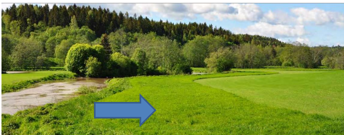
Kantsone i eng (markert med pil).