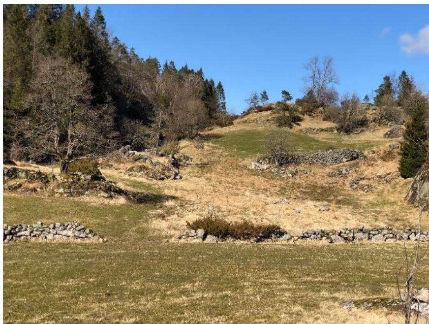
Bakkemurer på Håland, Lindesnes.