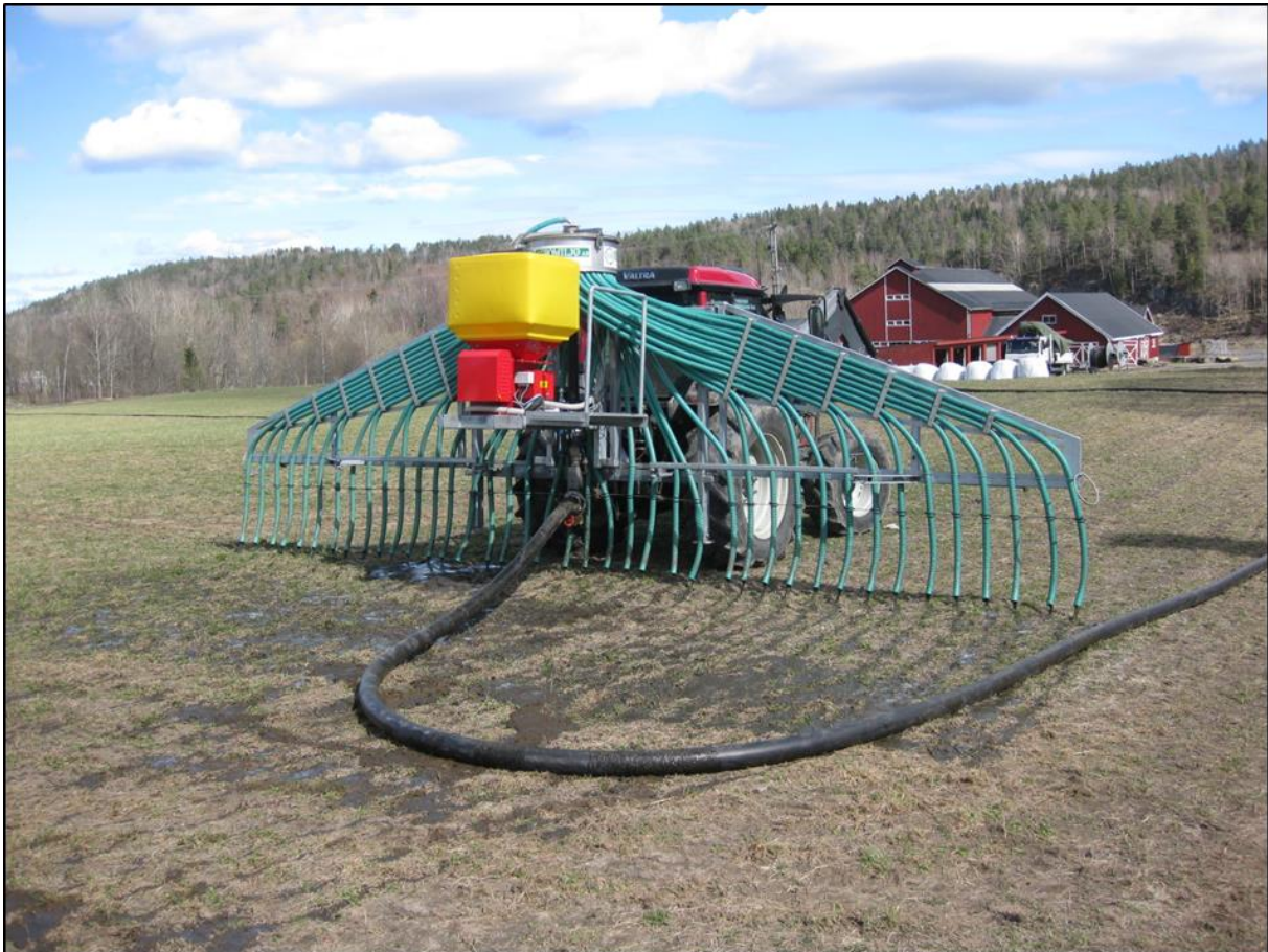
Slangespreder med tilførselsslange