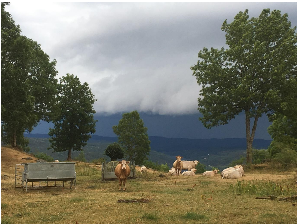
Melås i Gjerstad