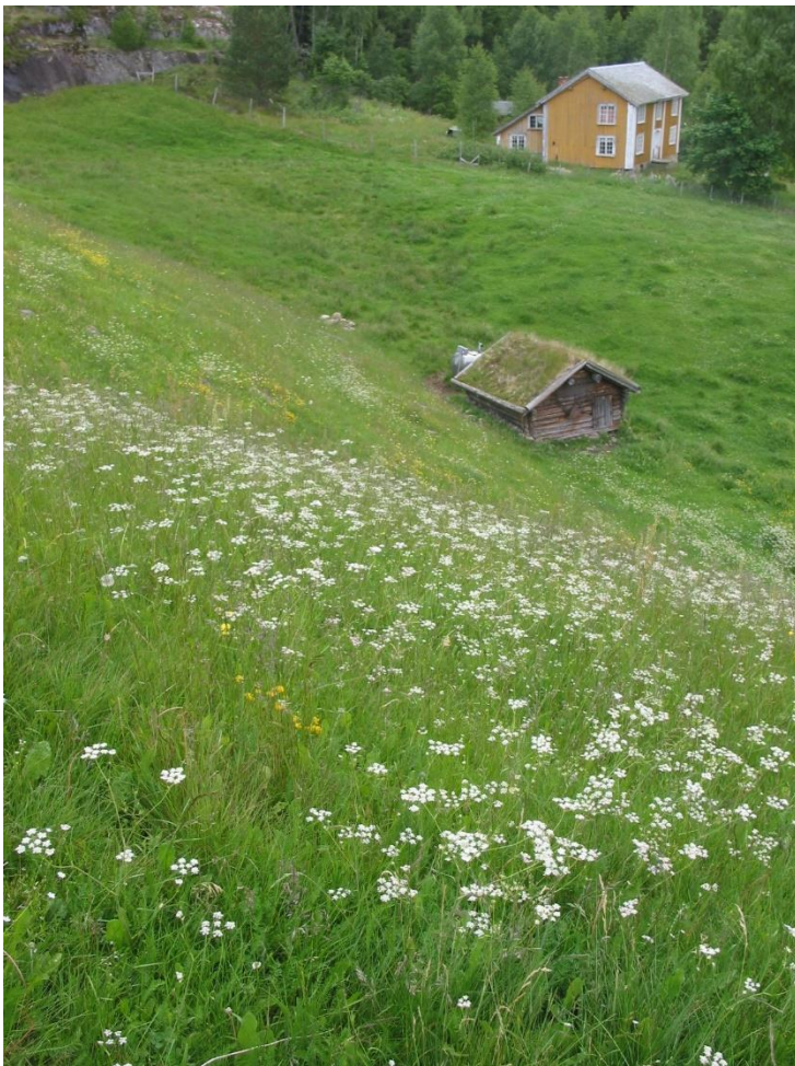
Blomstereng – slåttemark