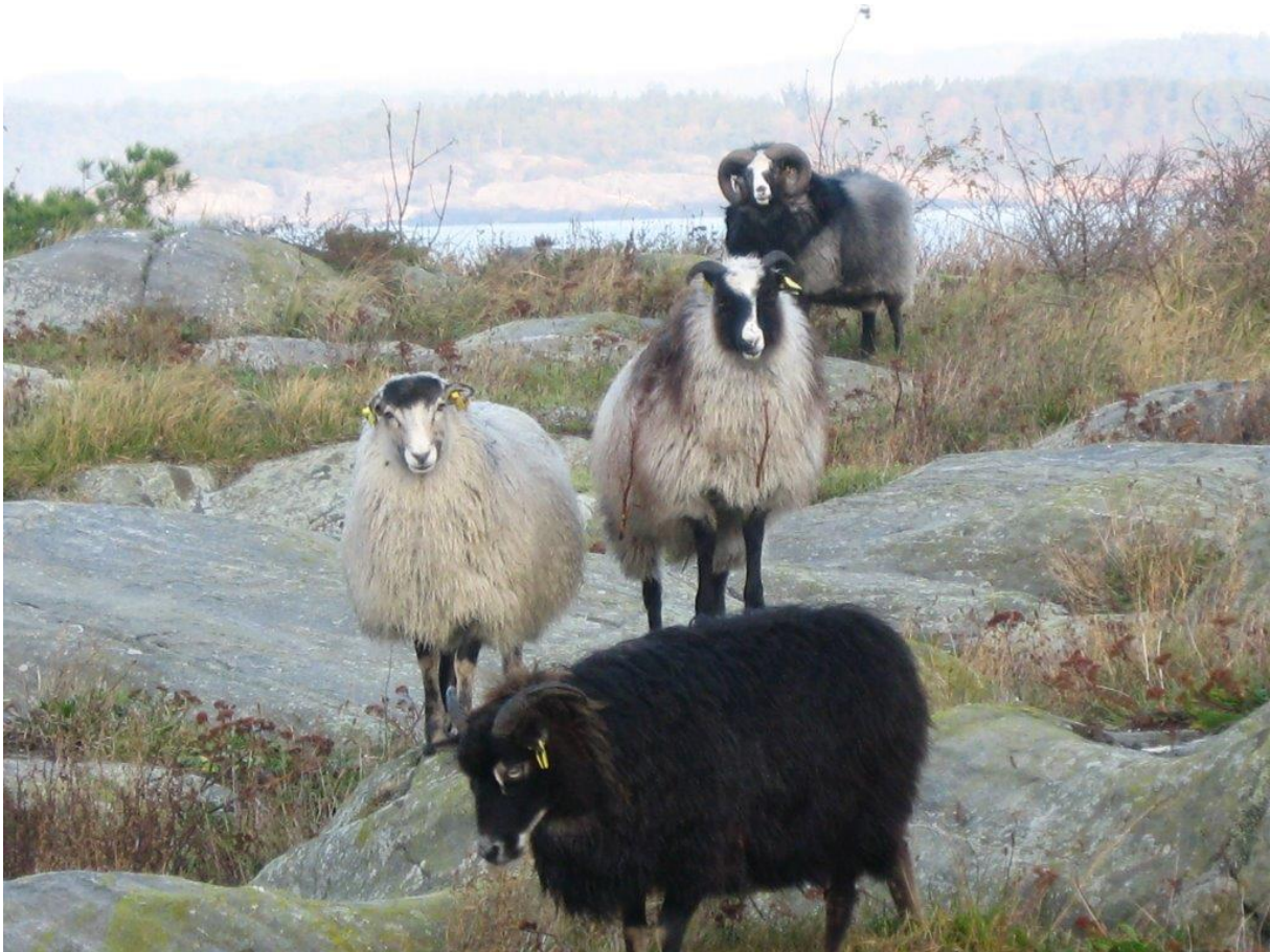
Store Torungen, foto: Lisbeth Kismul/Fylkesmannen i Agder