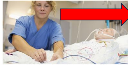
Studiet Avansert klinisk sykepleie er for deg som ønsker en videreutdanning for å kunne jobbe med pasienter med sammensatte, akutte og langvarige sykdomstilstander.