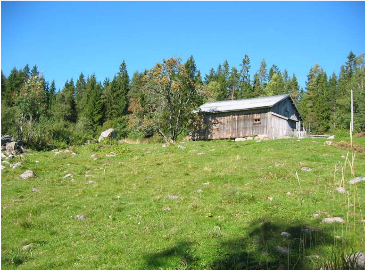
Hyttjanstorpet, - triviell beitemark - Foto Jan Wesenberg

Ca. 8% av kommunens areal er dyrket mark. Disse områdene utgjør ca. 60 km 2 og er særlig konsentrert på begge sider langs Glomma. Det finnes mange gamle sætrer og mindre boplasser fra tidligere tider. Områdene er i varierende grad undersøkt. Uten omfattende feltarbeid er det ofte vanskelig å vurdere om lokalitetene tilfredsstiller kravene i håndboka. Med bakgrunn i tidligere kartlegginger og feltbefaringer i 2004 er 16 lokaliteter registrert. Av disse er én gitt verdi A, fem er gitt verdi B, og 10 er gitt verdi C. Alle lokalitetene er lagt inn i kommunens database.