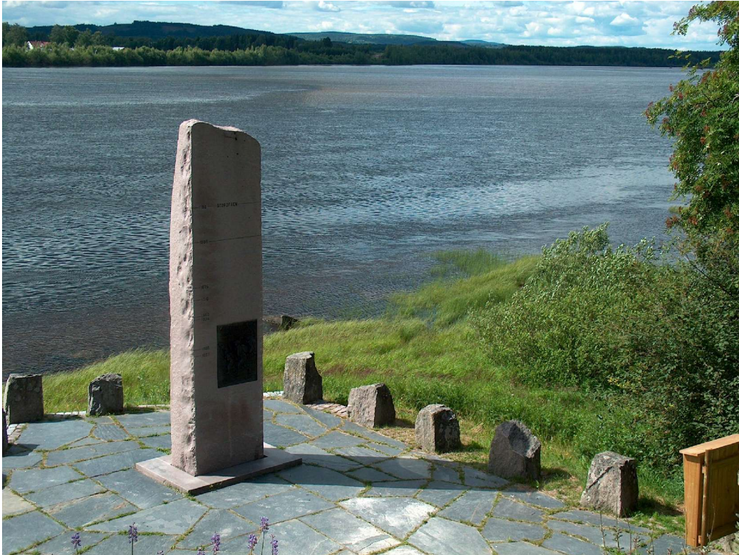
Flomsteinen ved Grøseth er en klar påminnelse om at både planter, dyr og mennesker kan få store utfordringer som følge av årstidsvariasjoner i leveområdene.