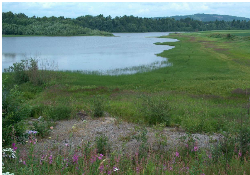
Silvatnet ligger nå på innsiden av flomverks-fordemningen og påvirkes i mindre grad enn før av flom.