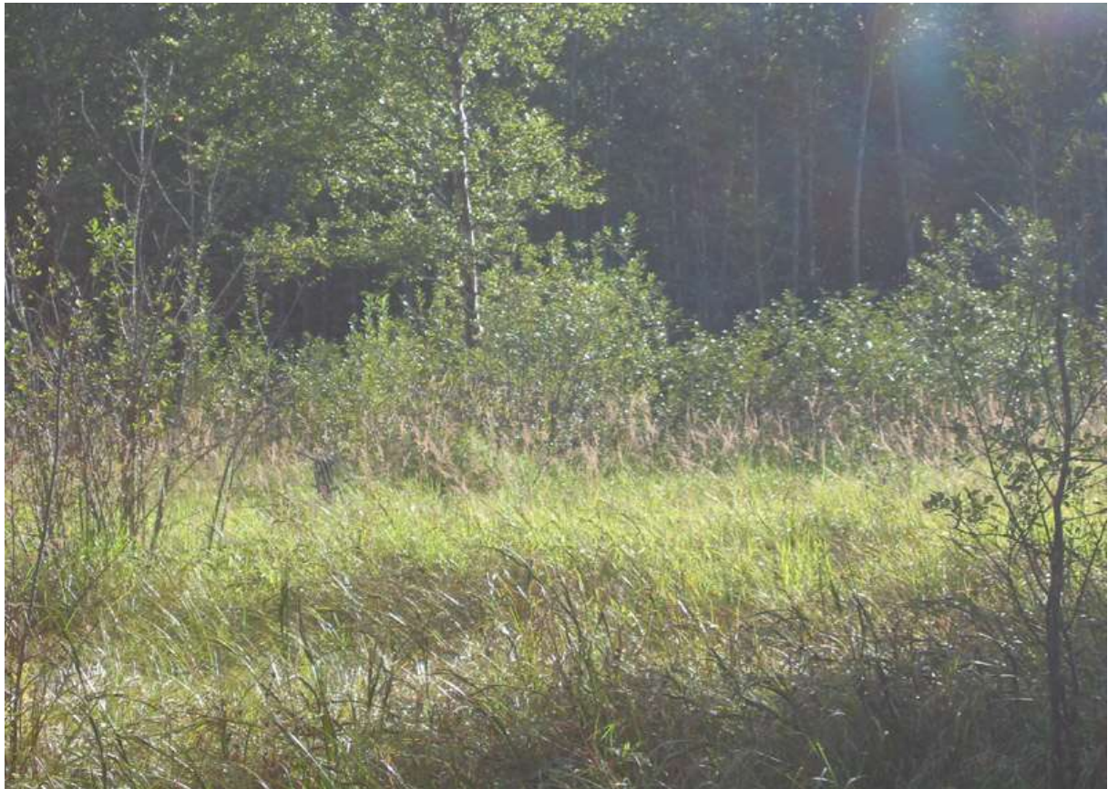
Sorka, flommark med bjørk, vierkratt (mest svartvier), rørkveineng (skogrørkvein) og i forgrunnen nordlandsstarr/sennegras-sump.

Ved en undersøkelse av potensielle amfibielokaliteter (Strand 1992) ble det påvist liten salamander i to dammer og spissnutet frosk i to dammer. Stor salamander ble også påvist i to dammer. En av lokalitetene inneholder både stor og liten salamander. Forekomst av disse artene gir automatisk verdi A for lokaliteten. Lokalitetene med salamander og spissnutet frosk kommer av den grunn med både på naturtypekartet og temakartet for rødlistede viltarter.