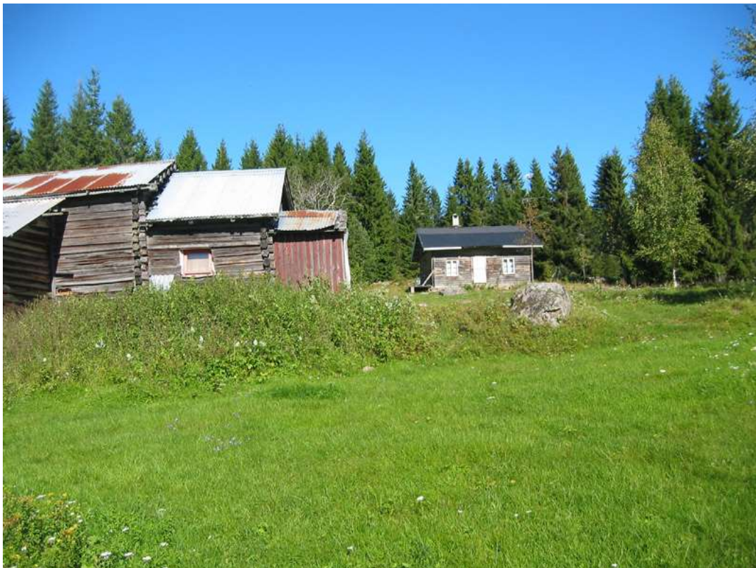
Vestre Solli: Natureng, beitebakke som bør slås eller beites om den ikke over tid skal gro igjen.