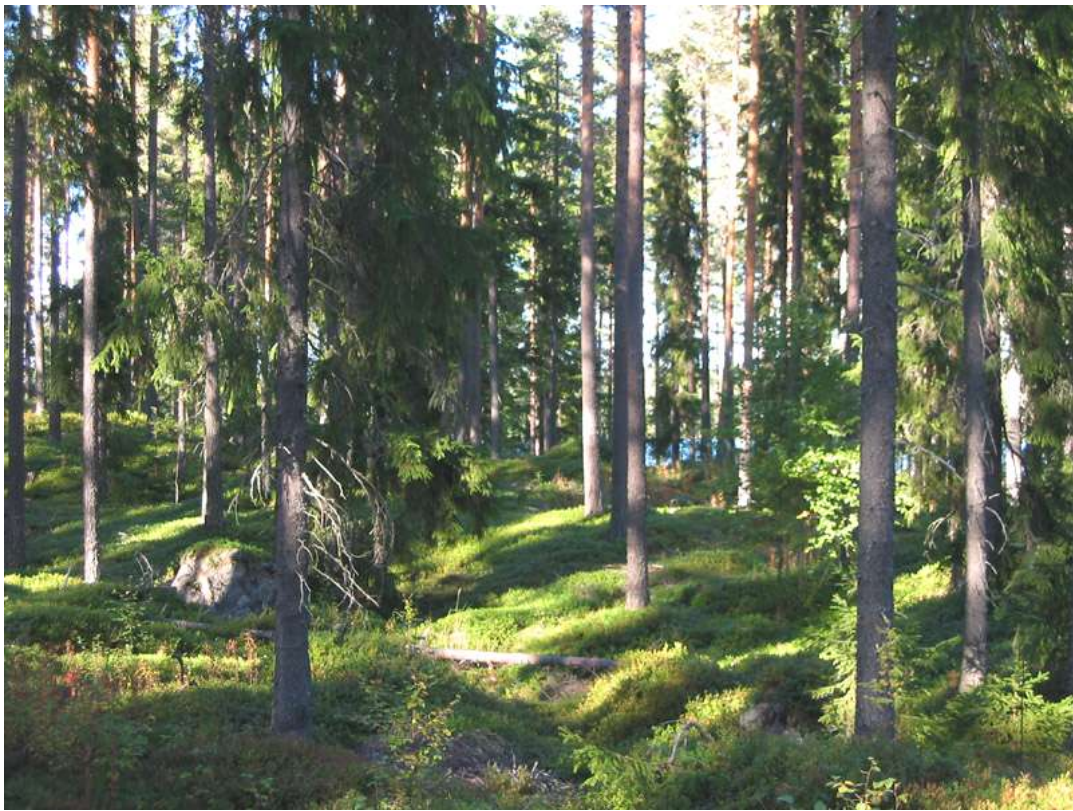
Rotbergsjøen sør, bærlyngskog med gran og furu