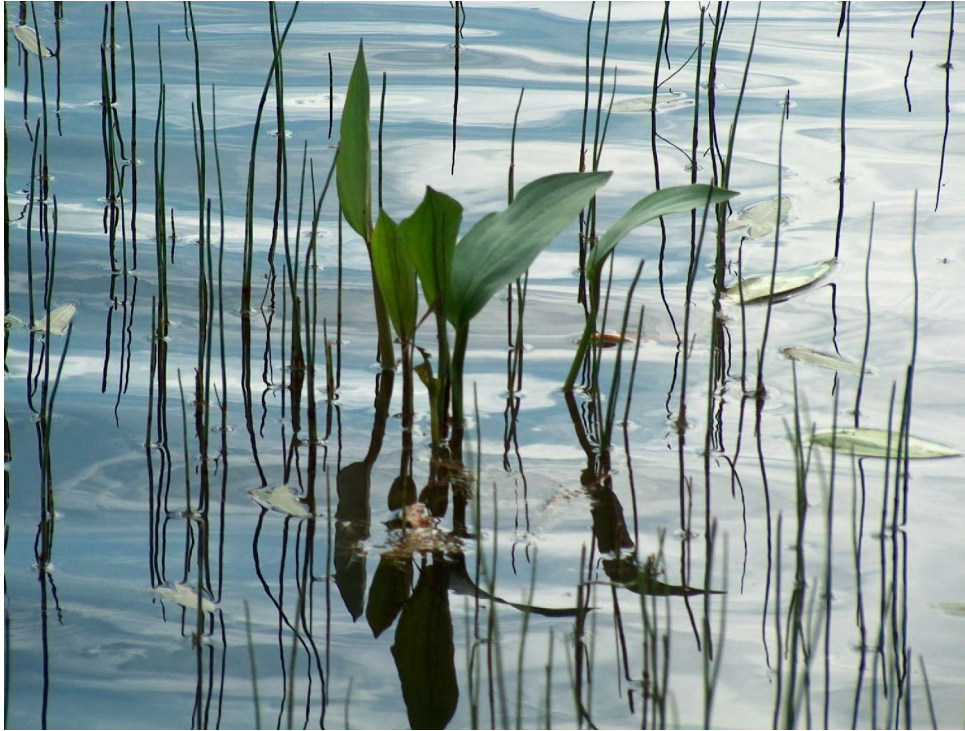
Vassgro er en relativt uvanlig plante i Grue, men arten står ikke på den norske rødlista. Bildet ble tatt i Evja 2004.