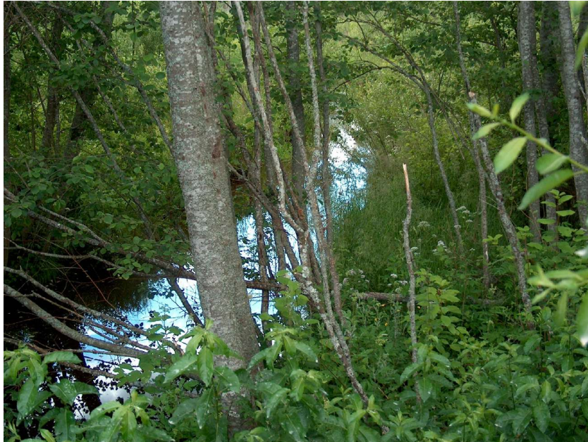
Sumpvegetasjon / våtmarker, som her i Sorka, er viktige lokaliteter for virvelløse dyr.