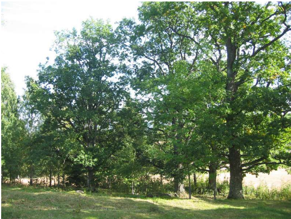
Naturbeitemark med store eiker. Bildet er tatt sommeren 2004 på Opaker gård.