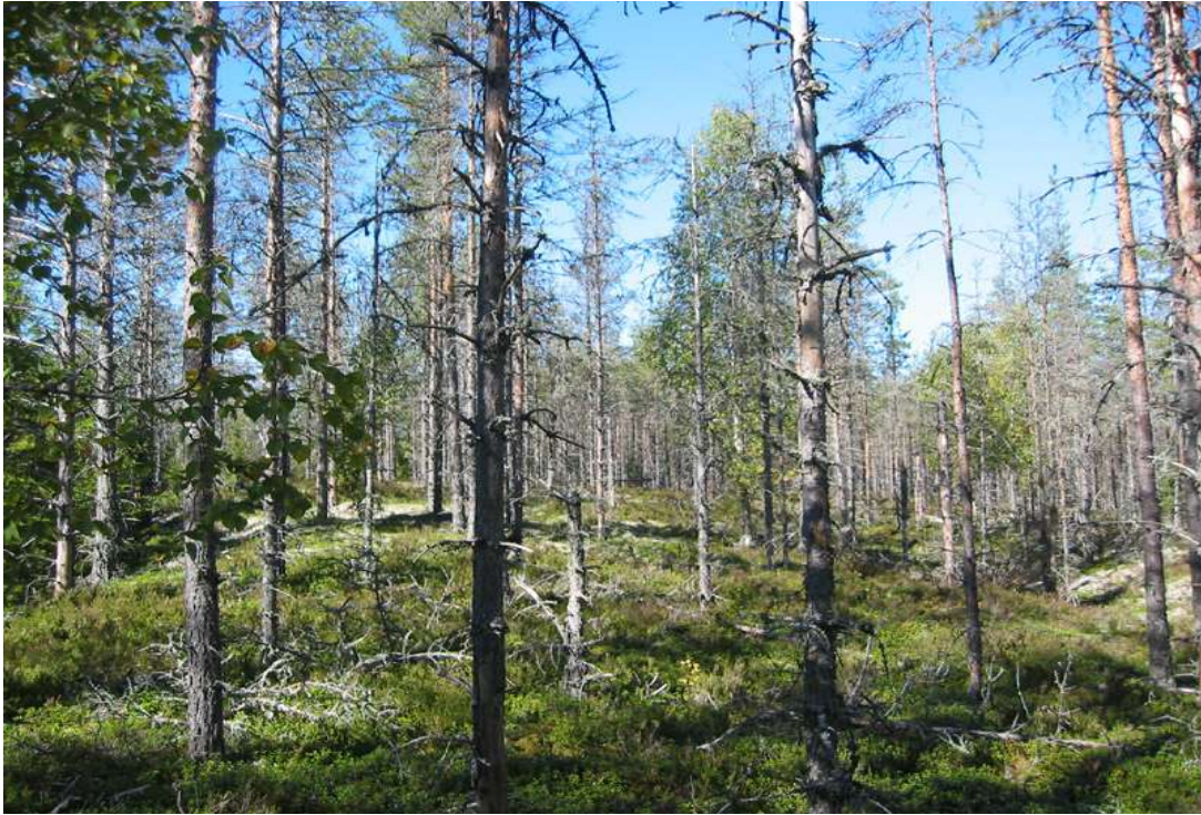
Rotnedalen, brannfelt