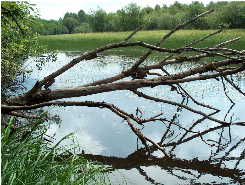
Kroksjøer og meandrerende elvepartier langs Glomma er eksempler på viktige naturtyper i Grue kommune.