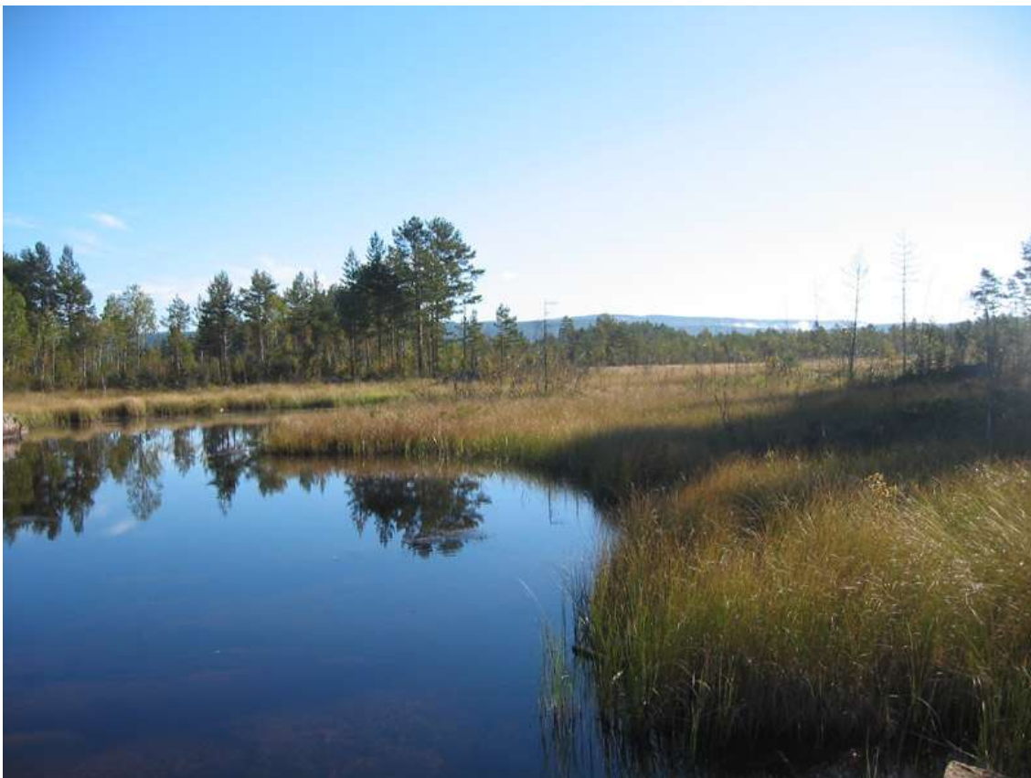
Tysjømyra, Tjuraåa rett oppstrøms fløtningsdemningen.

Økonomisk kartverk er brukt for å sjekke om det finnes grøfter på myrene i Grue. Myrene er ikke kontrollert i felt, og det er derfor vanskelig å vurdere hvorvidt eldre grøfting på eller i kanten av myra påvirker vannbalansen i en større del av myrflata. Myrer over 50 daa i sørboreal sone (under 400 moh) skal etter metodikken ha verdi B. Forekomst av rødlistearter kan bidra til at lokaliteten får verdi A. Det er registrert 2 A- og 9 B-lokaliteter i Grue. En liten myr er registrert som C-lokalitet. Øvrige myrer er utgrøftet eller påvirket av andre tekniske inngrep.