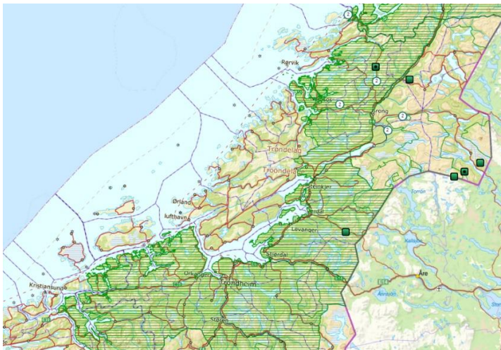
Figur 3. Skjermdump fra Rovbase 3.0 som viser dokumenterte skader forvoldt av gaupe på tamrein i perioden 27.10.2021 til 03.03.2022 (n = 16). Skravert område angir forvaltningsområde for gaupe.