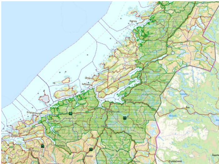
Figur 2. Skjermdump fra Rovbase 3.0 som viser dokumenterte skader forvoldt av gaupe på sau i perioden 27.10.2021 til 03.03.2022 (n= 7). Skravert område angir forvaltningsområde for gaupe.