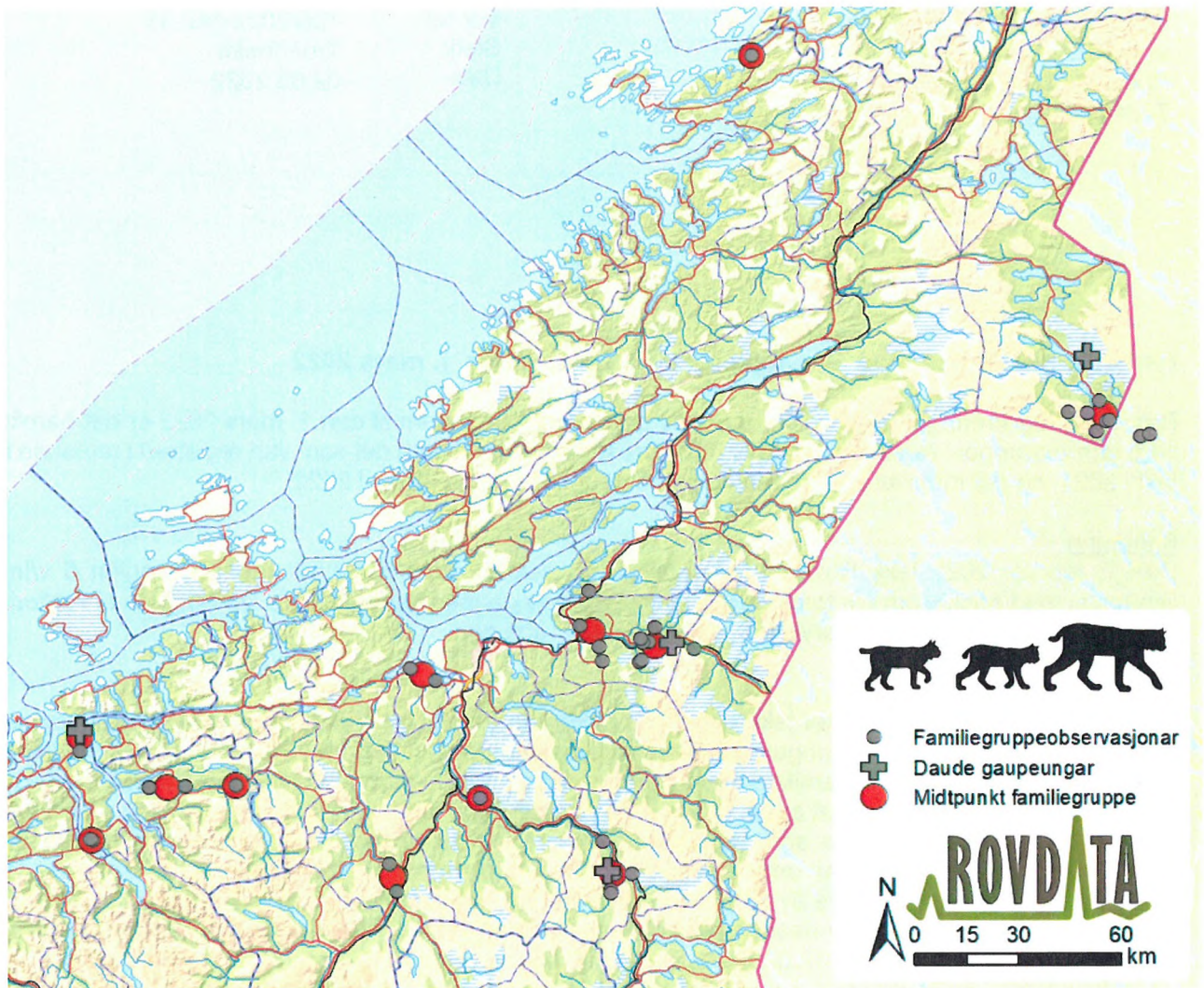
Figur 1: Registrering av gaupe familiegruppe i region 6 i perioden fram til 1. mars 2022. Dei raude sirklane syner midtpunktet i dei ulike familiegruppene, medan dei grå sirklane og korsa syner observasjonar og daude gaupeungar nytta i berekninga av tal på familiegrupper.

familiegrupper enn det som vart registrert i 2021, og det motsvarar ein bestand på 65 dyr (95 % KI: 56–75 dyr) før jakta starta i 2022. I Rovbase er det per 1. mars registrert 27 daude gauper i region 6, 26 av desse er jaktuttak medan den siste er ukjent dødsårsak. Av desse 27 gaupene er 11 vaksne hogauper (figur 2). Avgangen utgjer så langt 41 % av den berekna bestandsstorleiken før jaktstart i 2022.