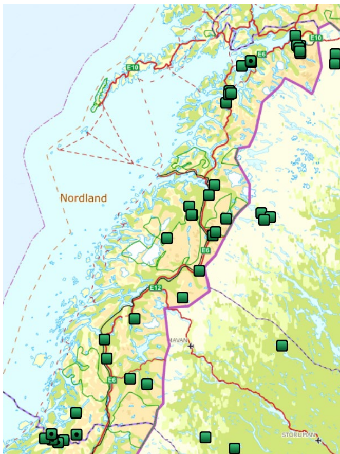
Figur 6: Påviste tap av rein til gaupe i Nordland og tilgrensende områder i Trøndelag, Troms og Finnmark og Sverige siden 1. januar 2020 (per 15. september). Samme kart kan også sees på Rovbase.no .