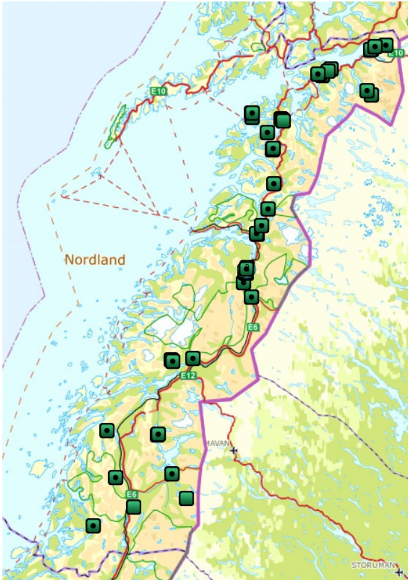
Figur 5: Påviste tap av sau og lam til gaupe i Nordland og tilgrensende områder i Troms og Finnmark og Trøndelag i 2020, per 15. september. Samme kart kan også sees på Rovbase.no .