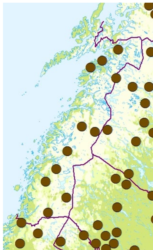
Figur 2: Venstre kart: Påviste spor eller synsobservasjoner av gaupe registrert i Rovbase i perioden 01.10.2019 - 10.09.2020 (både familiegrupper og enkeltdyr). Høyre kart: Registrerte familiegrupper vinteren 2019/2020 i Nordland og naboombråder.