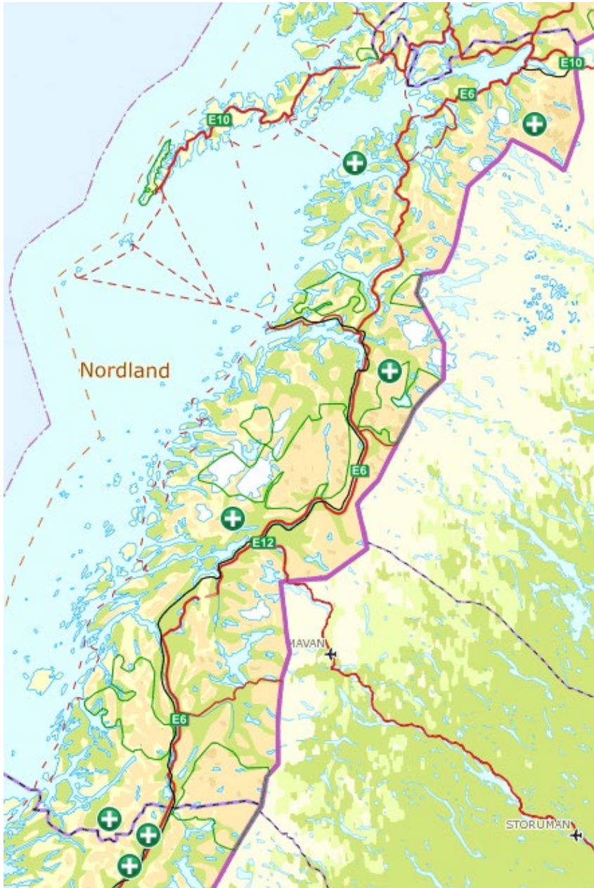
Figur 3: Kjent avgang av gauper siden 1. september 2019 i Nordland og tilgrensende områder i Troms og Finnmark og Trøndelag. I Nordland ble det påkjørt en gaupeunge på Hamarøy i oktober 2019. Videre ble det felt to voksne hunngauper på skadefelling i mars og mai 2020 i hhv. Bindal og Saltdal. I mai 2020 ble det påkjørt en voksen hanngaupe i Rana og i september 2020 ble en forlatt gaupeunge avlivet av SNO i Skjomen. På kartet er det også vist avgang av 2 gauper nord i Trøndelag; én gaupeunge med ukjent dødsårsak i september 2019 og en voksen hanngaupe felt på kvotejakt i februar 2020.

Det foreligger betydelig kunnskap om den samlede belastningen gaupebestanden blir utsatt for, jf. naturmangfoldloven § 10. Gaupebestanden er ikke avgrenset av tilgjengelig areal og det er ikke registrert sykdom på gaupe utover skabb i Norge. Utover enkelte påkjørsler og skadefelling er avgangen av gaupe i hovedsak gjennom kvotejakt, slik at miljøforvaltninga i stor grad har oversikt over den samlede belastningen. Se figur 3 og 4 for oversikt over kjent avgang av gaupe det siste året og tidligere år.