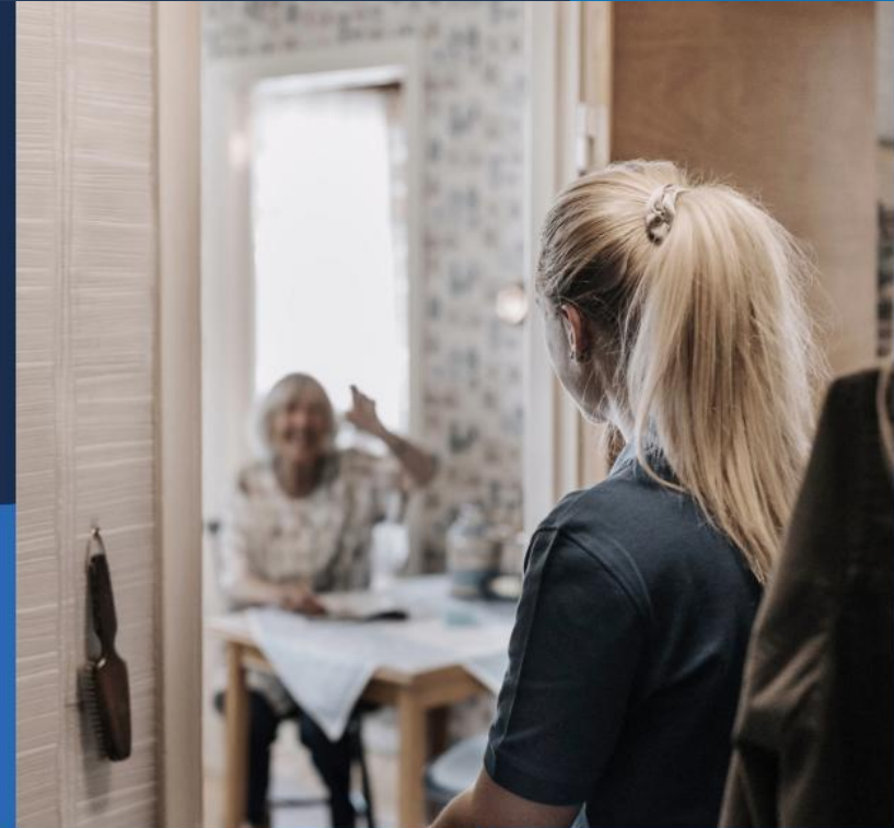
Funksjonsfall hos eldre som får heimetenester