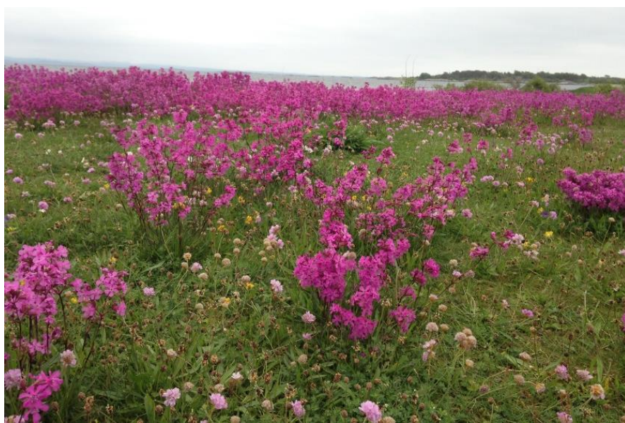
Tjæreblomst på gamle beitemarker Stråholmen