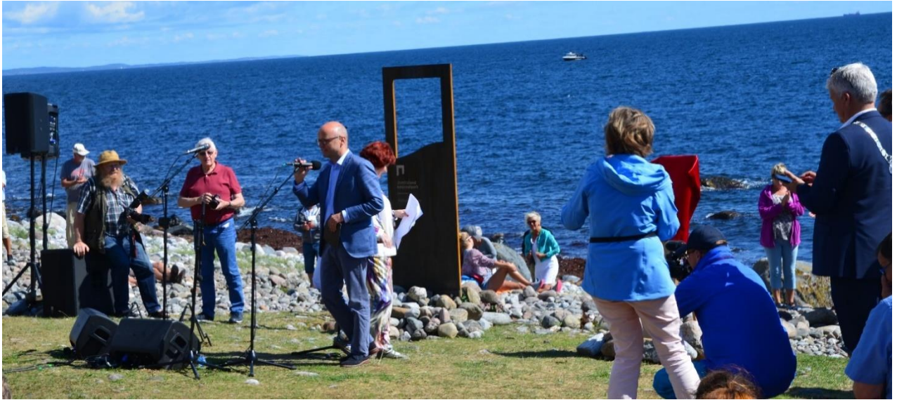
Åpningen av nasjonalparken 13. august