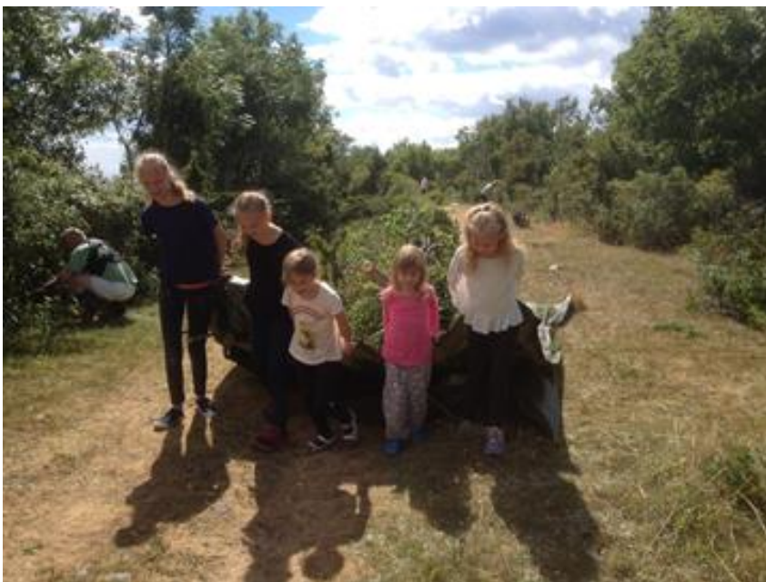
Ryddedugnad Jomfruland. Sammen er vi sterke