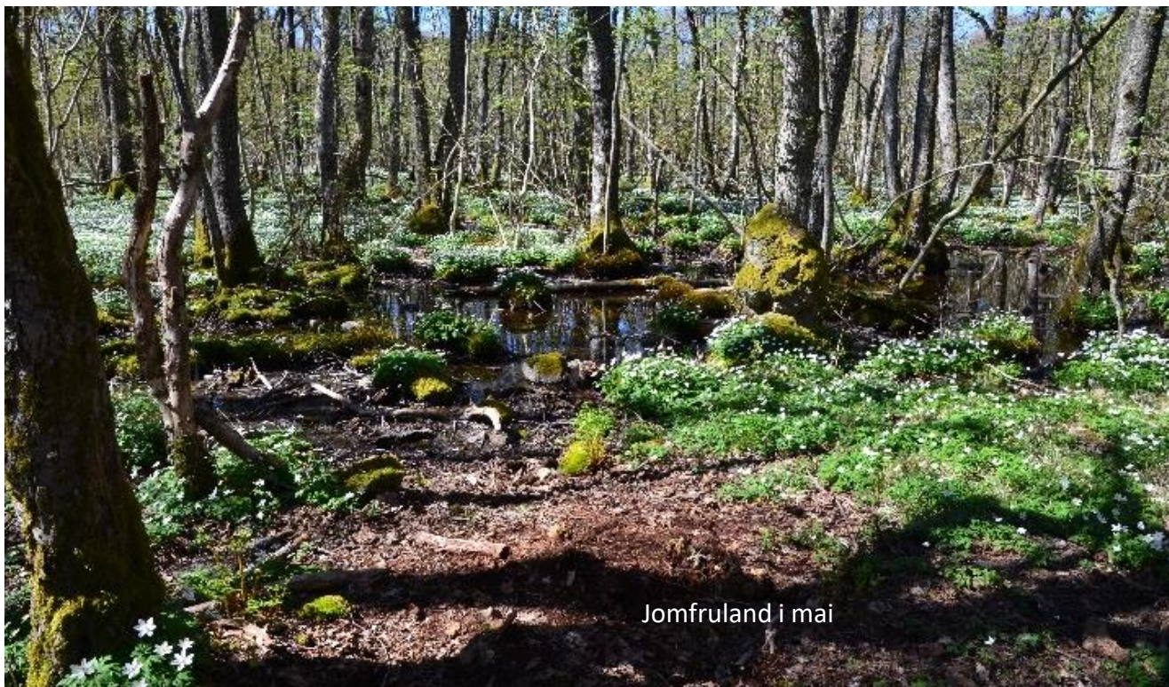
Jomfruland i mai