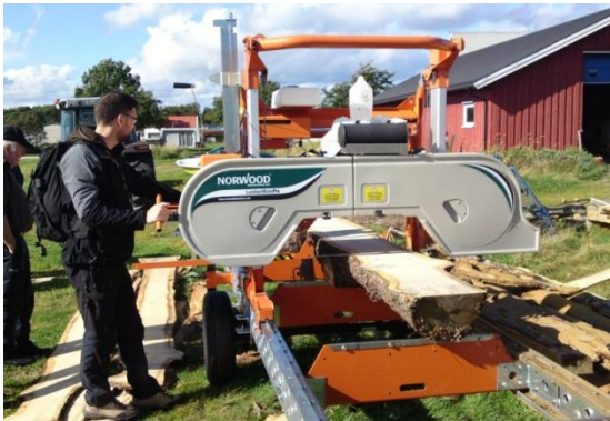
Innkjøp av sag gir muligheter for å utnytte Jomfrulands skogressurser