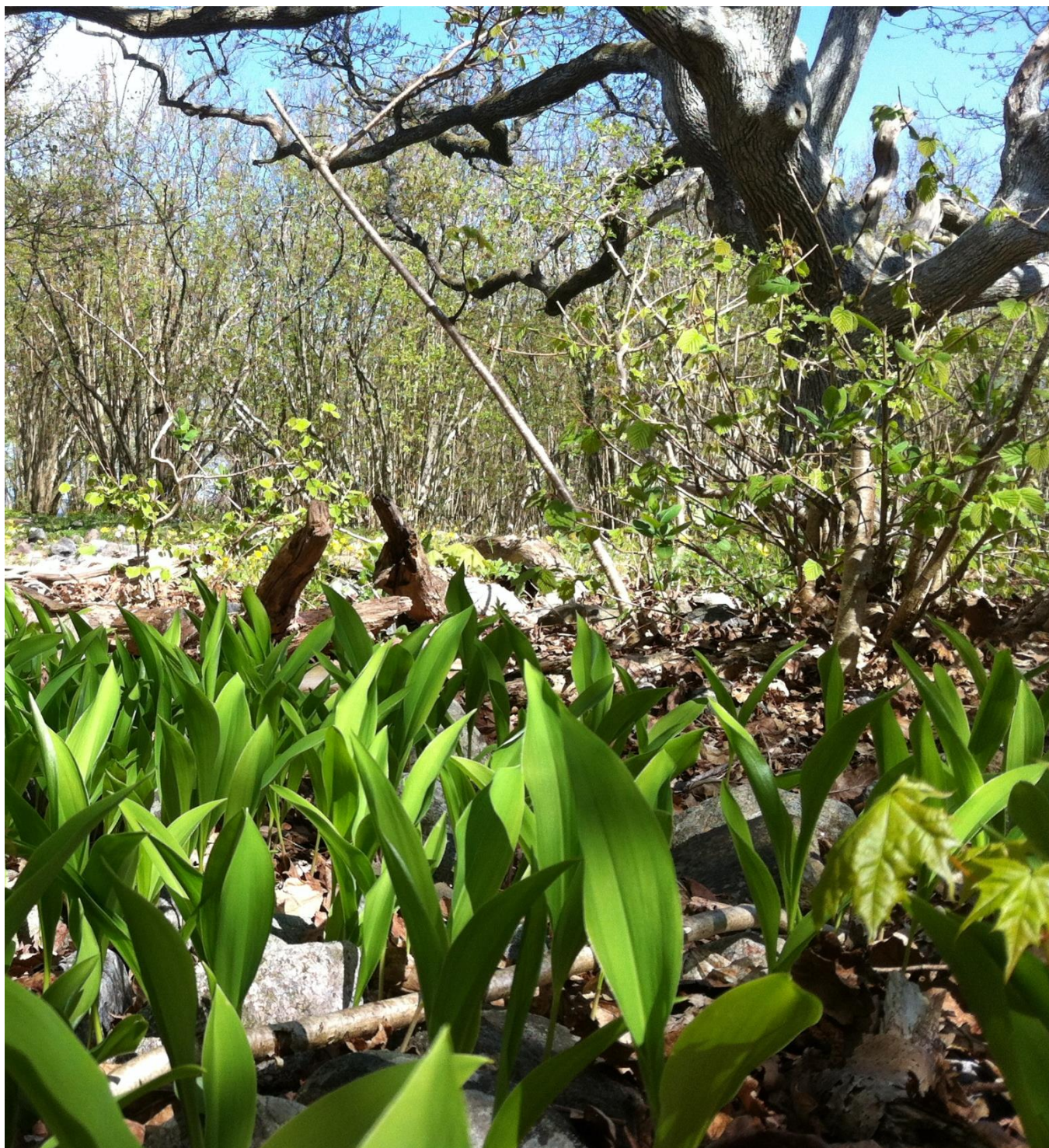
Øitangen, Jomfruland: liljekonvall i hasselskogen.