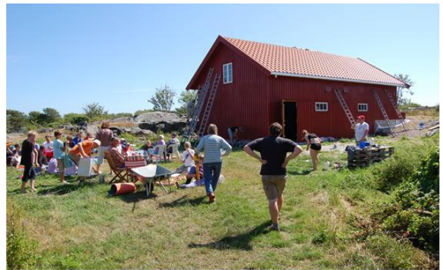
Den nye driftsbygningen på Stråholmen er blitt samlingssted for dugnader, møter og sosialt samvær.

«Midtveien» og resten av stien står for tur. På Stråholmen hvor alle de gamle gårdsbrukene er gått sammen om felles drift, er det reist en driftsbygning som inneholder utstyr for skjøtselen, høylåve og som om sommeren fungerer som forsamlingslokale.