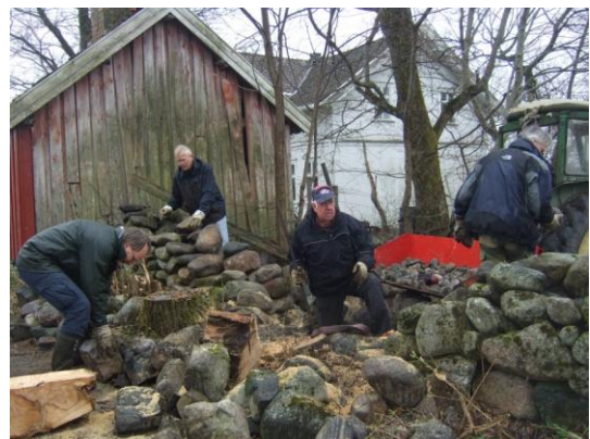
Det har på Jomfruland blitt arrangert flere kurs i restaurering av steingjerder.