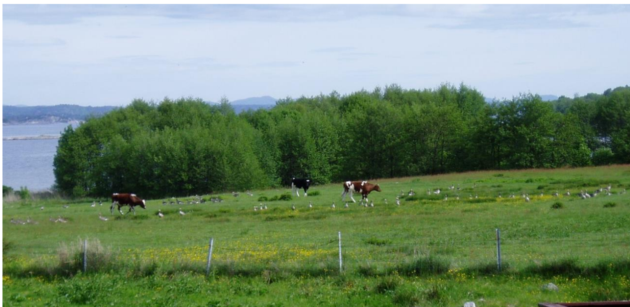
Grågås og kyr beiter side om side. Hagane Jomfruland