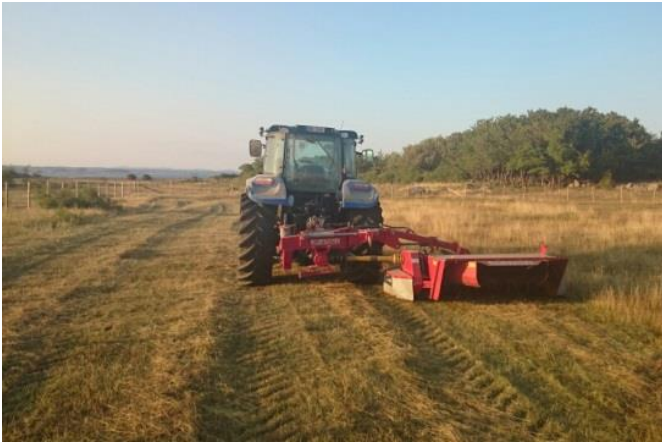
Slått på Øitangenjordet