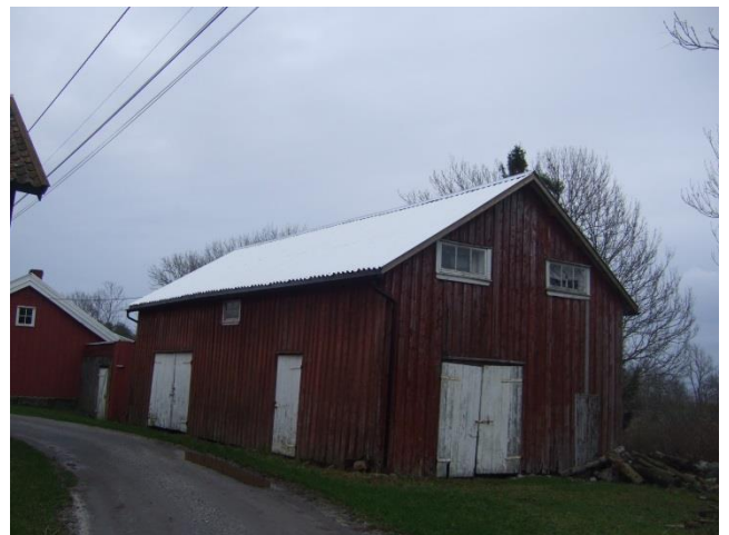
Hovedgården. Nytt blikktak på vognskjulet