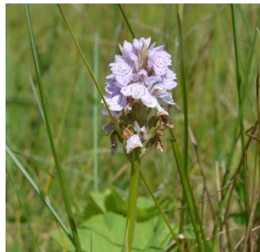
Østre Salstein, Jomfruland: flekkmariehånd i ugjødslet naturbeitemark