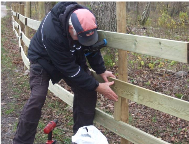
100m gjerde på Hasselgården Skiftet ut.