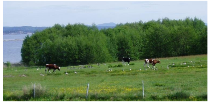
Kyr og grågås beiter side om side på Jomfruland

vært et satsingsområde. På Jomfruland har man anlagt den søndre del av