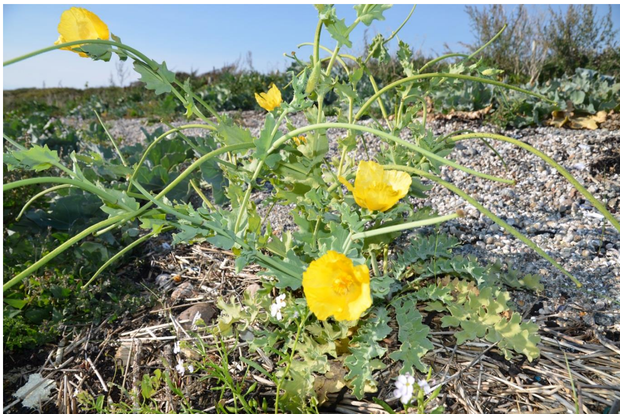
Gul Hornvalmue (fredet) funnet på Stråholmen 2014