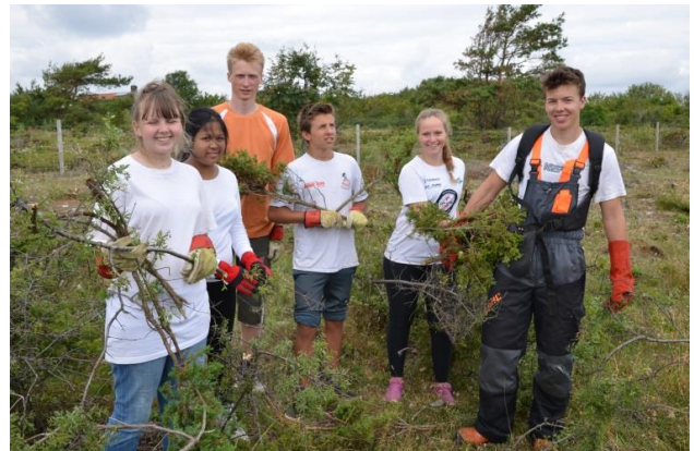
Ungdommene på Stråholmen er blitt flinke i kulturlandskapspleie.