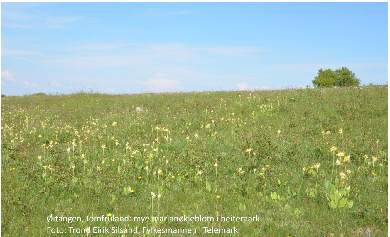
Øitangen, Jomfruland: mye marianøkkeblom i beitemark.

Fjerning av rynkerose er videreført både på Jomfruland og Stråholmen i 2014, med noe varierende resultat. Kjemisk behandling (Gåsholmen på Stråholmen; Øitangen og Sandbakken på Jomfruland) var lite virkningsfullt i år, sannsynligvis pga varmt, tørt vær. På Nordpåbakken (Stråholmen) fortsetter bekjempelse av rynkerose med sauebeite. Alle tiltakene mot rynkerose må videreføres i 2015.