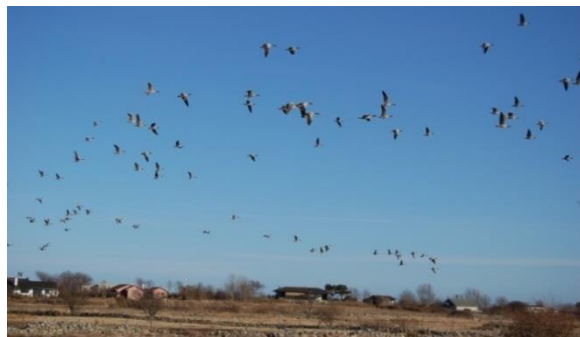
Store flokker grågås beiter på Stråholmen

Sommeren 2014 har det oppholdt seg flokker med hvitkinngås på øyene.