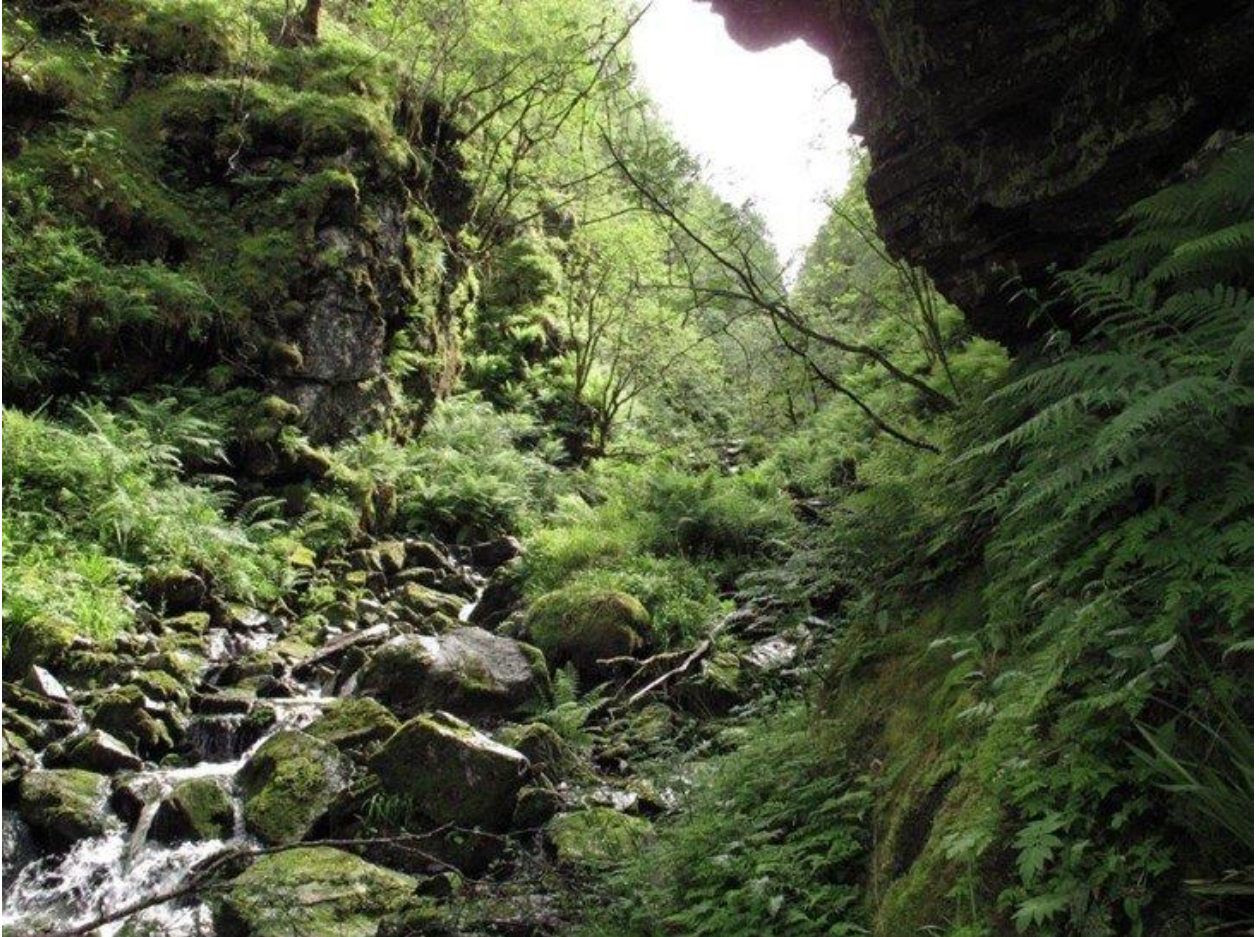
Figur 1 Biletet syner ei bekkekløft innanfor det tilrådde verneområdet. Det er ein naturtype med jamn fuktigheit i lufta der særleg kravfulle artar trivst på bergvegger og langs vassvegen. Bekkekløfter er mangelfullt dekt i skogvernet i Vestland, og Skolten som naturreservat vil bidra til å få betre vernet av denne naturtypen.

Oppretting av Skolten som naturreservat blir vedteke av Kongen i statsråd etter naturmangfaldlova § 37 a: Som naturreservat kan vernes områder som a) inneholder truet, sjelden eller sårbar natur (...) I et naturreservat må ingen foreta noe som forringer verneverdiene angitt i verneformålet. Et naturreservat kan totalfredes mot all virksomhet, tiltak og ferdsel. I forskriften kan det gis bestemmelser om vern av kulturminner i reservatet. (...)