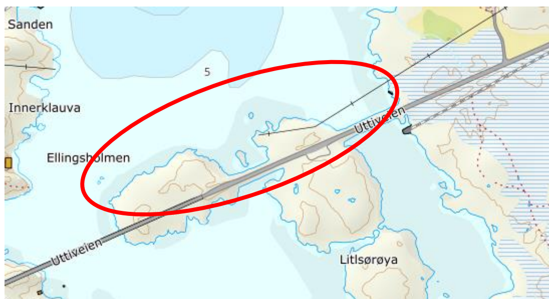
Figur 1. Tiltaksområdet ved Ellingsholmen. Område hvor det planlegges fylling i sjø er markert med rød sirkel.

Tiltaksområdet (Industriområde 1) er lokalisert ved Ellingsholmen i Frøya kommune (Figur 1). Totalt tiltaksareal på sjøbunnen er ansett å være på ca. 12 500 m 2 (Figur 2).