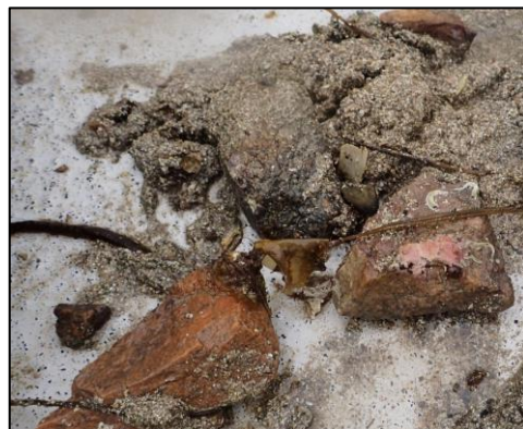
Figur 3. Det var stein og sand i alle prøver. Foto: Tony H. Johansen 29.08.19

Feltnotatene som ble laget under prøvetakingen er presentert i vedlegg 1. Ved alle stasjonene var det mye stein på bunnen (Figur 3), noe som medførte mange tomme grabbforsøk. Ellers var bunnmaterialet dominert av grus, sand og skjell, noe som indikerer en eksponert erosjonsbunn. På stasjon M2 ble det registrert svovellukt fra sedimentet.