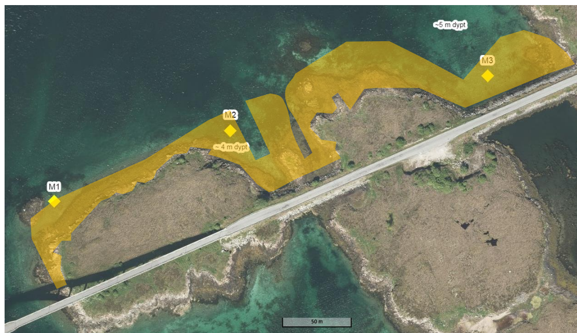
Figur 2. Betegnelse og posisjoner for sedimentuttak, samt planlagte områder for fylling (oransje områder).