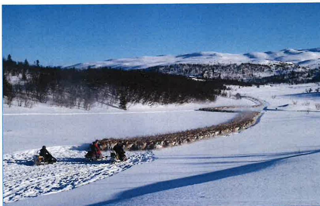
Fra flyttingen til Synnfjell

Vinterbeite strekker seg over 5 kommuner, Østre Slidre, Nord Aurdal, Etnedal, Nordre Land og Gausdal Kommune.