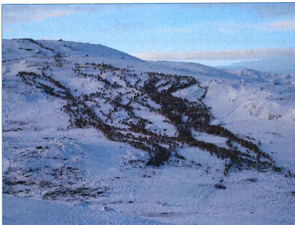
Samling til vinterslaktingen:

Selskapet har radiosendere på en del dyr og her skiftes batteri og settes på event nye sendere.