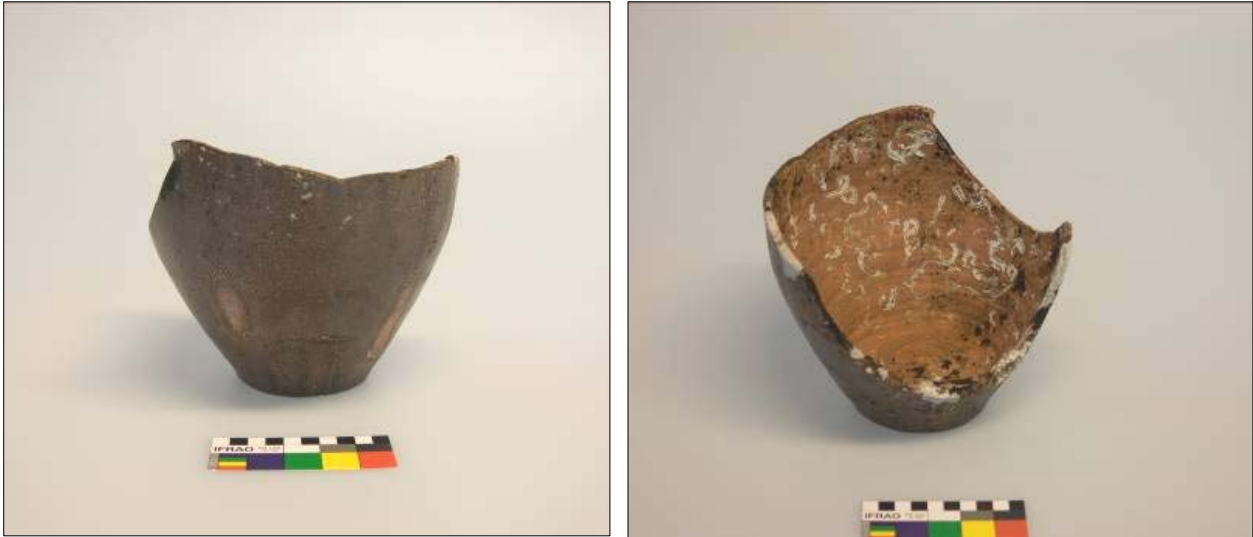
Figur 10 + 11: Bilde av Bartmannskrukke, T-25164.