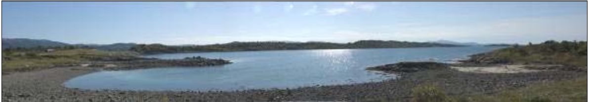
Figur 3: Bilde av Jøsnøya, tatt mot Ø.

Ved strandsonen på land ble det registrert flere åbolsteiner. Disse har i gamle dager blitt brukt, og er fremdeles i bruk, som fortøyningsstein til båter (fig. 6 og fig. 7).