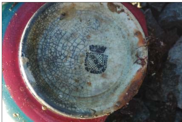
Figur 5: Bilde av porselen med stempel i bunnen fra Sarregueminas.