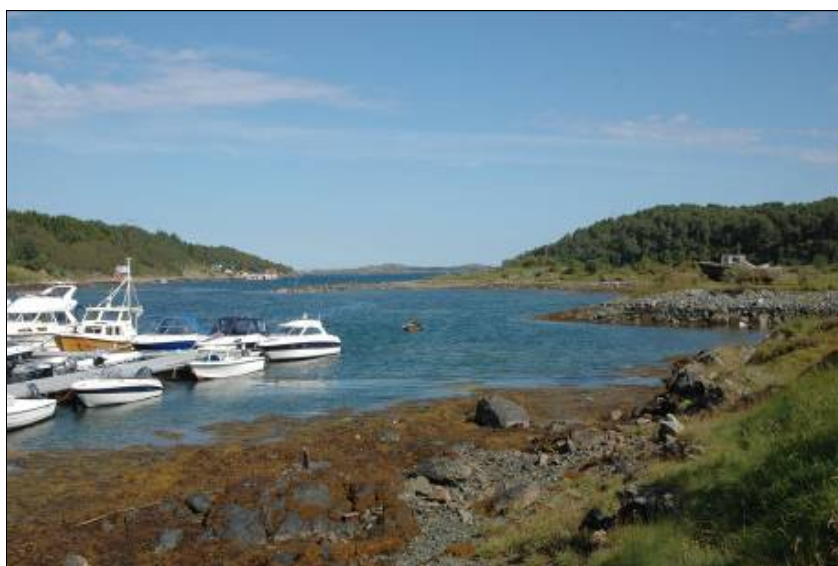
Figur 8: Bilde av småbåtshavn på Kalvøya, tatt mot N.