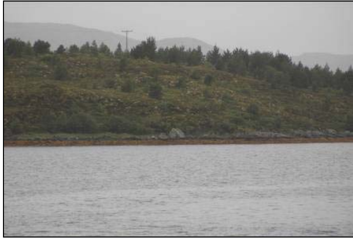
Figur 6: Bilde av åbolstein, tatt mot Ø.