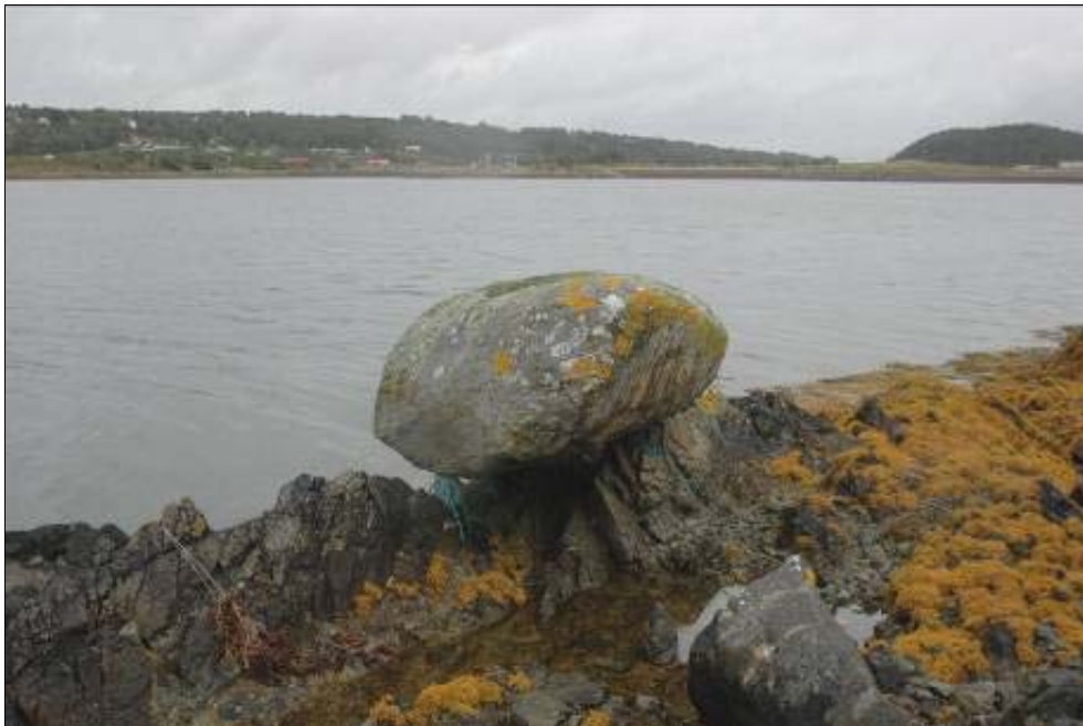
Figur 7: Bilde av åbolstein, tatt mot VN.