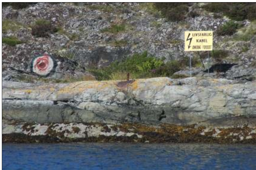
Figur 12: Bilde av T-bolt med hvitblink på Jøsnøya ved dagens hurtigbåtkai, tatt mot S.