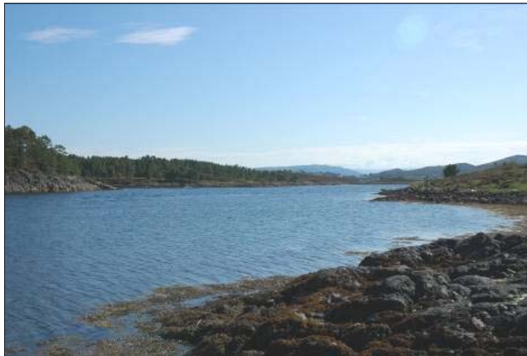
Figur 9: Bilde av Djupsundet mellom Kalvøya/Jøsnøya og Aunøya, tatt mot SSØ.

Ved strandsonen på land ble det registrert to T-bolter (fig. 12, fig. 13 og fig. 14). Disse er gamle fortøyningsfester som vitner om sjøfartshistorie på plassen, og indikatorer på tilstedeværelse av kulturhistorisk materiale under vann. De kulturminnene som ble registrert under befaringen, både på land og under vann, indikerer at sundet har vært trafikkert gjennom flere århundrer, og sannsynligvis også har blitt brukt som havn.