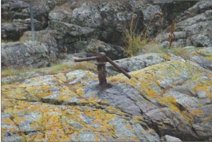
Figur 13: Bilde av T-bolt på Jøsnøya ved dagens hurtigbåtkai.