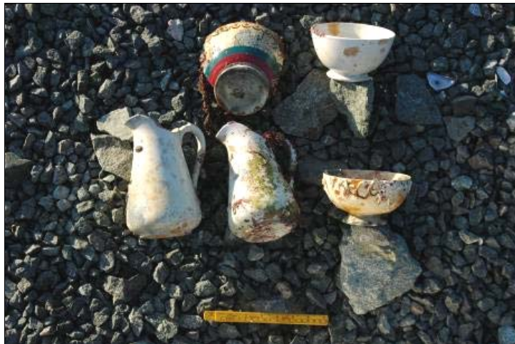
Figur 4: Bilde av porselensfunn fra Område A ved Jøsnøya.