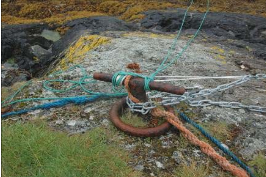
Figur 14: Bilde av T-bolt med ring, på Kalvøya ved Djupsundet.