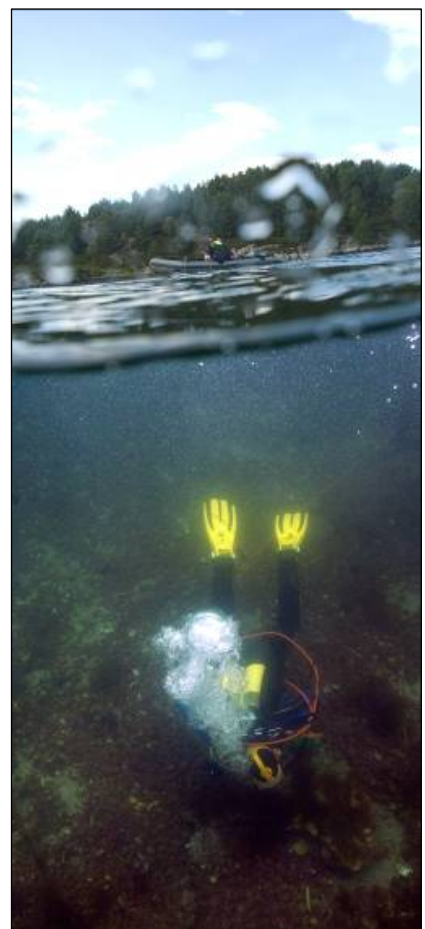
Figur 1: Dykker med kommunikasjon til overflaten.

Undersøkelsene ble gjennomført av dykkere med kommunikasjon til overflaten (fig. 1). Tiltaksområdene ble visuelt besiktiget av dykkerne. Det ble utført manuell sonding for å avdekke eventuelle strukturer eller gjenstander nede i bunnsedimentene. Der det ble påtruffet anomalier i sedimentene, ble det gravd lett med graveskje for å undersøke disse. Spesielt grunne områder ble befart med snorkling i overflaten.