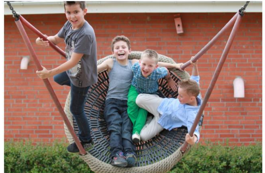
Barn i lek.

For å styrke oppfølgingen av utsatte barn, unge og deres familier vedtok Stortinget nye bestemmelser om samarbeid, samordning, barnekoordinator og individuell plan. Utdanningsdirektoratet, Barne-, ungdoms- og familiedirektoratet, Arbeids- og velferdsdirektoratet og Helsedirektoratet har hatt felles oppdrag om å utarbeide veilederen.