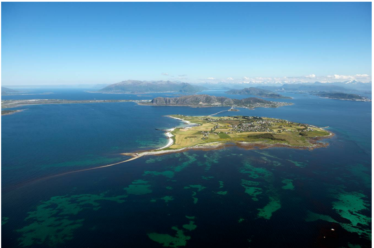
Figur 1. Flyfoto over Giske med deler av Giskerevet. Foto tatt mot øst. Valderøya og Vigra i bakgrunnen.

Det vart halde eit folkemøte den 13. mai på Giske rådhus. Her møtte omlag 30 personar. Fylkesmannen og Dupont Nutrition Norge AS haldt kvar sin presentasjon. Fylkesmannen fekk mange gode innspel også frå brukarene av områda med synspunkt på eventuelt marint vern. Vi har ikkje summert opp desse innspela på ein systematisk måte, men tok eit referat og tar innspela vidare med i prosessen, sjå referat i vedlegg 1.