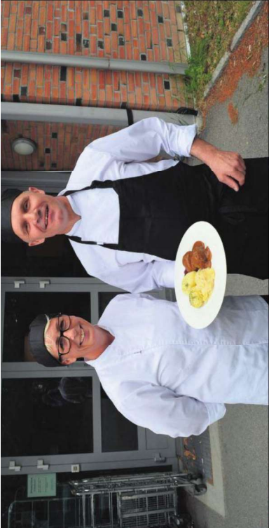
STØTTE: Her er støtte fra klimamasatsmidlene går til storbedrifter.