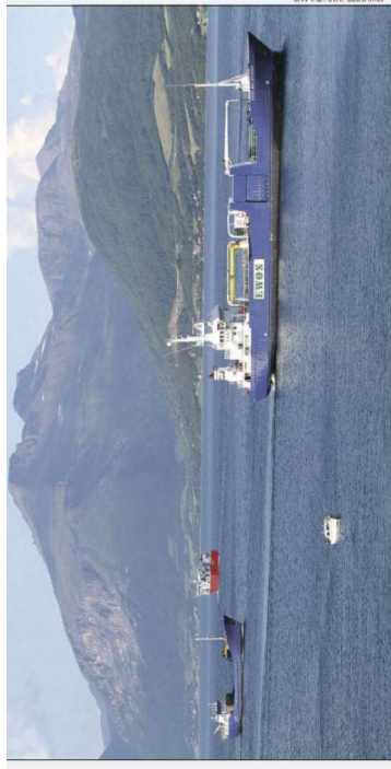
ØKONOMI: Transporter av råvarer og produkter er blant de største utslippskilder.

Støtten vil bidra til å redusere utslippene av klimagasser med 50 prosent innen 2030.