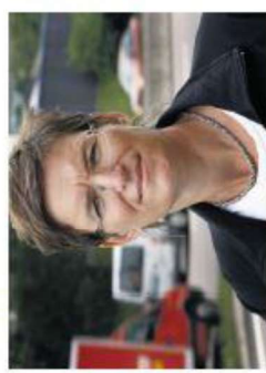
- Vi har prioritert ambisiøse prosjekter som bidrar til å redusere utslippene av klimagasser.

Miljødirektoratet har nå fordelt de 150 millionene i KLIMASATSORDNINGEN på prosjekter i rundt 110 kommuner.