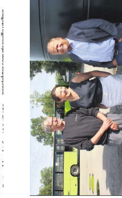
KLIMASATS: Miljødirektoratet deler ut 150 millioner kroner i Klimamasats-støtte i 2024.

Moss kommune får tilskudd fra klimamasatsmidlene. Dette er en viktig del av kommunens klimaplan, som har som mål å redusere utslippene av klimagasser med 50 prosent innen 2030.