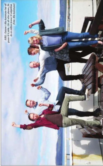
Alta kommunen har fått støtte til klimatiltak.

Alta kommunal bygningsvesen har fått støtte til klimatiltak og har fått innvilget midler til å gjennomføre tiltak som bidrar til å redusere utslippene av klimagasser. Dette er en viktig del av kommunens klimaplan, som har som mål å redusere utslippene av klimagasser med 50 prosent innen 2030.