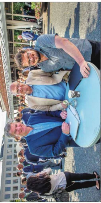
IFRONT: Gjenvinnere er i front på miljøtiltak.

BALSFJORD: Miljødirektoratet deler ut 150 millioner kroner i Klimamasats-støtte i 2024. Dette er en viktig del av kommunens klimaplan, som har som mål å redusere utslippene av klimagasser med 50 prosent innen 2030.