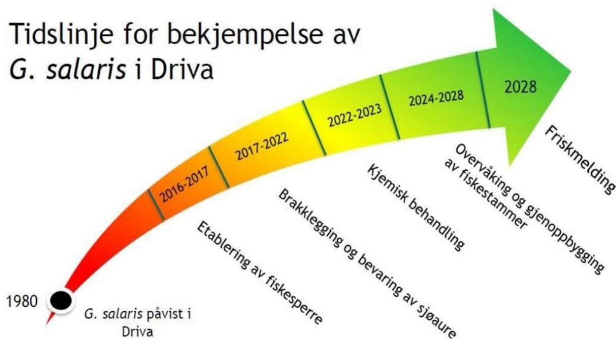
Figur 2: Tidslinje for bekjempelse av G. salaris i Drivaregionen.

I Driva er det bygget en fiskesperre ved Snøvassmelan. I Usma er fisketrappa ved Fallfossen stengt, i tillegg til at vandringsbarrieren over fossen er forsterket. Disse punktene vil forbli sperret for fiskeoppgang inntil vassdragene er friskmeldt. I Driva har det fra og med 2017 blitt flyttet sjørret over sperra.