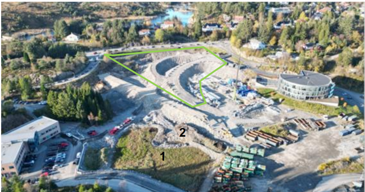
Figur 1 Områdene markert 1 og 2 angir plassering av sedimentene i dag. Det grønne området angir plassering sted for plassering av massene

Nåværende og fremtidig plassering av massene er vist i figur 1.