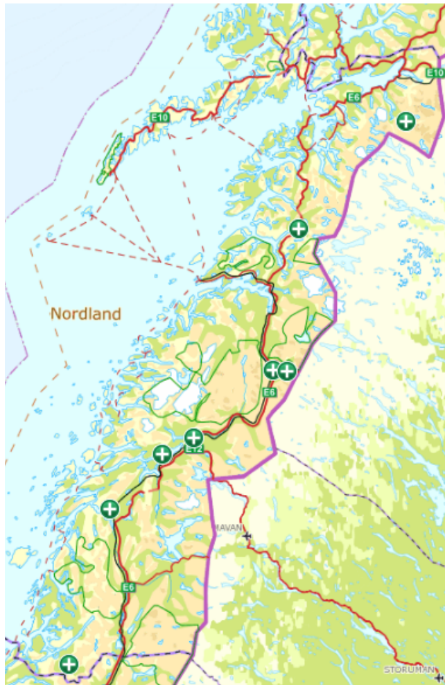
Figur 3: kjent avgang av åtte gauper siden 1. oktober 2020 i Nordland. I september 2020 ble en forlatt gaupeunge avlivet av SNO på grunn av dyrevernmessige årsaker i Narvik. I januar 2021 ble det påkjørt en gaupe i Rana. Videre ble en gaupe felt på skadefelling i Saltdal kommune i mars 2021. De resterende fem gaupe ble felt under kvotejakta. Kilde: Rovbase.