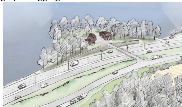
Figur 7-21: Illustrasjon som viser hvordan forholdene på Fjordheim vil bli, i alternativ 2.

Den 5. september 2023 brukte kommunens administrasjon sin makt over utbygger og fikk tilsagn på kjørebru over 4-felts motorveg til Fjordheim (som kommunen eier). Vi har ikke møtt noen administrativ forståelse for de farlige og problematiske trafikkforholdene på Smedmoen-Skulhus. Politisk har vi imidlertid møtt forståelse. Vi vil heller bruke pengene der de gir nytte for befolkningen, enn på Fjordheimsodden som bør gis tilbake til naturen og folk til fots og med båt. Fjordheim Galleri fortjener bedre lokaler, med tett tak.