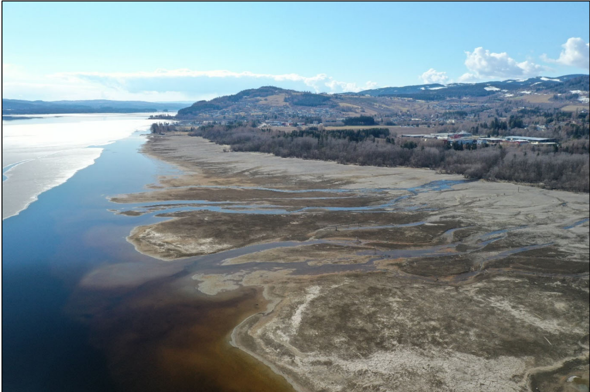
Figur 7. Deltaformasjonen på Svennesvollane.