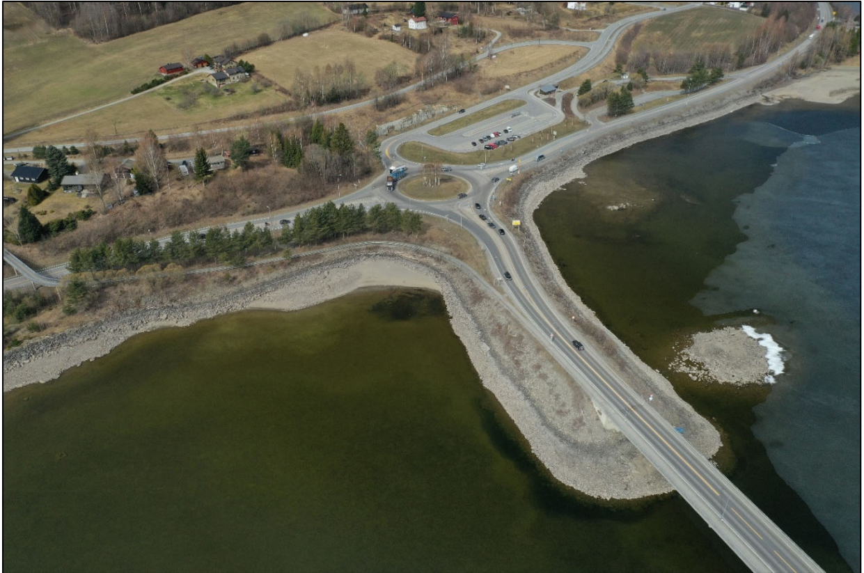
Figur 5. Brufeste på vestsiden for eksisterende Mjøsbrua.