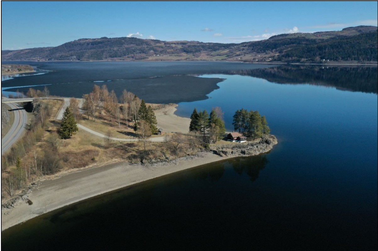
Figur 6. Kremmerodden.