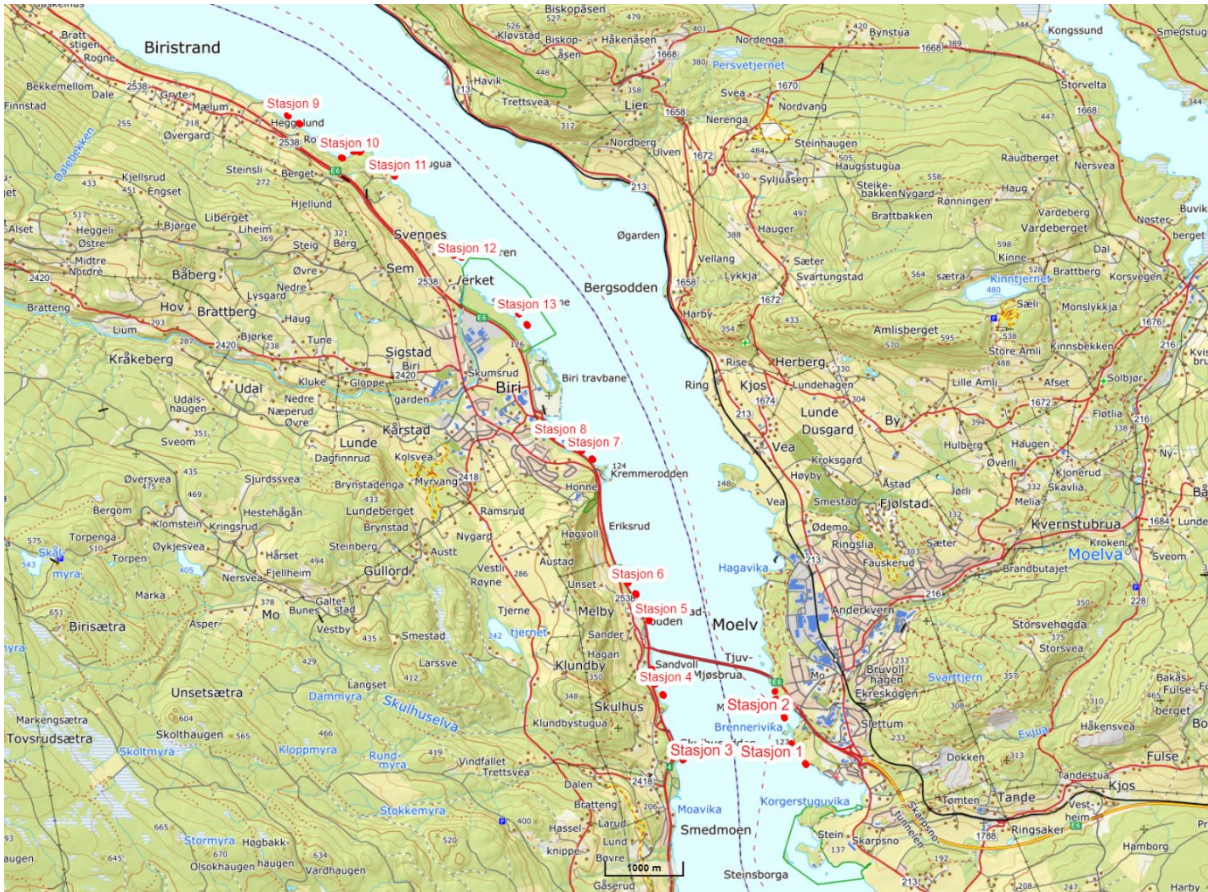
Figur 1. Oversikt over beliggenheten til 13 stasjoner i strandsona i Mjøsa fra Moelv til Roterud som ble undersøkt med elektrisk fiskebåt i 2021.