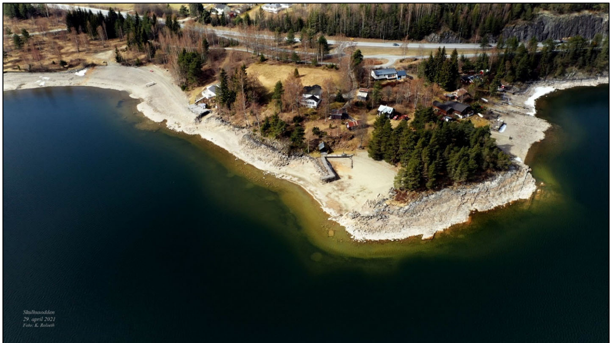
Figur 4. Skulhusodden.

Lenger nord på strendene ligger Skulhusodden med mer klippe-bergformasjoner (figur 4).