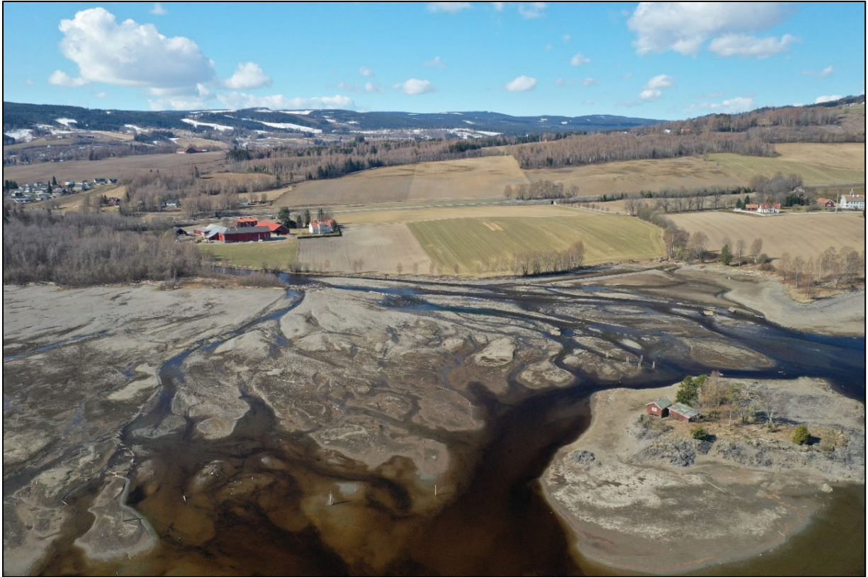
Figur 8. Vismundas deltaformasjon i munningspartiet ved Fluren.