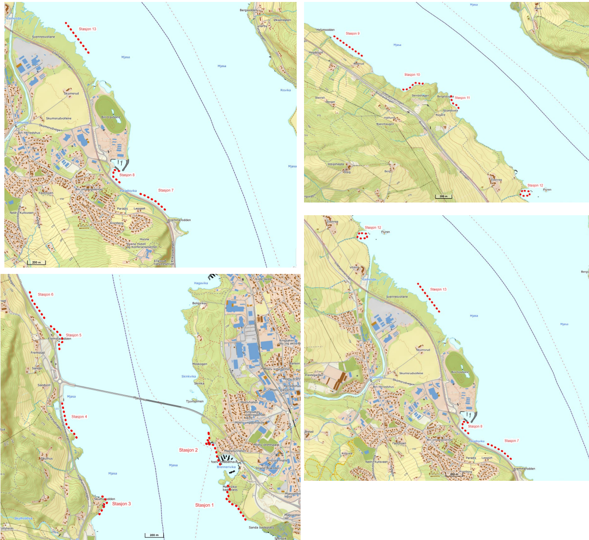
Figur 2. En mer detaljert utsnitt av beliggenheten til de 13 stasjonene i Mjøsa fra Moelv til Roterud som ble undersøkt med elektrisk fiskebåt i 2021 (for oversikt se figur 1).