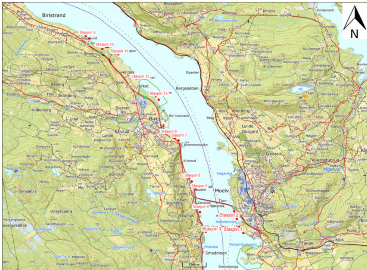
Figur 1. Oversikt over beliggenheten til 13 stasjoner i strandsona i Mjøsa fra Moelv til Roterud som ble undersøkt med elektrisk fiskebåt i 2021.