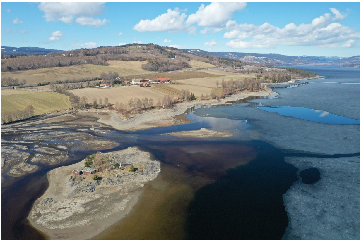
Figur 9. Strekingen fra Fluren til Roterud.