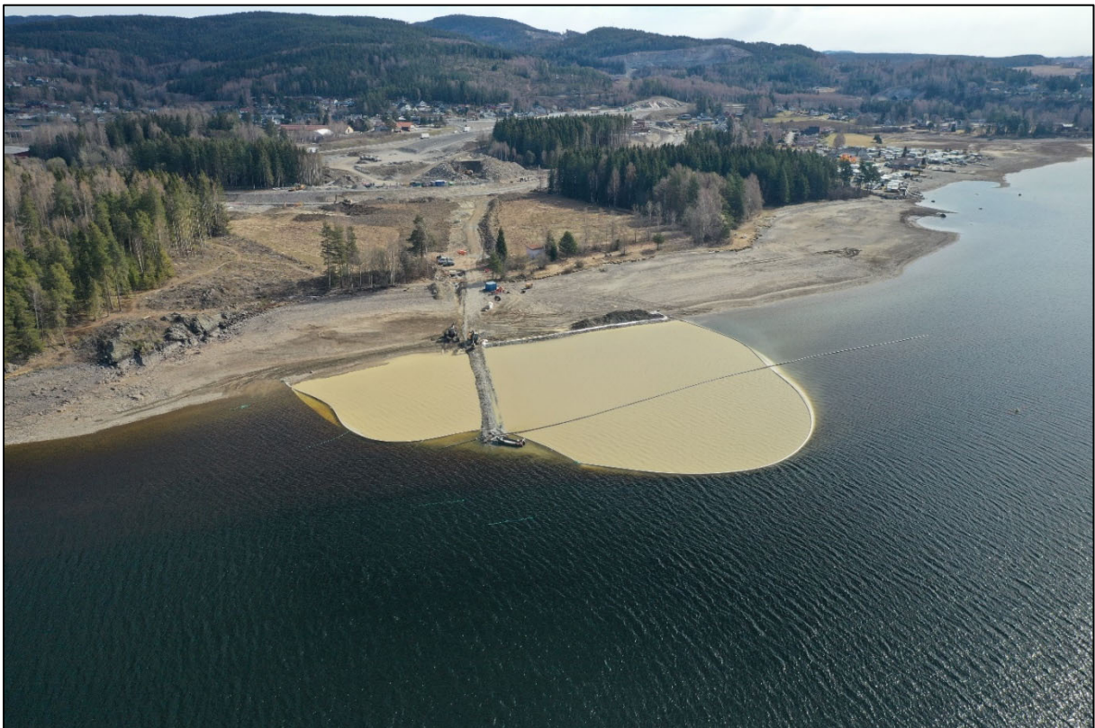
Figur 3. Planlagt brufeste ved Moelv.

Man ser en del algevekst, brunlig, i strømmene ut fra Moelva og nedover langs stranda. Dette er muligens brune humuspartikler fra elva som farger grønne påvekstalger i munningen. Bunnsystemer for NiN er stort sett limnisk eufotisk sedimentbunn. Ingen forekomst av antatt forvaltningsrelevante NiN.