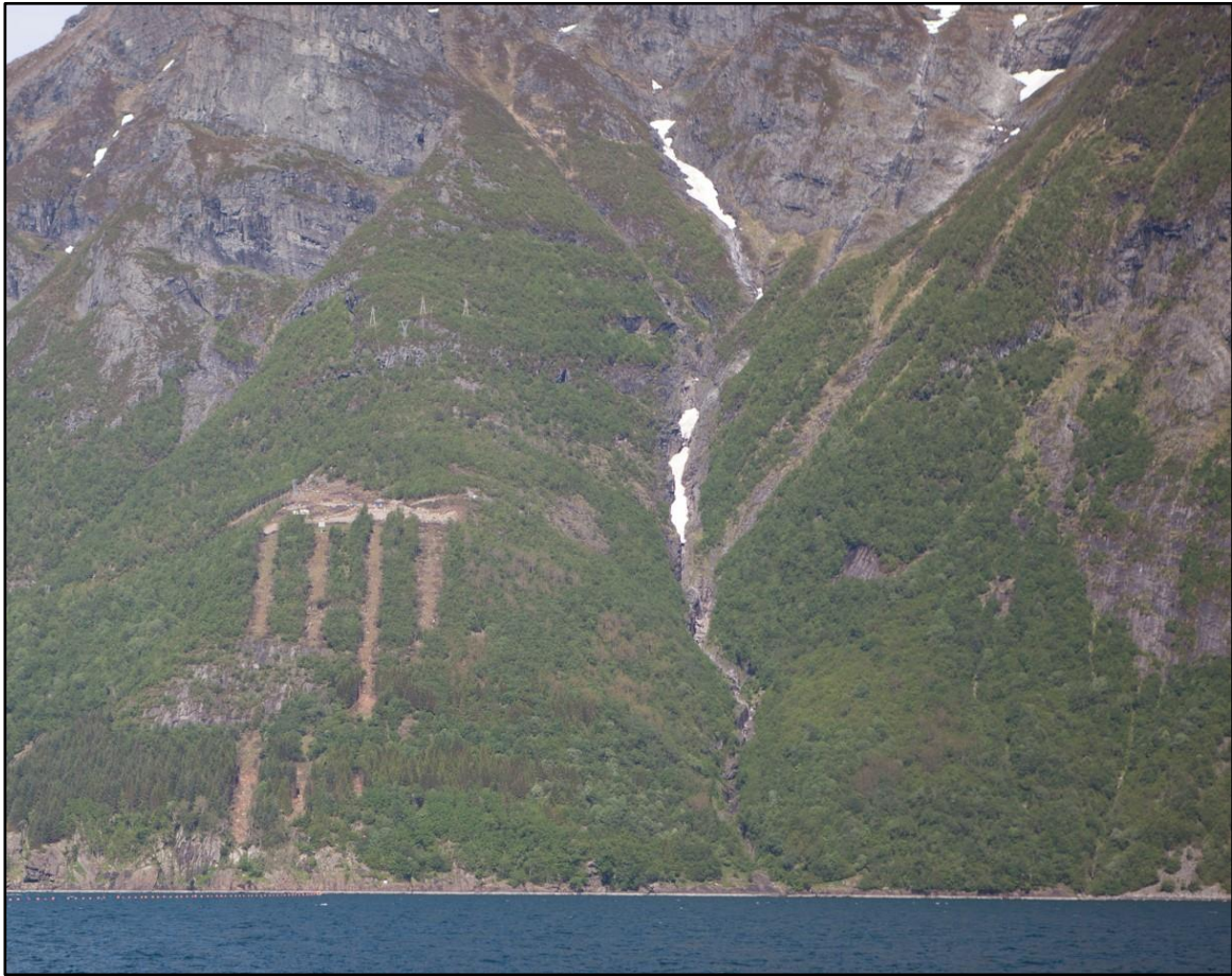
Figur 1 Statnett si 420 kV-line og Molaupsfonna.