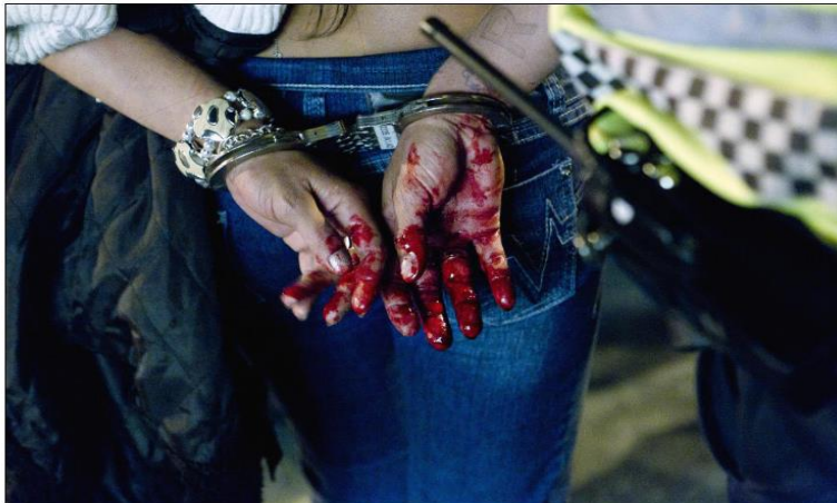
TRONDHEIM: Ei jente i Nordre gate i Trondheim har knust et ølglass i hodet på ei annen jente, og arresteres av politiet. Mesteparten av volden i Norge skjer i de tusen hjem, men nest etter hjemmet er utelivsområdene de farligste stedene å oppholde seg, ifølge politiet.