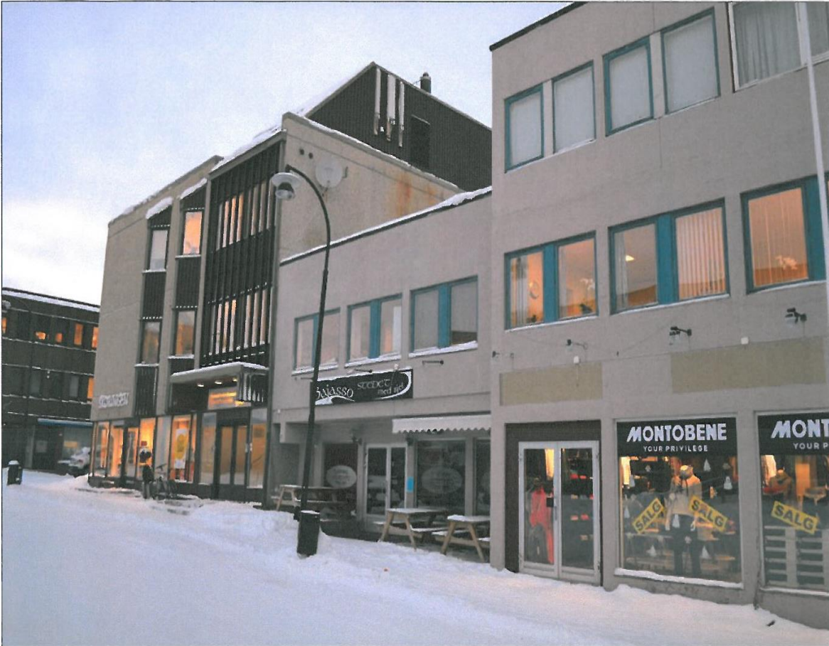
FÅR MEST JULING: Det er skjenkestedet Bajasso som får gjennomgå mest av kontrollørene, etter besøket midtveis i desember. Opticom blir dog også beskyldt for alvorlig brudd på skjenkereglene.