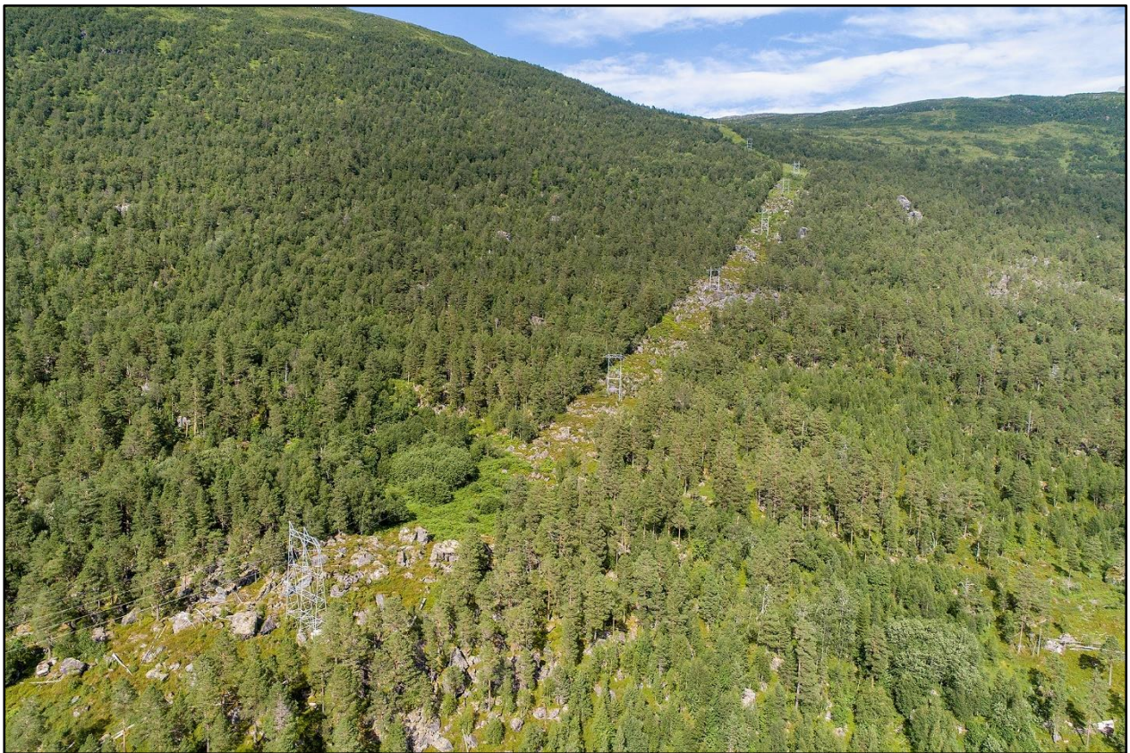
Figur 1 Austre del av tilbudsområdet med Statnett si 132 kV-line

Området er sett av til LNF-område i kommuneplanen sin arealdel.