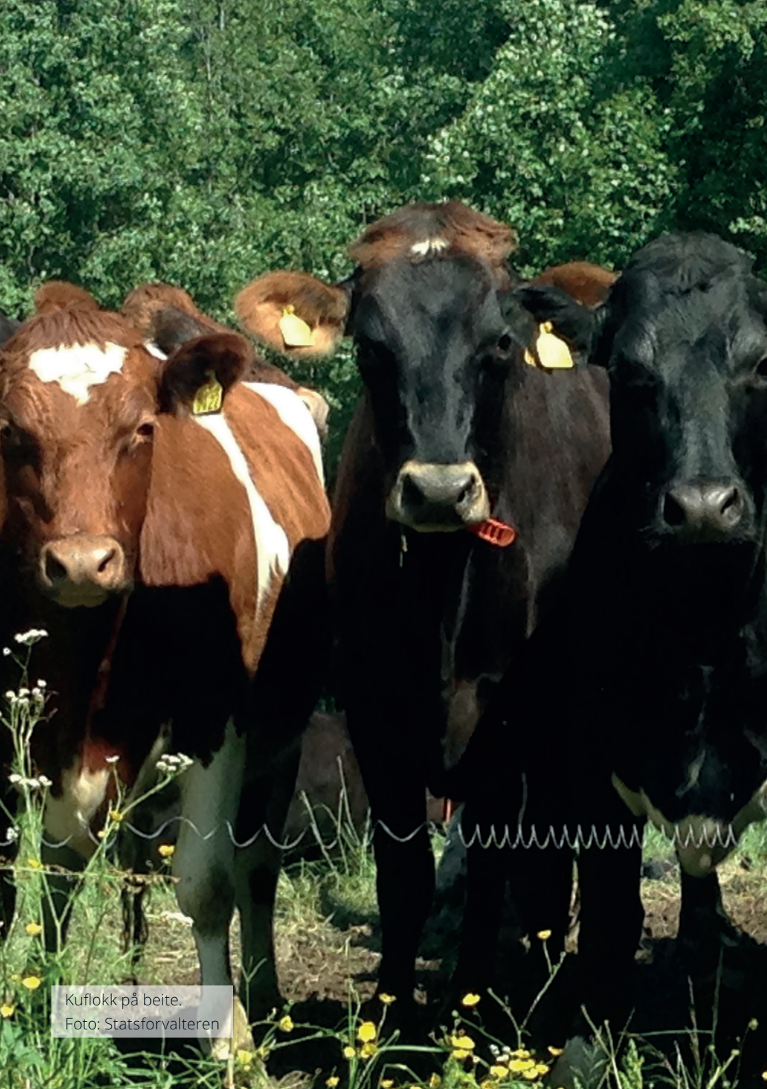
Kuflokk på beite.