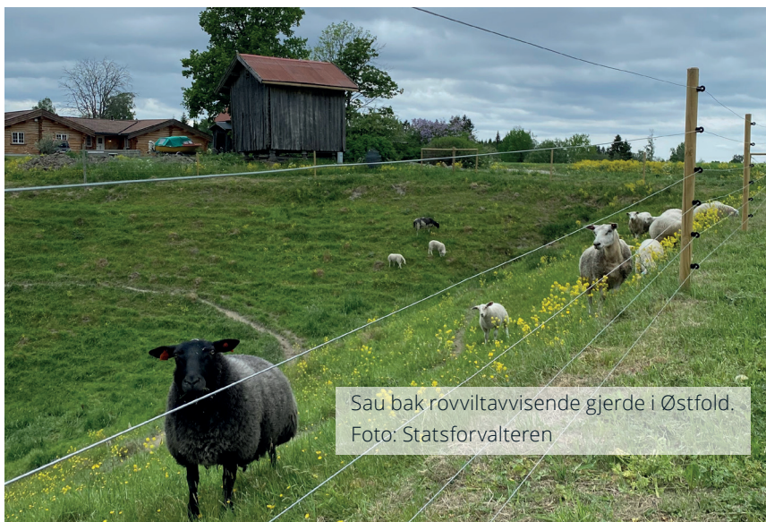
Sau bak rovviltavvisende gjerde i Østfold.

Konfliktdempende tiltak er tiltak som skal bidra til kunnskap om rovvilt, rovviltforvaltning og konflikthåndtering. Tiltak rettet mot barn og unge skal prioriteres. Kommuner, organisasjoner og personer kan søke om tilskudd til konfliktdempende tiltak for å øke kunnskapen om rovvilt og rovviltforvaltningen. Eksempler på slike tiltak er temakvelder, undervisning, konferanser og forskning.