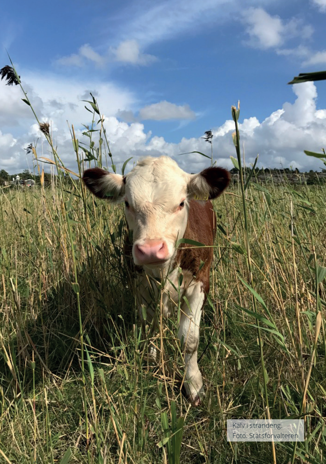
Kalv i strandeng.