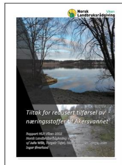
Rapport NLR-Viken 2018