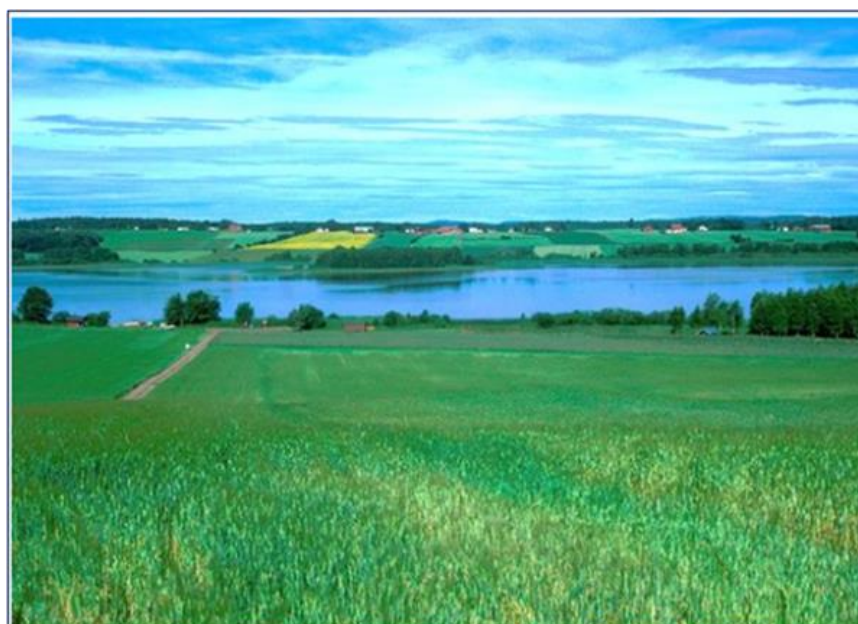
Akersvannet i Tønsberg og Sandefjord

Akersvannets nedbørfelt (rød grenselinje) med erosjonsrisikoklasser og dråg, NIBIO Kilden