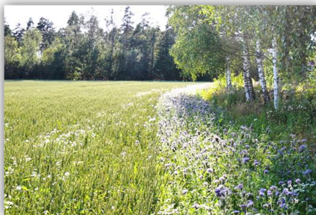
Blomstrande sone på Melsom, Sandefjord kommune.

Øvre grense for tilskot per føretak er 2000 meter