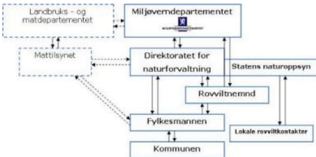
Oversikt over offentlige aktører i rovviltforvaltninga. (figur skal oppdateres)

Mattilsynet er en viktig samarbeidspartner for rovviltmyndighetene, både i enkeltsaker og i mer langsiktig og overordna arbeid. Mattilsynet møter fast i Rovviltnemndas møter som observatør.