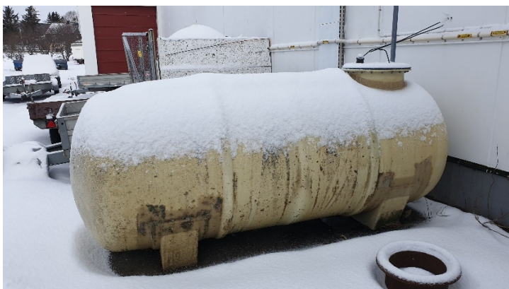
Figur 1. Lagertank for fyringsolje uten sikring mot lekkasjer til grunnen.