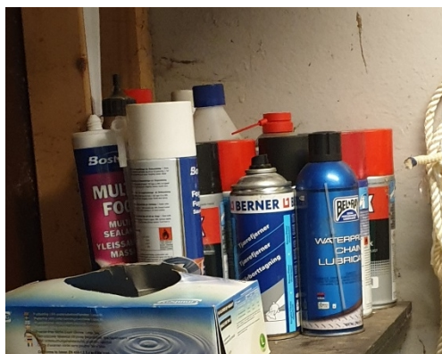
Figur 2. Horns slakteri AS bruker produkter på sprayboks.

I vår befaring observerte vi at Horns slakteri AS bruker flere forskjellige sprayboks-produkter (figur 2). Tomme spraybokser inneholder ofte rester av farlige stoffer og skal i så fall leveres som farlig avfall. Ut fra hva som er registrert i avfallsdeklarerer.no har Horns slakteri AS ikke deklarerert tomme spraybokser som farlig avfall (gjelder perioden 2015-2021).