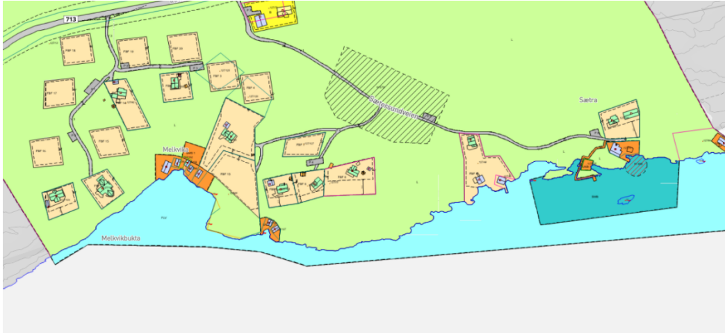
Forslag til ny reguleringsplan med småbåthavn i Sætersundet