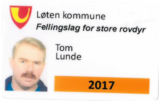
Forslag på ID-kort fra Løten kommune.

Fellingspersonellet er ute med våpen på en tid på året når det er lite annen jakt. Det kan også være mange friluftsfolk og beitebrukere ute i terrenget sommerstid. Det er derfor smart hvis kommunene lager et eget ID-kort som alle medlemmene på fellingslaget kan identifisere seg med.