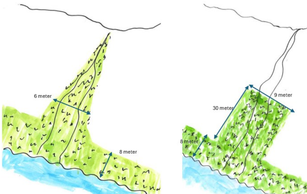
Illustrasjon: Gras i dråg med 6 m bredde ned til buffersone langs vassdrag t.v. Bremsekloss på 30 m langs dråget og 9 m bredde th. Statsforvalteren i Vestfold og Telemark