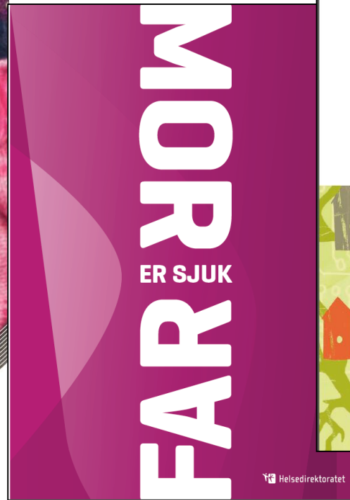
Regelverk om barn som pårørende 2010