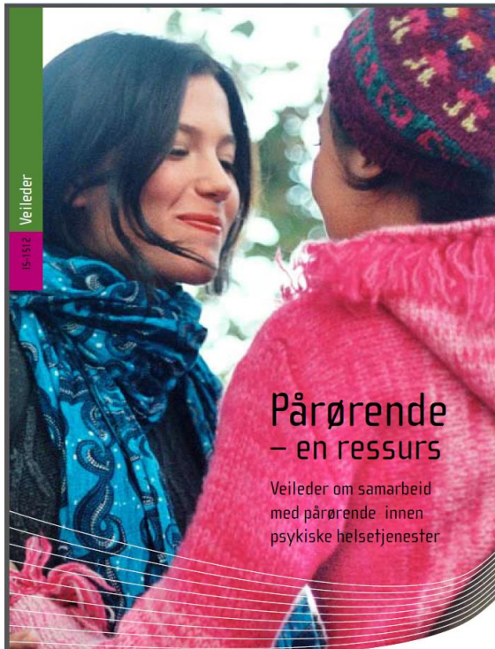
Forrige pårørendeveileder 2008