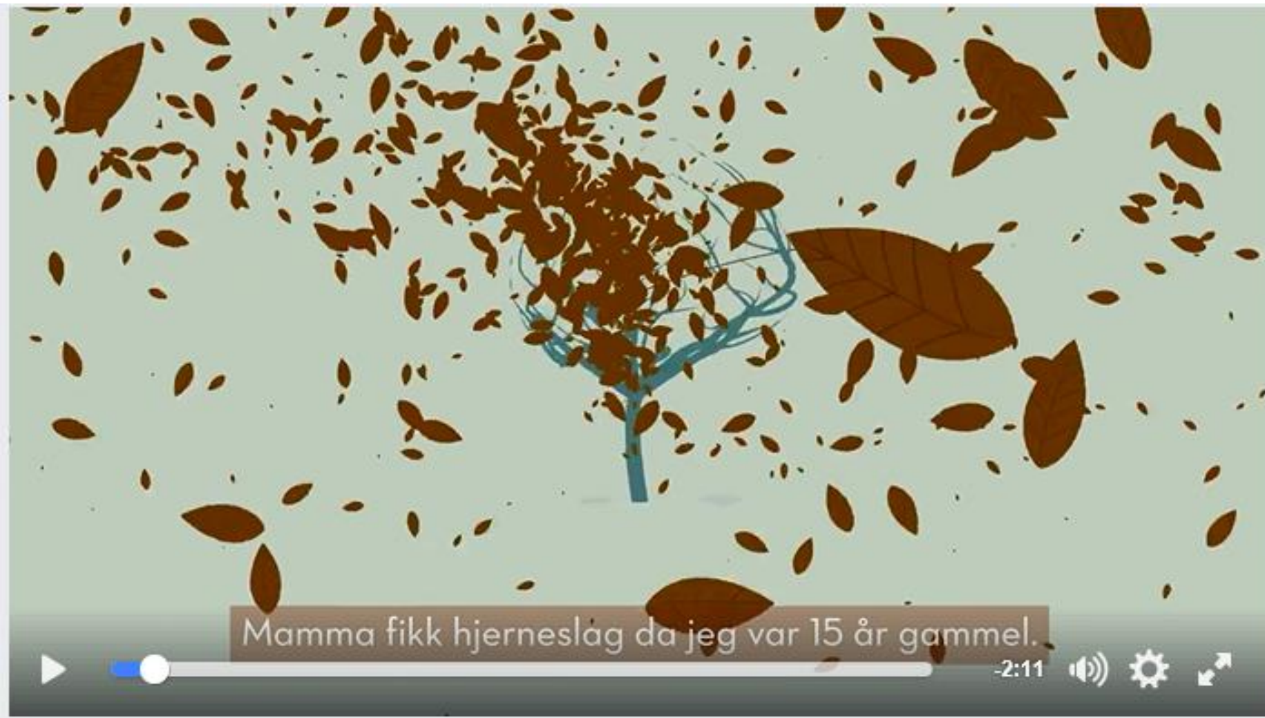
Film om pårørende – 2 minutter (Youtube)