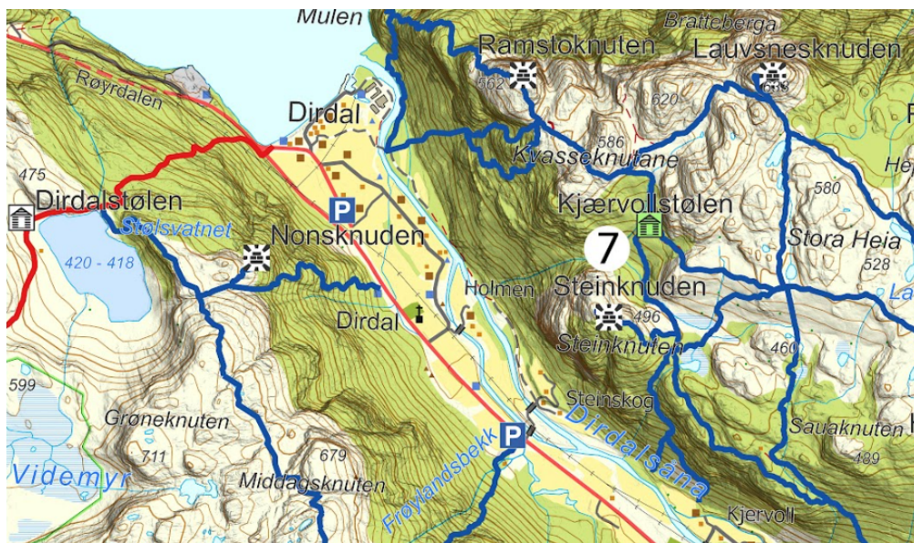
Figur 2 Utklipp fra Stølsforening sitt kart.