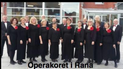
Operakoret i Rana

Mosjøen kulturhus lørdag 23. september kl. 18.00